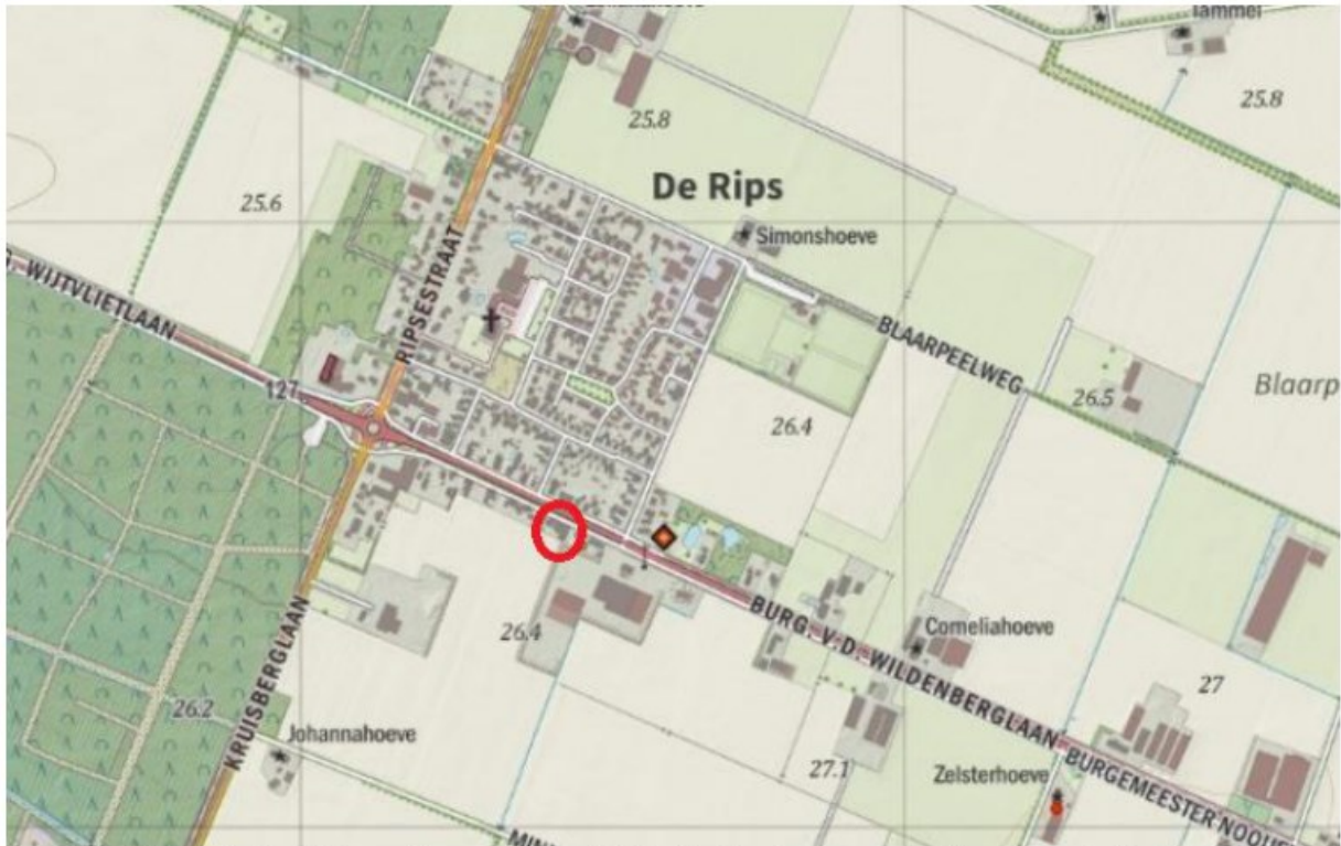
Afbeelding 1: De projectlocatie ten zuiden van de kern De Rips, is globaal weergegeven binnen de rode cirkel.

Het plangebied is gelegen ten zuiden van de kern van De Rips, in de gemeente Gemert-Bakel, liggende in de provincie Noord-Brabant (zie afbeelding 1).