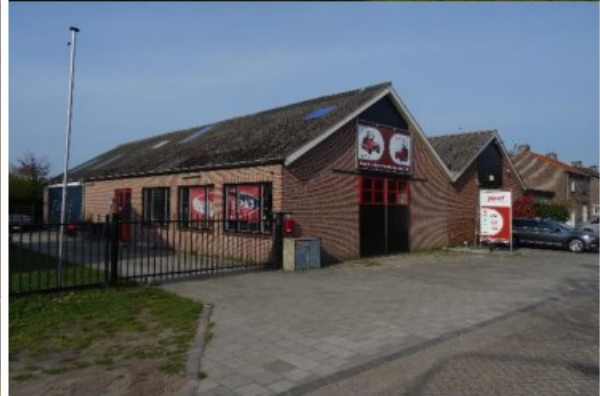
Afbeelding 3 t/m 6: Bestaande te slopen gebouwen op de kavels. Bron: . Datum: 04-05-2021