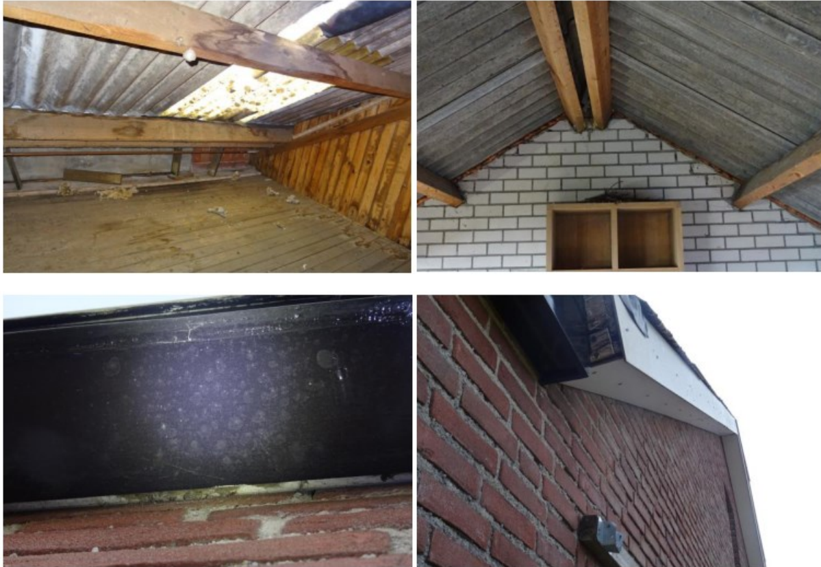
Afbeelding 9 t/m 12: Afwezigheid van mogelijk geschikte openingen naar verblijfruimten voor vleermuizen. Dit door deels de afwezigheid van dakbeschot, de afwezigheid van dakpannen/ deels plat dak, de aanwezige dwarslat onder boeiboorden/ gevelbekleding zonder geschikte gaten/ kieren, kieren en spleten zijn afgedicht met purschuim. Bron: . Datum: 04-04-2021