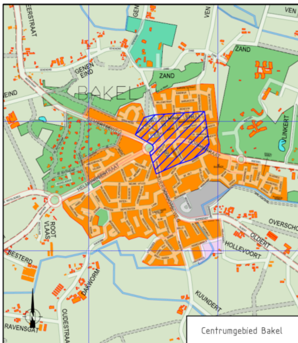
Figuur 2: centrumgebied Bakel