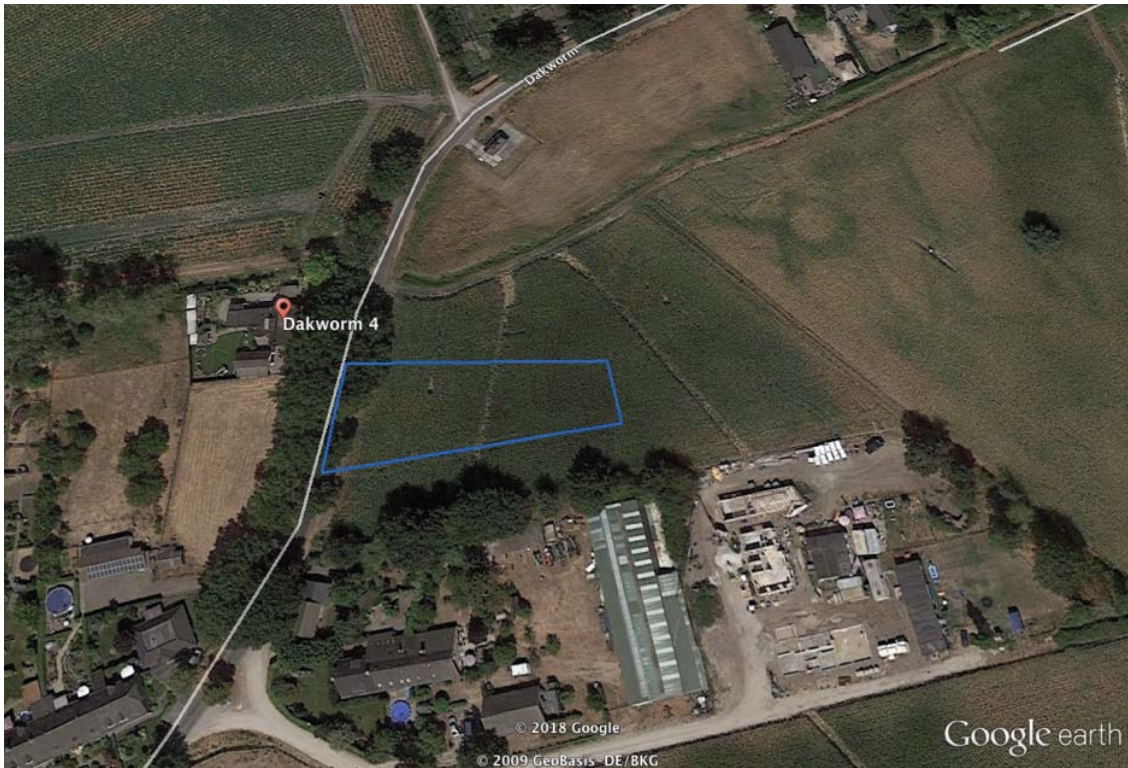
Afbeelding 1: ligging plangebied in blauw

Het betreft een akkerperceel waarop maïs is geoogst. Opgaande groenstructuren zoals bomen of struiken ontbreken op de locatie. Langs de weg Dakworm staan enkele zomereiken. Watervoerende structuren ontbreken op de planlocatie eveneens. Men is voornemens een woning te realiseren op de locatie.