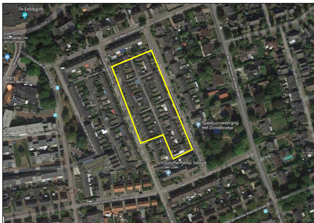
Figuur 2. Globale begrenzing van het plangebied (gele lijn)