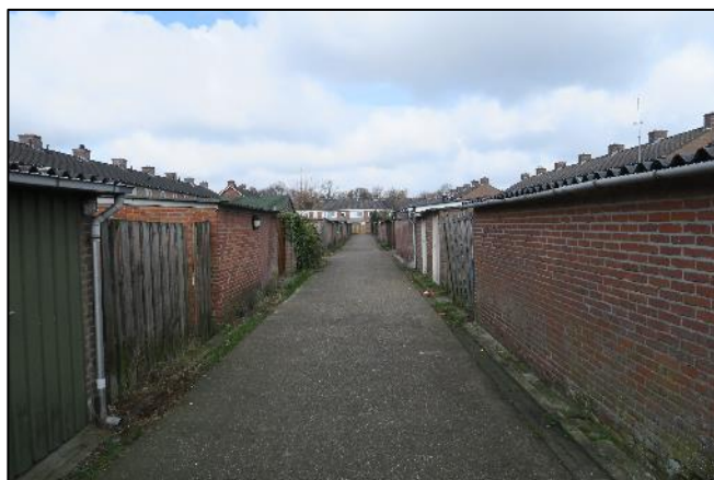
Foto 6. Achterzijde woningen met schuurtjes aan de Drossard Meijerstraat en Dr. Douvenstraat