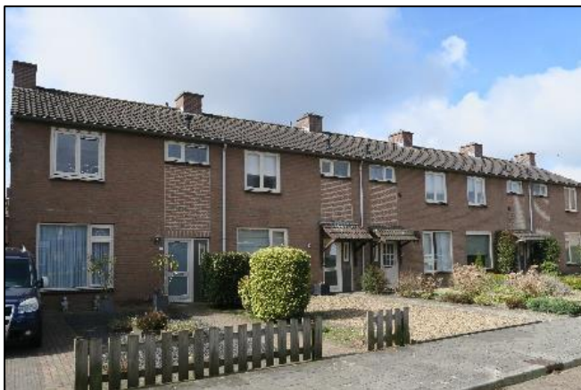
Foto 1. Woningen aan de Dr. Douvenstraat