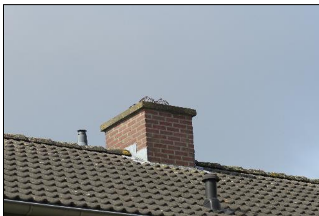
Foto 4. Dak woning aan de Drossard Meijerstraat