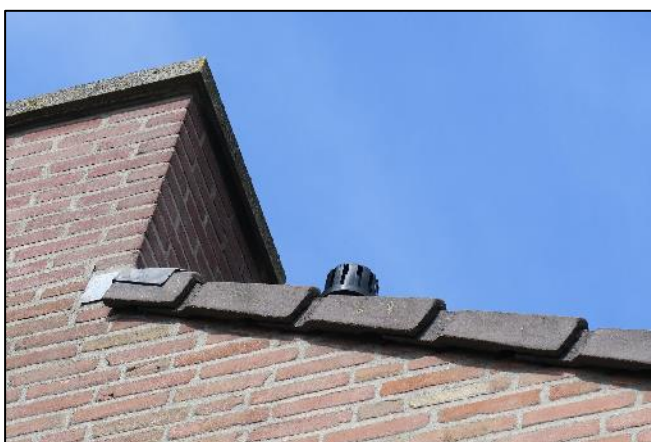
Foto 3. Dak woning aan de Dr. Douvenstraat