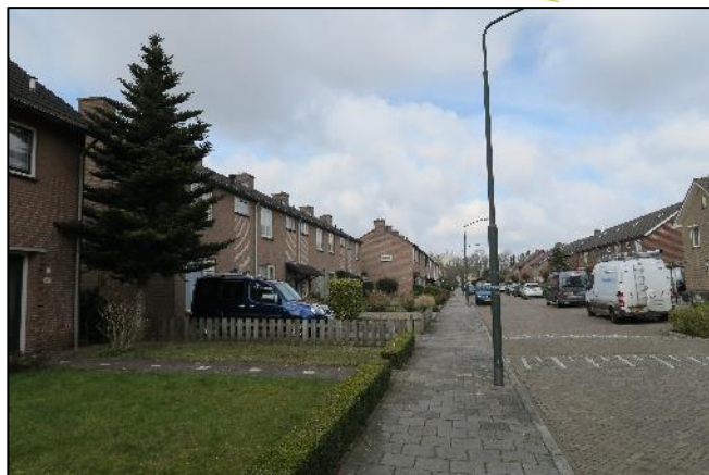
Foto 2. Woningen aan de Dr. Douvenstraat