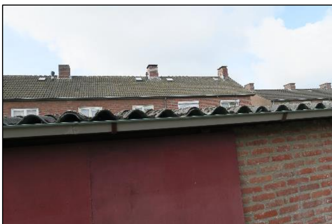
Foto 5. Achterzijde woningen Drossard Meijerstraat