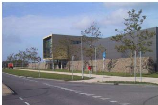
kantoor duidelijk herkenbaar, loods wordt genuanceerd door vormgeving als plint met opbouw