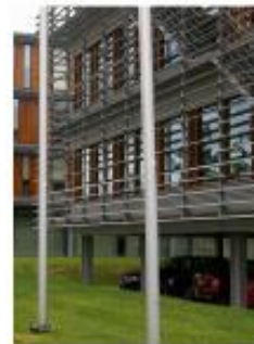
verdiept parkeren onder gebouw