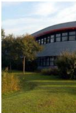
groen ingericht eigen terrein