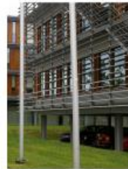
verdiept parkeren onder gebouw