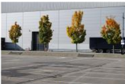
iets verdiept parkeren in de buitenruimte

Diverse voorbeelden op welke wijze parkeerplaatsen kunnen worden aangelegd: