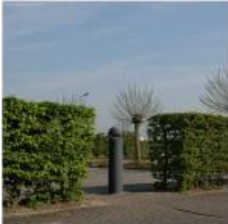
parkeren achter hagen

Het is de bedoeling dat parkeren zowel voor personeel als voor bezoekers op het eigen bedrijfsperceel plaatsvindt. Hieronder volgen een aantal referentiebeelden welke van belang kunnen zijn voor de vervaardiging en toetsing van een erfinrichtingsplan.