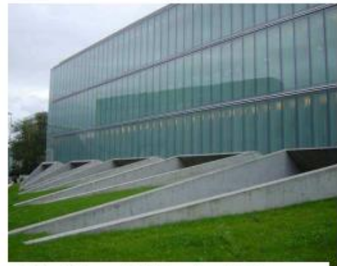
ondanks dichte gevel toch bijzondere uitstraling, aandacht besteden aan beeldvorming