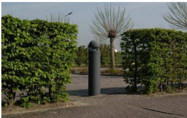
lage haag als erfafscheiding aan voorzijde