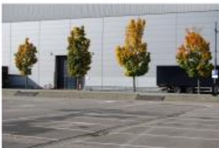
iets verdiept parkeren in de buitenruimte

Diverse voorbeelden op welke wijze parkeerplaatsen kunnen worden aangelegd: