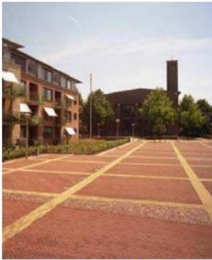
referentiebeelden inrichting (verlengde) Beerze