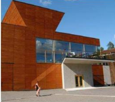
referentiebeelden woning geïntegreerd in bedrijfsgebouw