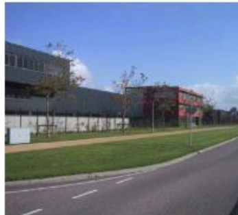
langs belangrijke routes liggen de gebouwen in één rooilijn, bebouwing oriënteert zich op openbare weg