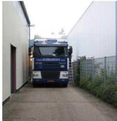
afstanden tussen de gebouwen onderling dienen voldoende groot te zijn om dit soort beeldvorming te voorkomen