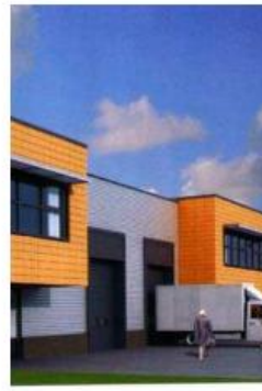
Interne loading docks