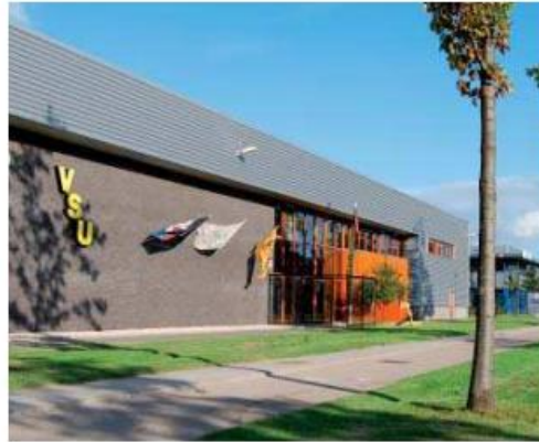
bedrijfsnaam op de gevel