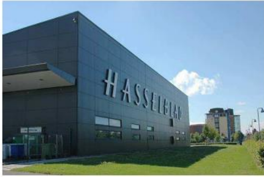
een gesloten doch representatieve geveluitstraling