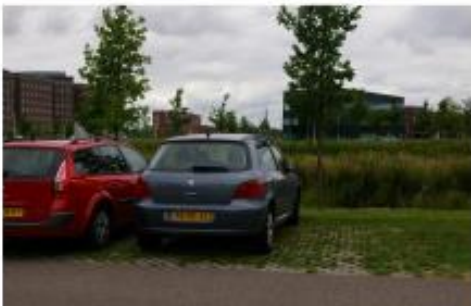
parkeren op groene ondergrond