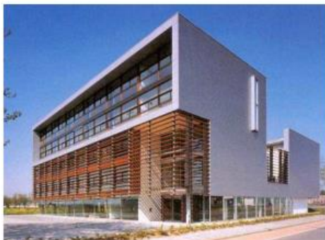
alzijdige oriëntatie bedrijfsgebouw

De massa van de gebouwen is zorgvuldig opgebouwd. De massa's zijn herkenbaar, een hoger bouwdeel is ook echt hoger (minimaal 2 meter), zodat het duidelijk afleesbaar is. De massa van de gebouwen is robuust, er is geen reeks van kleine ondergeschikte aan- en bijgebouwen. In de kavelschema's is aangegeven welke bouwhoogtes gehanteerd worden.