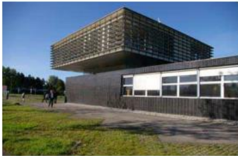
hoger bouwelement duidelijk herkenbaar

aan licht en is de entree duidelijk herkenbaar. De oriëntatie van de bebouwing is naar het openbare gebied, dit stelt extra voorwaarden aan hoekkavels, die een tweezijdige oriëntatie kennen. Achterkanten komen niet in het zicht naar de openbare ruimte toe. Ook de dichtere gevels kunnen een goede uitstraling krijgen door het toepassen van mooie materialisering en detaillering. Afgestemd zorgvuldig kleurgebruik kan hierin ook een belangrijke rol vervullen. Het is te overwegen kleurafspraken te maken voor alle gebouwen in Wolfsveld 2.