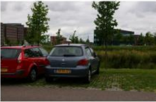
parkeren op groene ondergrond