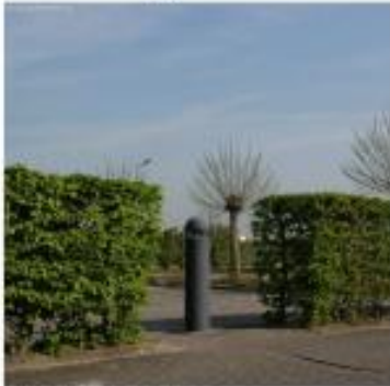
parkeren achter hagen

Het is de bedoeling dat parkeren zowel voor personeel als voor bezoekers op het eigen bedrijfsp perceel plaatsvindt. Hieronder volgen een aantal referentiebeelden welke van belang kunnen zijn voor de vervaardiging en toetsing van een erfinrichtingsplan.