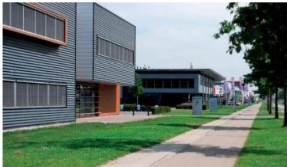
positie gebouwen, groene voorzone met bedrijfsbebording in een lijn

Het gebruik van reclamemasten/-zuilen is niet toegestaan. Bij de inritten vanaf de openbare weg is de vermelding van de bedrijfsnaam toegestaan. Deze is geplaatst op vaste aangegeven locaties, loodrecht op de weg. Samen met de bebording op de andere kavels vormen de borden één rechte lijn. Hierdoor ontstaat een rustig en overzichtelijk beeld. Het toe te passen bord is gelijk aan het standaardbord dat afgestemd is met de gemeente. Het is smal (ca 0.8 meter) en laag (max. 1.8 m). De borden hebben allemaal een gelijke kleur (grijs met blauwe bovenrand). Op het bord staat bovenaan het adres en daaronder het bedrijfslogo. Voorbeelden zijn hiernaast afgebeeld. Er zijn verder geen losse reclame borden op de terreinen geplaatst. In aansluiting op deze uniforme bebording per kavel wordt centraal bij de entree van Wolfsveld 2 een overzichtsbord geplaatst dat inzicht geeft in de situering van de verschillende bedrijven in Wolfsveld. De uitstraling van dit bord sluit aan bij de lage bebording. Daarnaast worden de straatnamen en bedrijven aangegeven met de al in Wolfsveld toegepaste lage blauwe borden, aan het begin van de straten. De bebording wordt beheerd door het parkmanagement.