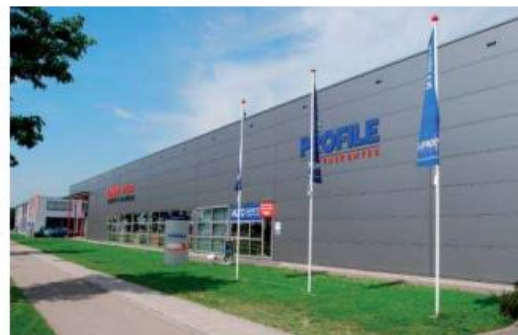
bedrijfsnaam op de gevel, bord en vlaggenmasten