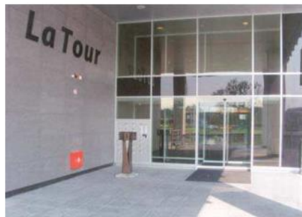
duidelijk herkenbare entree