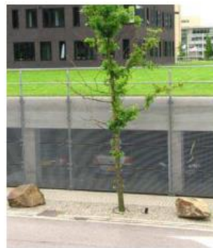
meervoudig ruimtegebruik mogelijk