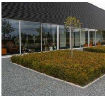
voorzone groen ingericht

indien mogelijk is het gewenst dubbel grondgebruik toe te passen, bijvoorbeeld door het parkeren ondergronds of op het dak van het gebouw te realiseren. Op die manier wordt de ruimte intensiever gebruikt en is het mogelijk op begane grond/maaiveld een groter programma van pure bedrijfsactiviteiten te realiseren