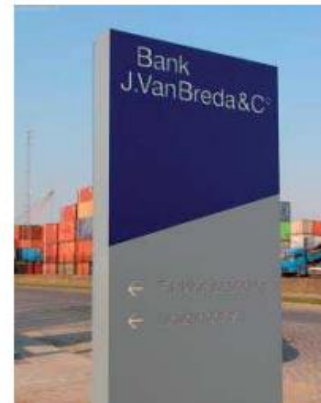
standaard bebording naast inrit kavel, grijs laag en smal, blauwe bovenrand is qua kleur gelijk aan blauw van laag straatnaambord