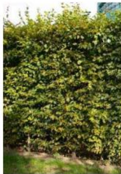
natuurlijke afscheiding of esthetische uitwerking van hoogwaardige materialen