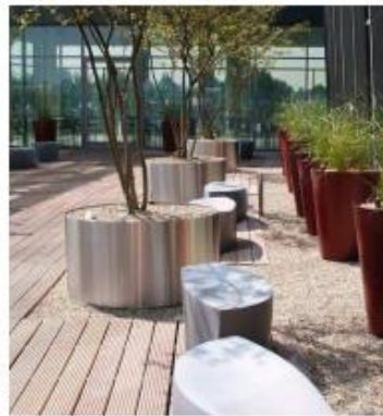
zorgvuldig ingericht eigen terrein