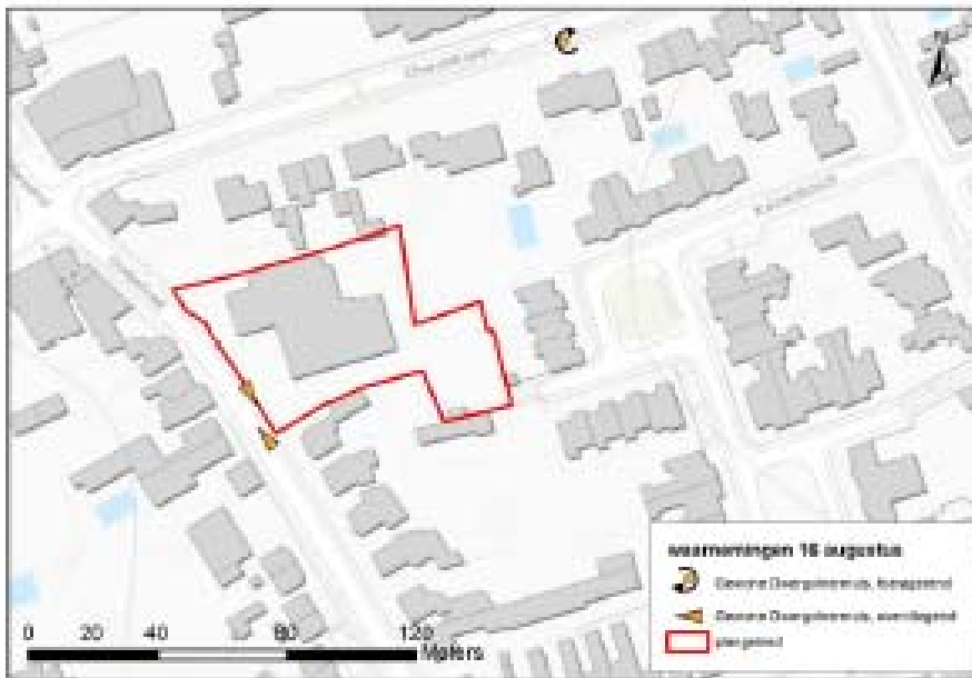
Figuur 2. Waarnemingen 10 augustus 2016