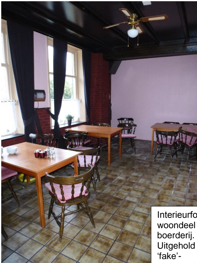
Interieurfoto's woondeel boerderij. Uitgehold en 'fake'- constructie.