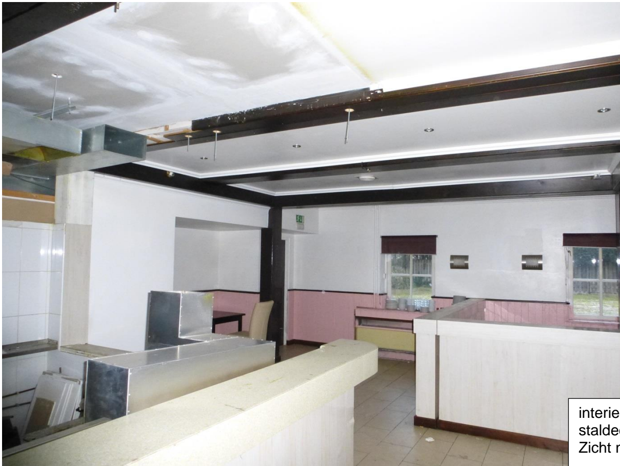
interieur keuken staldeel boerderij. Zicht naar achteren.