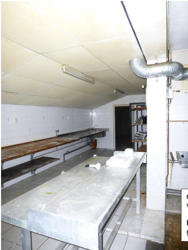
muizentand ter hoogte van de bakgoot voorgevel Keuken in aanbouw lange gevel noord.