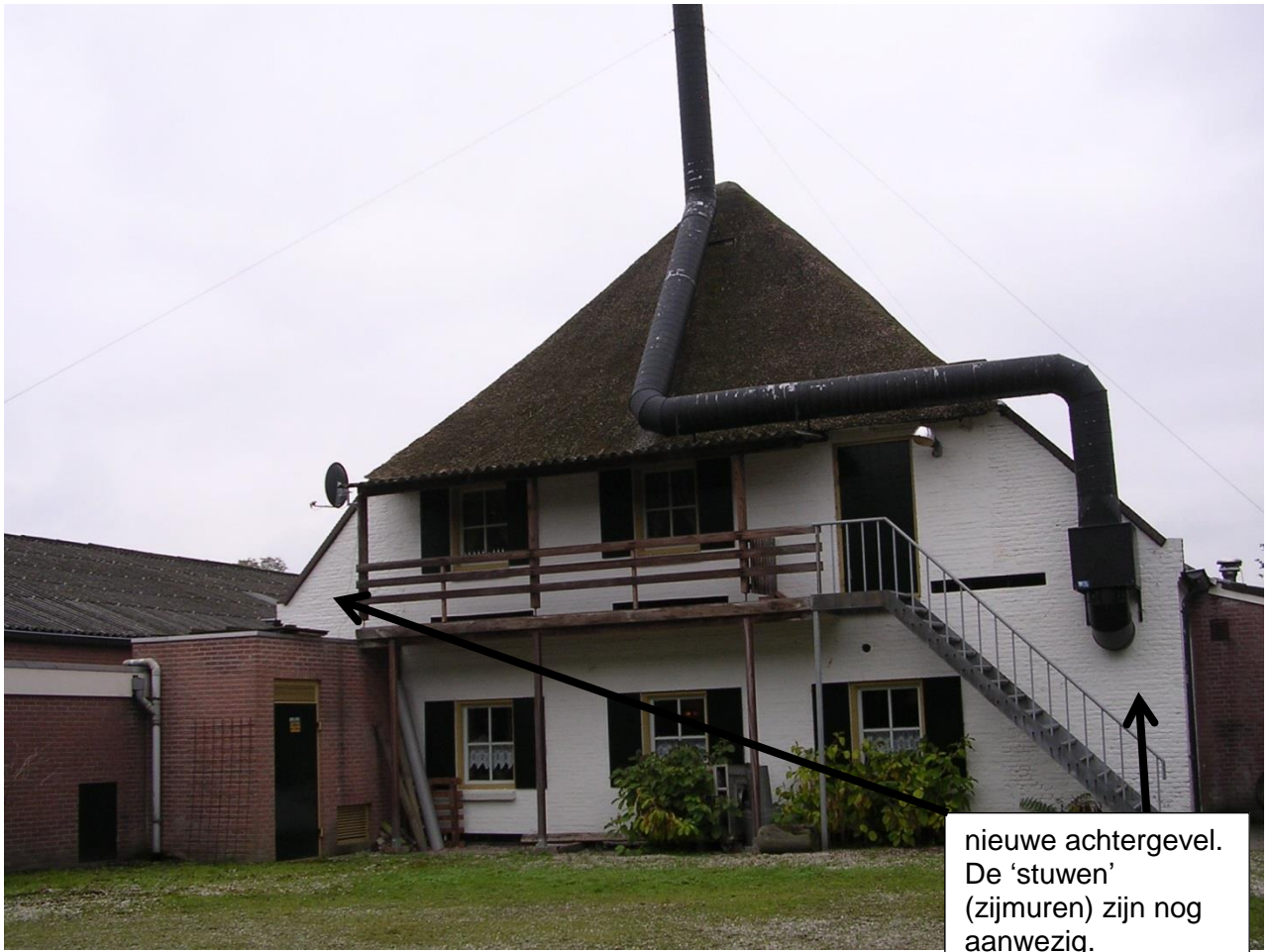
nieuwe achtergevel. De 'stuwen' (zijmuren) zijn nog aanwezig.