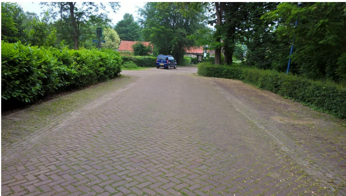
Schoorswinkel met links de strook in waalformaat, halfsteens en de rijbaan in keperverband (dikformaat).