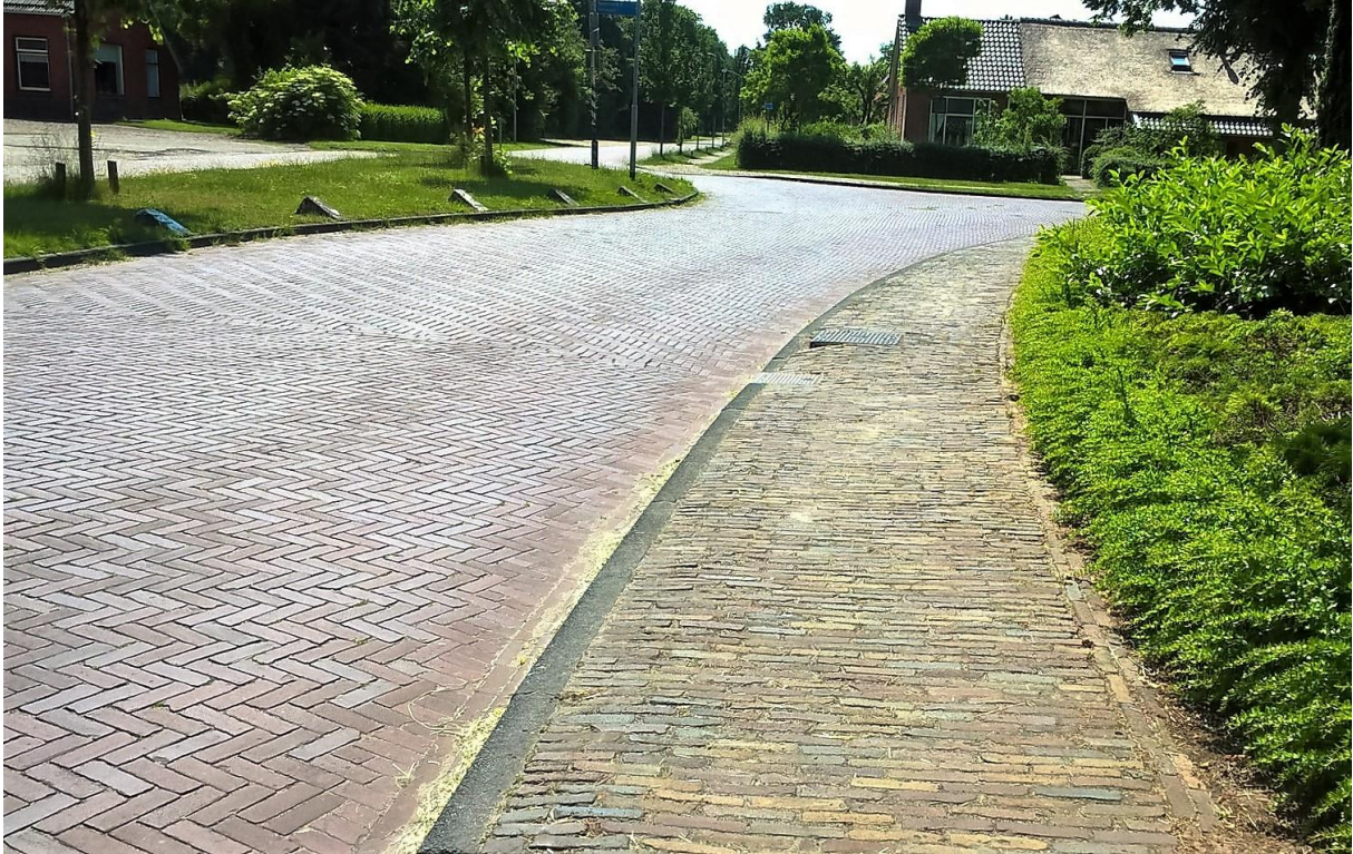
Foto: soort bestratingsmateriaal rijbaan en sierstrook in ervendeel (Deel 1)