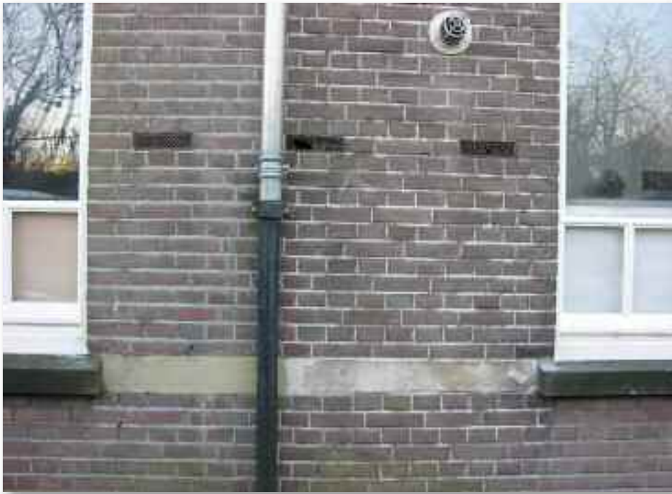
51. Daarbij zijn de materialen van minder allure dan bij de bouw uit 1914, zoals links en rechts van de regenpijp is te zien