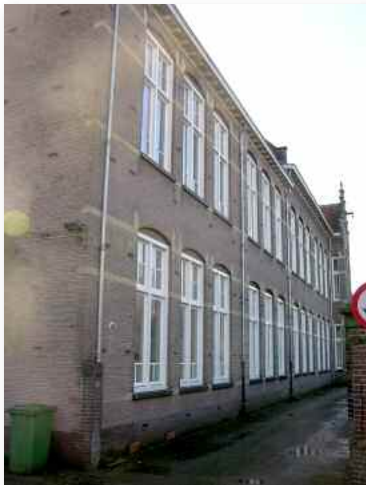
50. De verdere uitbreiding uit 1929, en 1931, wat de verdieping betreft