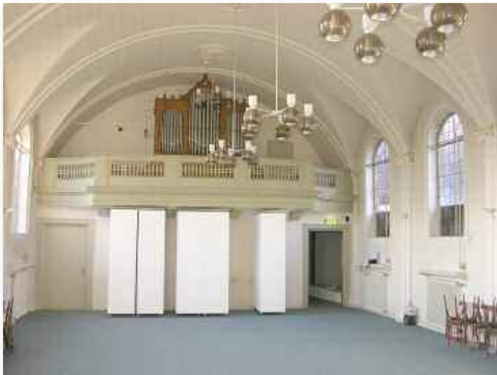
34. Het oxaal van het orgel....