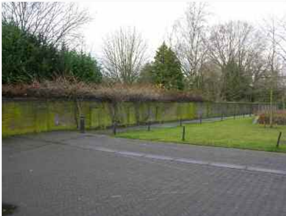
83. Dezelfde muur aan de buitenkant.....