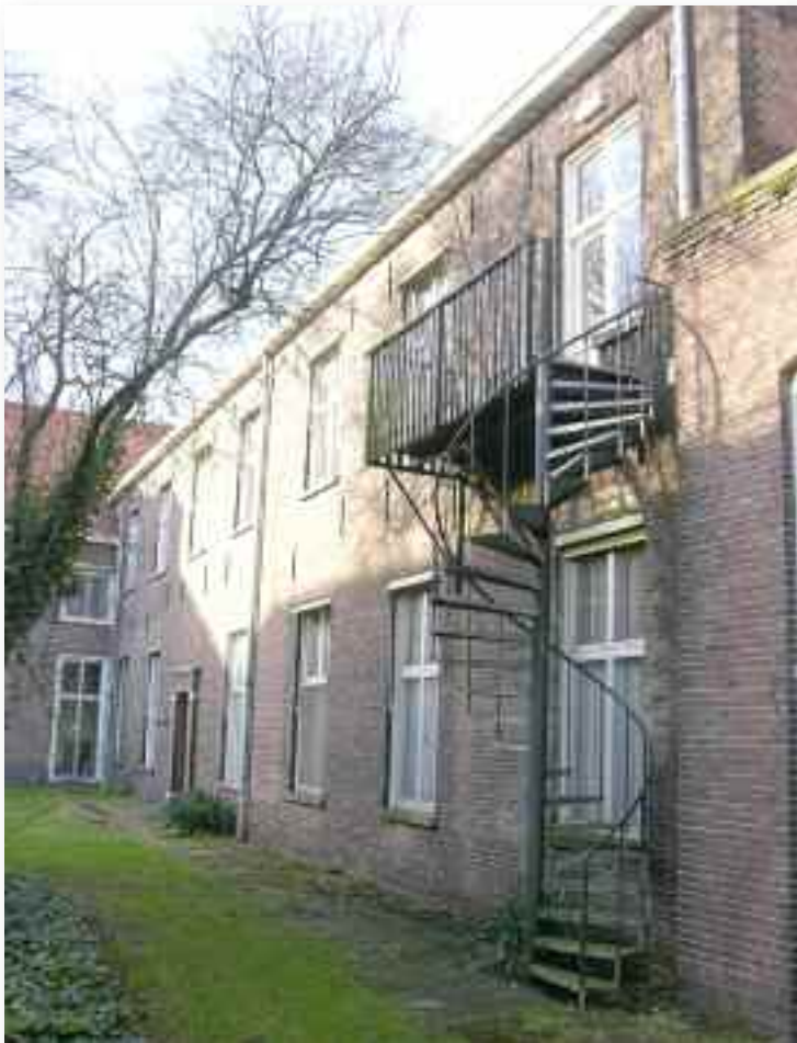
45. De binnenplaatszijde van de school uit 1881. Omdat die direct uitkwam op de open ruimte bij het klooster werd er een inmiddels weer verdwenen muur gebouwd, haaks op de kloostervleugel