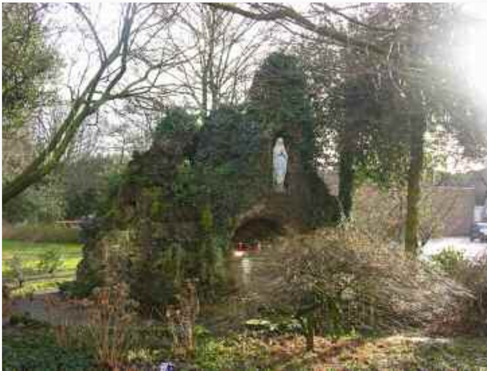
71. De Lourdesgrot is zeer klassiek maar ook buitengewoon door de omvang en de vormgeving. Bovendien is de nis waar kaarsen gebrand worden opnieuw functioneel, in directe relatie tot Poolse bewoners van een deel van het complex