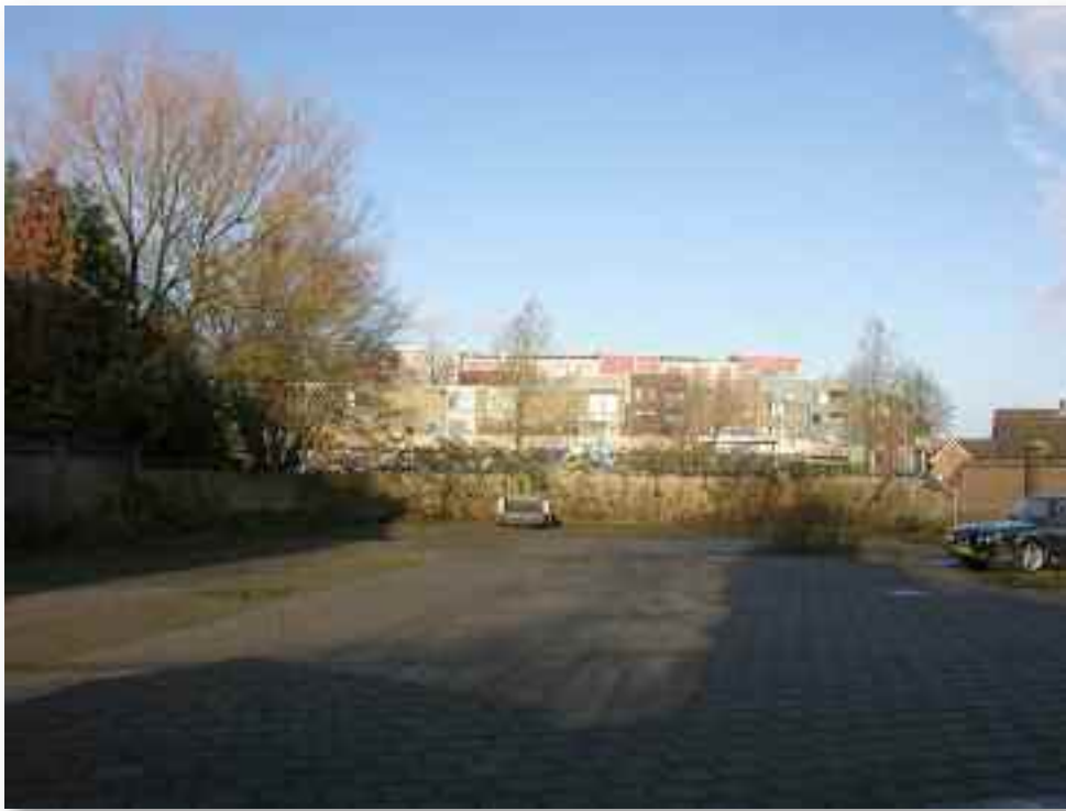
57. ....maar is aan de noordkant gesloopt