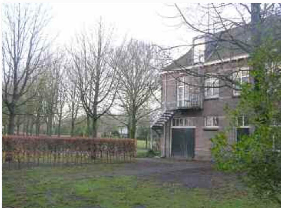
76. Een blik in de tuin langs het washuis.....