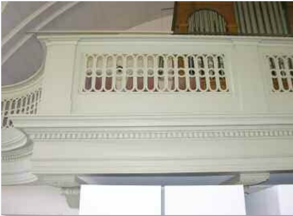
35. ....met zijn detaillering.....