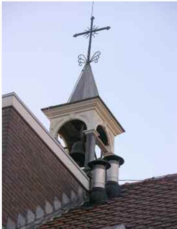
24. De luidklok van het klooster, en dus met name voor het aankondigen van de diensten in de kapel staat op de nok van het klooster. Daar is de bekroning een gangbaar kruis