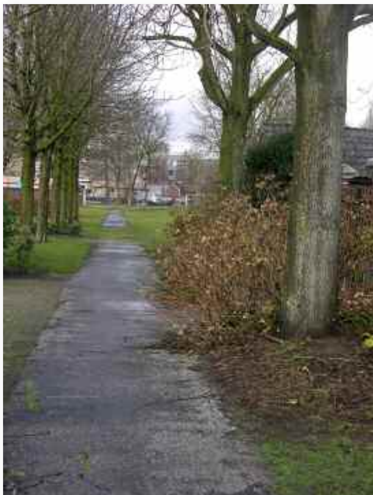
85. Terug in de tuin met zicht voor het kerkhof langs richting de bebouwing aan de Kapelaanstraat, met o.m. het parkeerterrein van de winkels daar. De muur die de tuin afsloot is deels gesloopt, waardoor het vrije doorzicht is ontstaan en de beslotenheid van de tuin is doorbroken.