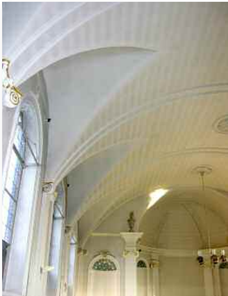
32. In de gewelven tekent zich de opbouw van het stucwerk af