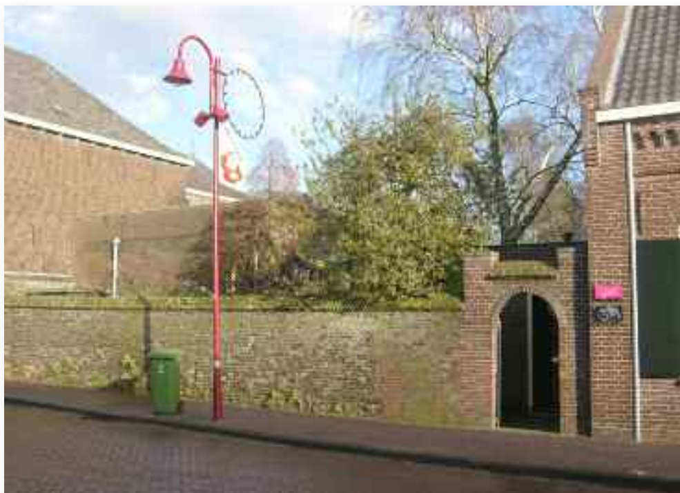
60. De tuinmuur is in 1901 ingekort en bij de boerderij voorzien van een poortje