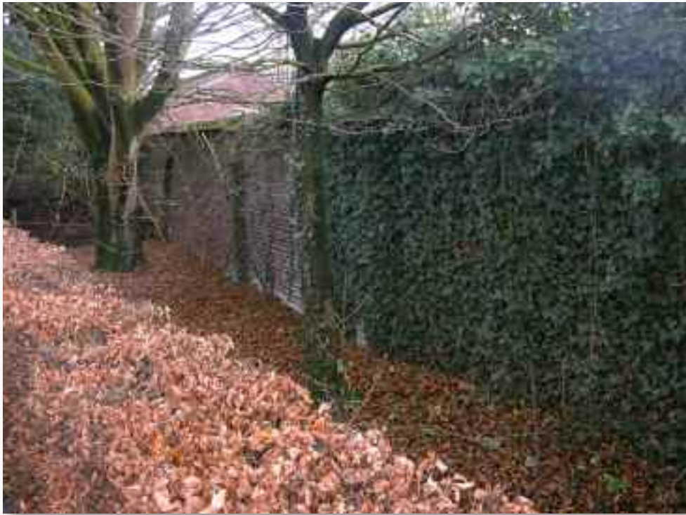
86. De oudste muur aan de binnenkant