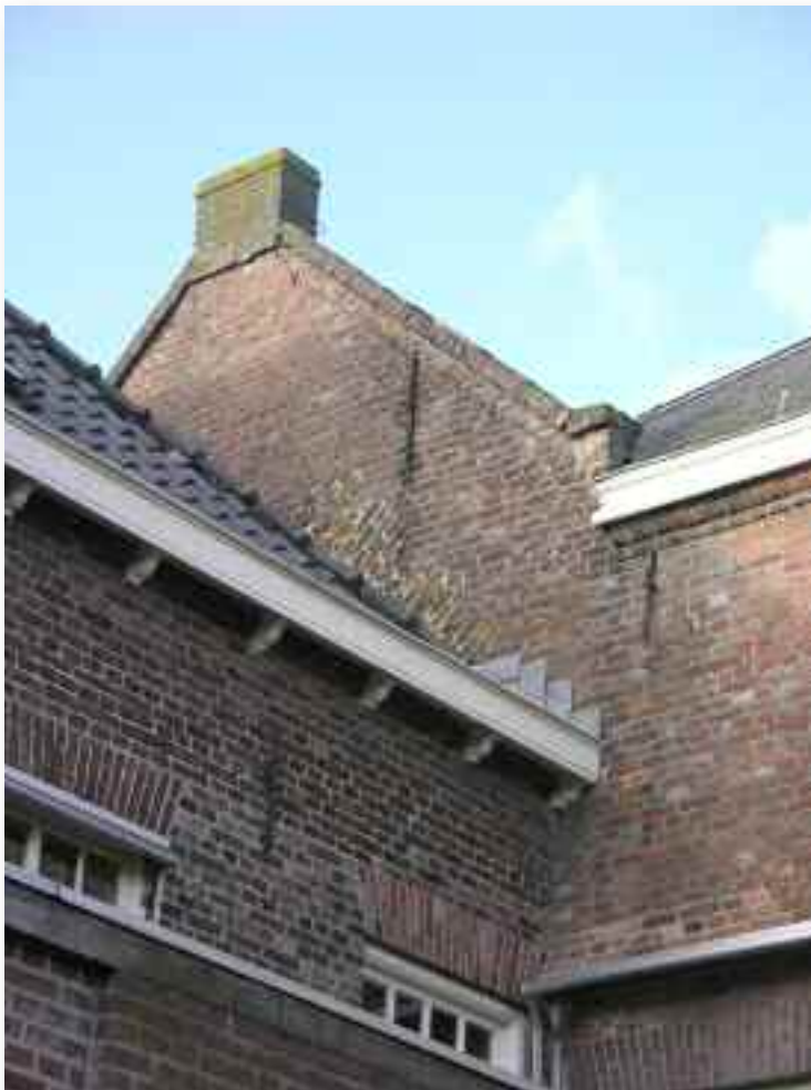
4. De zuidelijke topgevel van het klooster. De vlechting hoort bij de oorspronkelijk 17de eeuwse gevel. De rest is de ophoging van 1848. De rectorwoning staat er tegenaan gebouwd. Rechts de verbindingsmuur met de kapel