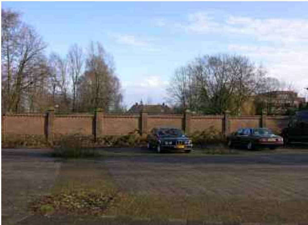
56. De muur is met oog voor detail opgetrokken.....