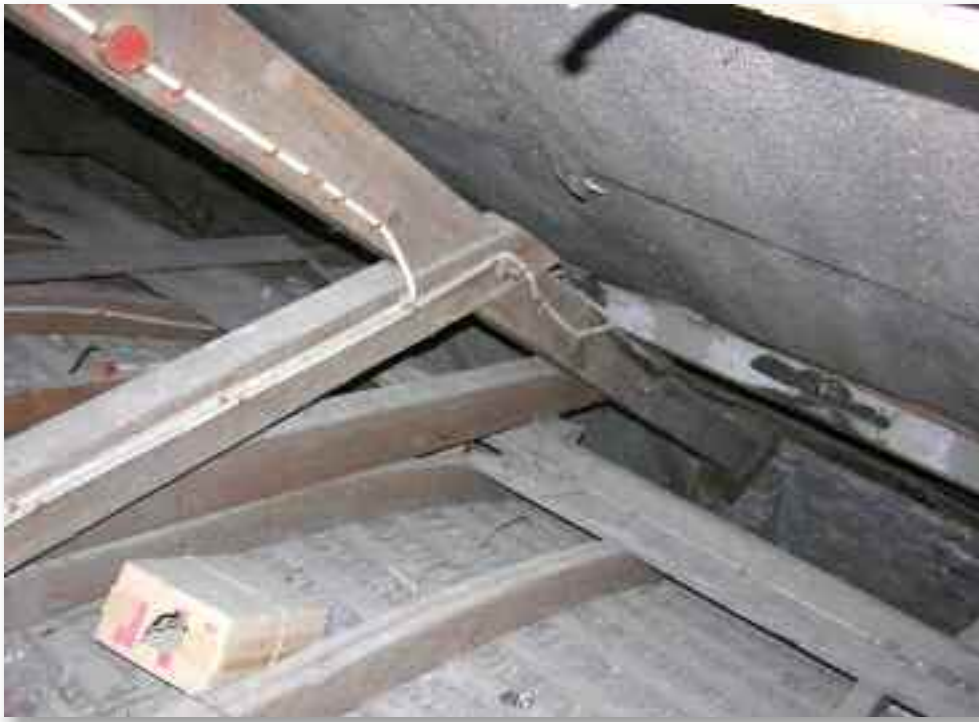
39. De kapconstructie van de kapel bestaat uit industrieel verwerkt naaldhout. In de diepte, bij de aansluiting op de muur, is de afgezaagde moerbalk te zien ten gevolge van de plaatsing van het orgel