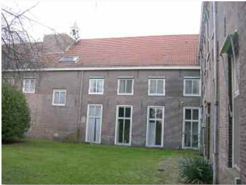
16. De eveneens sterk gewijzigde achtergevel van de uitbreiding uit 1851