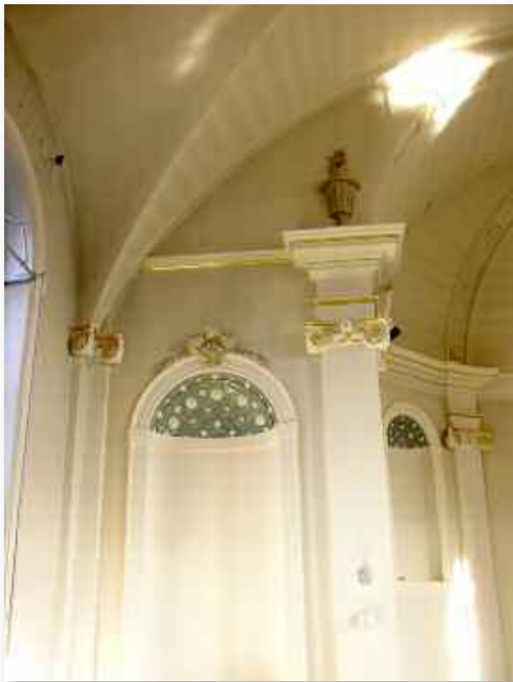
30. Een sfeerbeeld dat de kwaliteit van de ruimte onderstreept