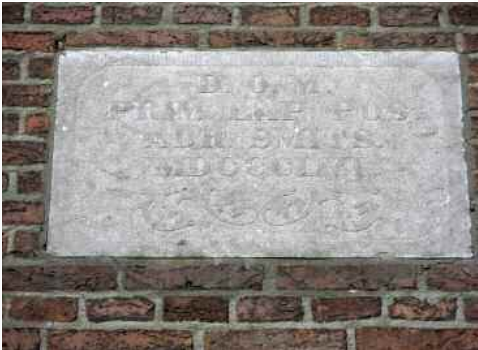
27. In de zuidgevel is de bouw van de kapel geboekstaafd in een jaartalsteen