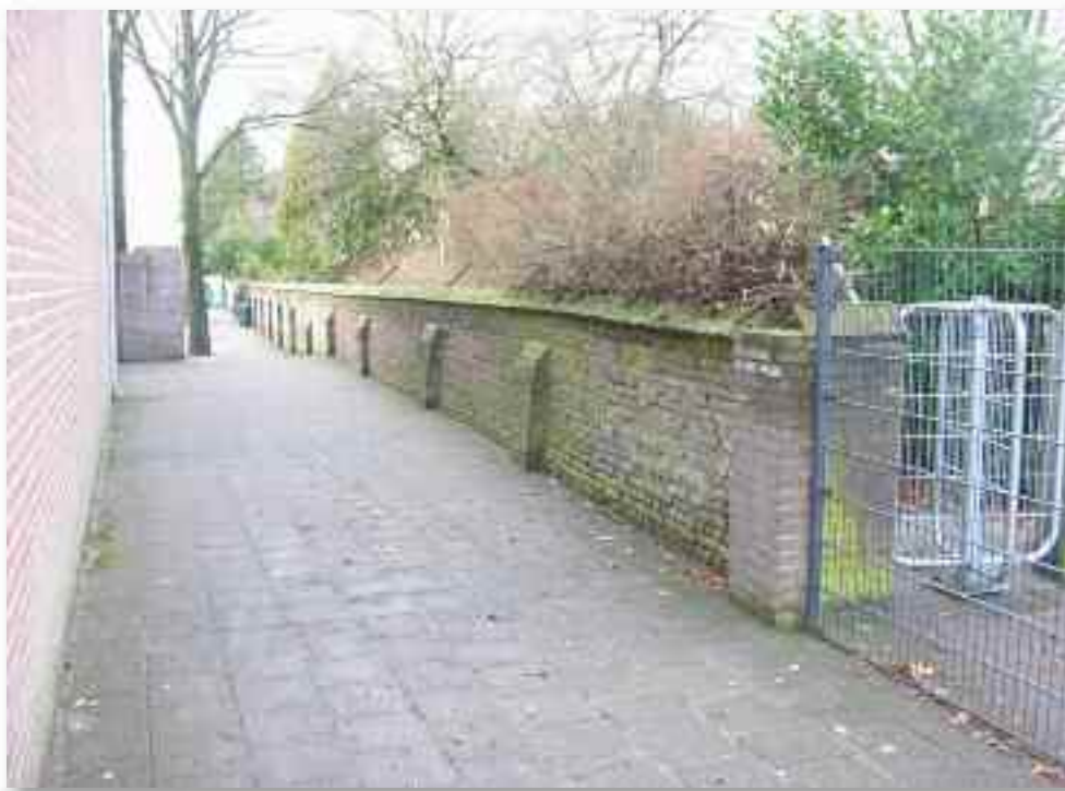
84. ....en langs de speelplaats van de lagere school. Dit deel van de muur is het oudste bewaarde stuk. Rechts is een ingang voor wandelaars gemaakt