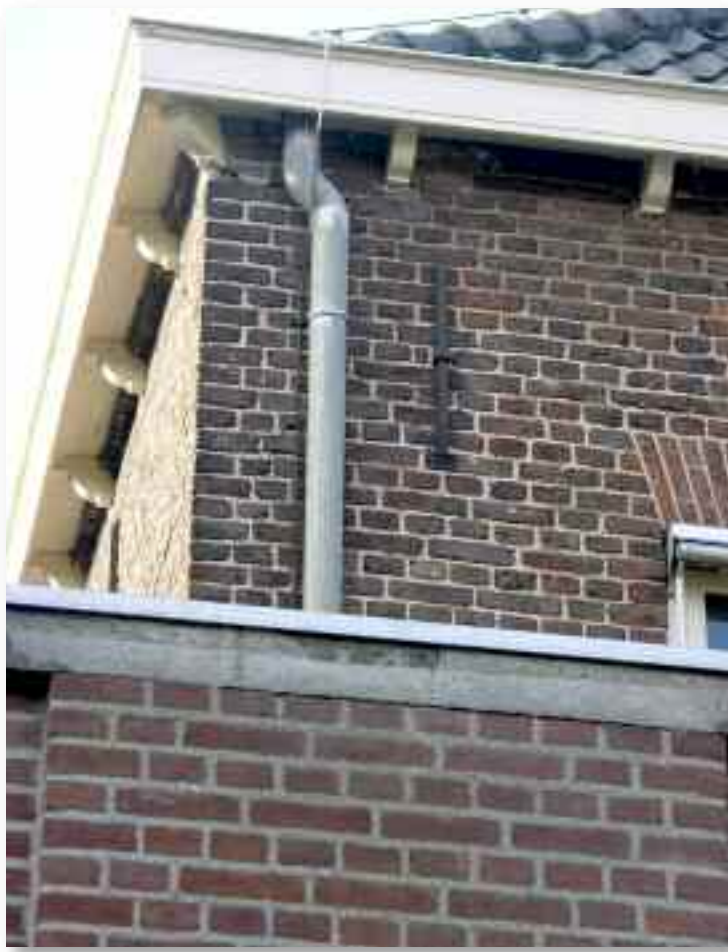
61. De rechterachterhoek van het pand schetst een beeld van ouder metselwerk door de handvormsteen