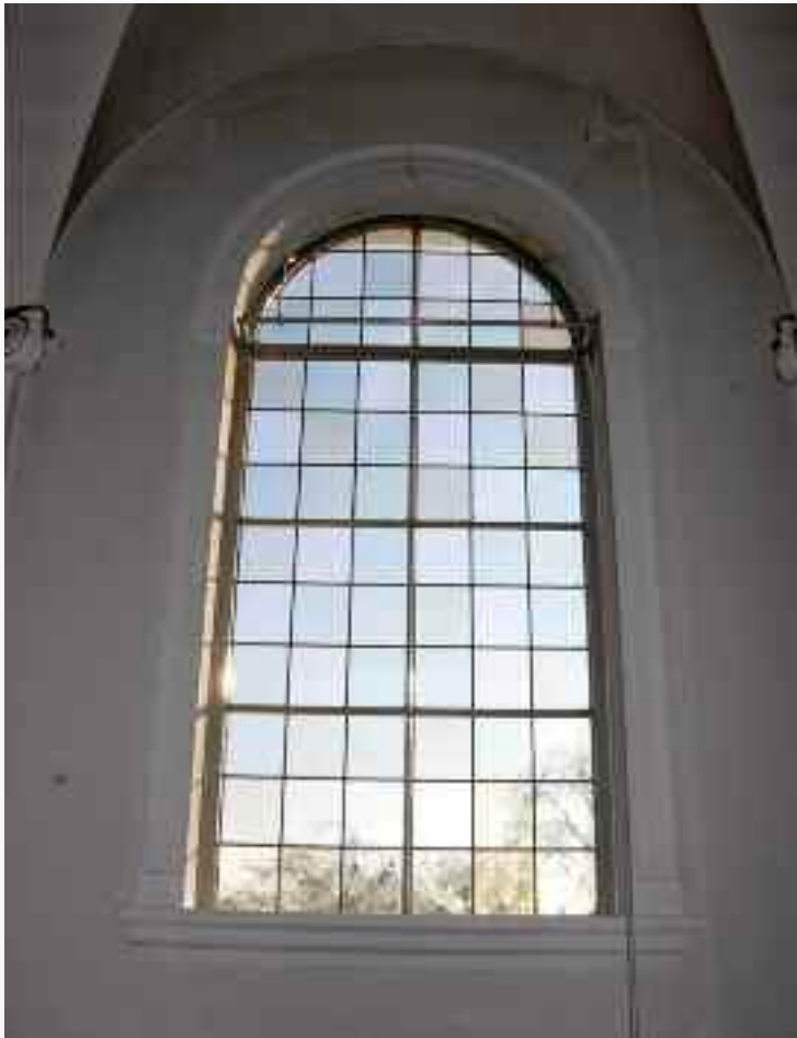
33. De ramen zijn strak en functioneel