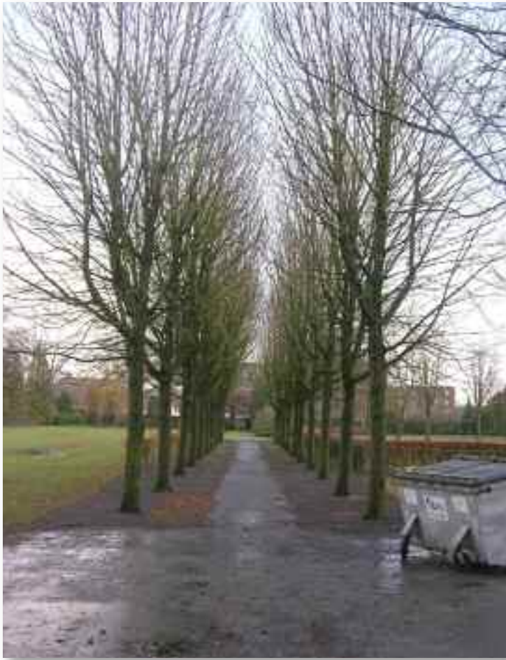
90. ....en tot slot nog een beeld van de kastanjelaan