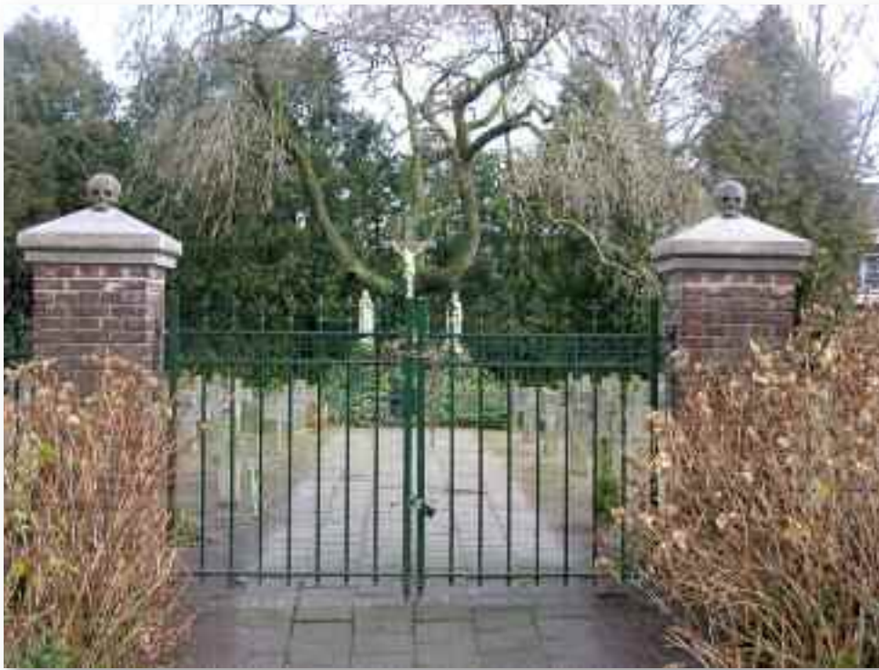
66. Het klassieke beeld van het kerkhof