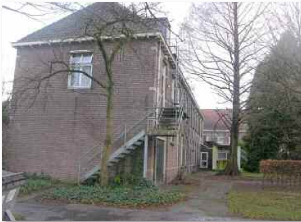
64. Het gebouw richting klooster gezien.....