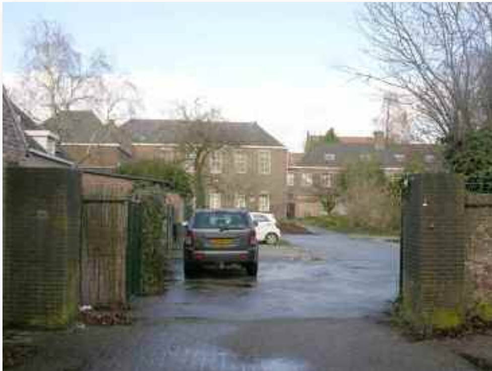
75. De buitenentree naar de tuin, rechts van de voormalige boerderij, die links in beeld ligt. Centraal op de achtergrond de kapel

Verder heeft de tuin enkele vrij recente rustplekken met lage hagen en zitmogelijkheden, terwijl de feitelijke structuur bepaald wordt door een kastanjelaan die weliswaar nog vrij jong is maar wel bepalend. Hij markeert ook de route vanuit het klooster naar de voormalige extramurale huishoudschool.