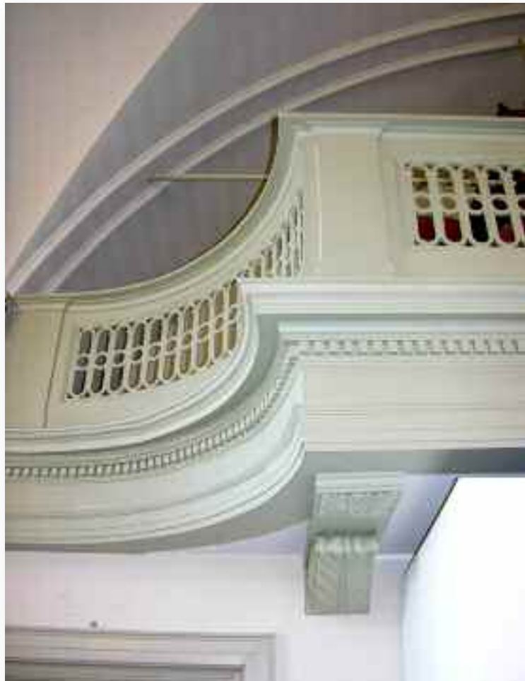
36. ....die zeer eclectisch is.....