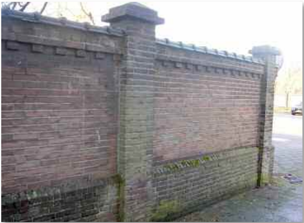
55. De speelplaats is afgescheiden van de tuin van het klooster, en ligt naast en achter de school