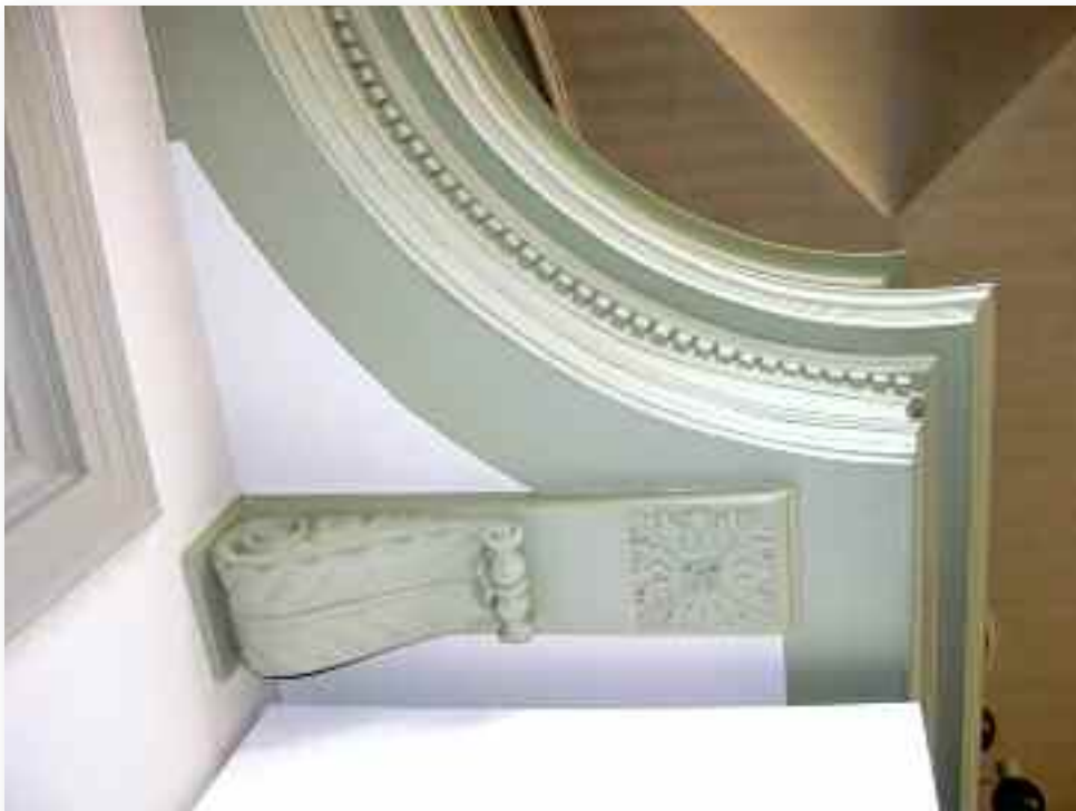
37. ....maar wel een zeer rijk beeld oplevert