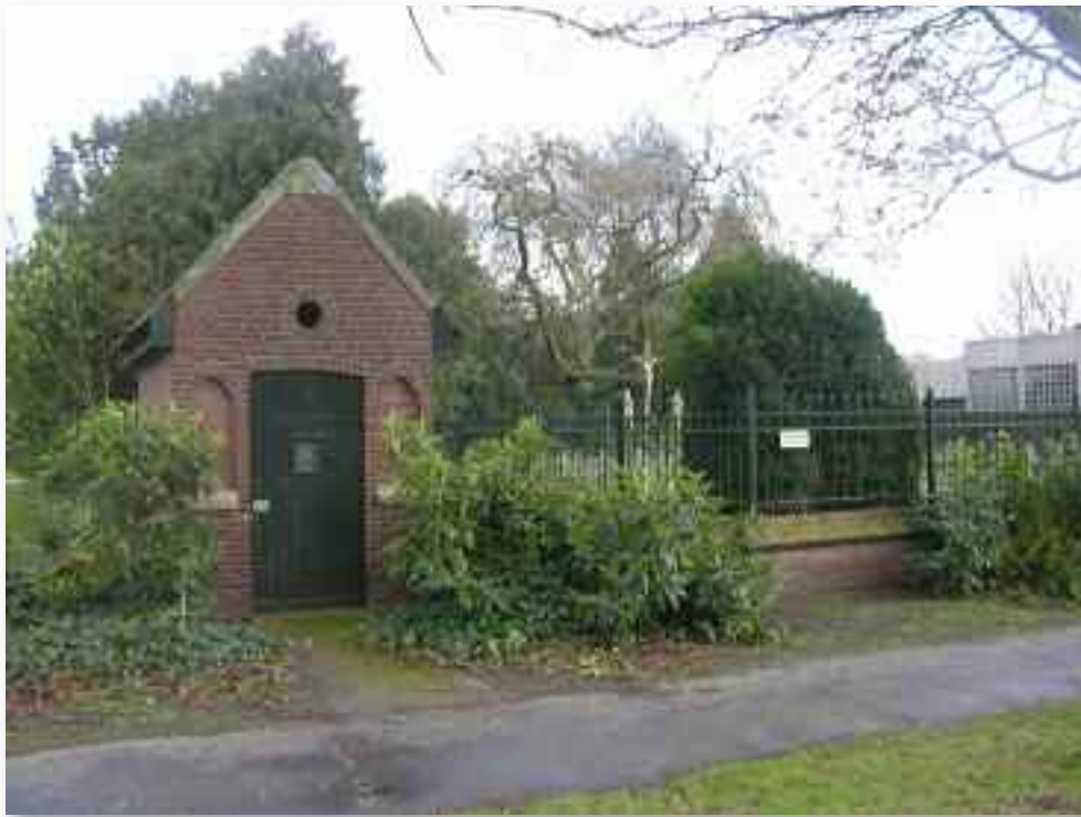
70. Het ijkenhuisje