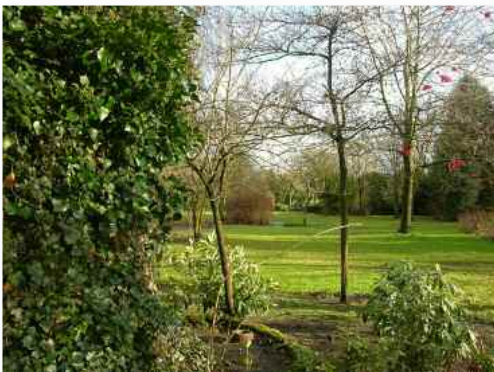
77. ....en langs de Lourdesgrot