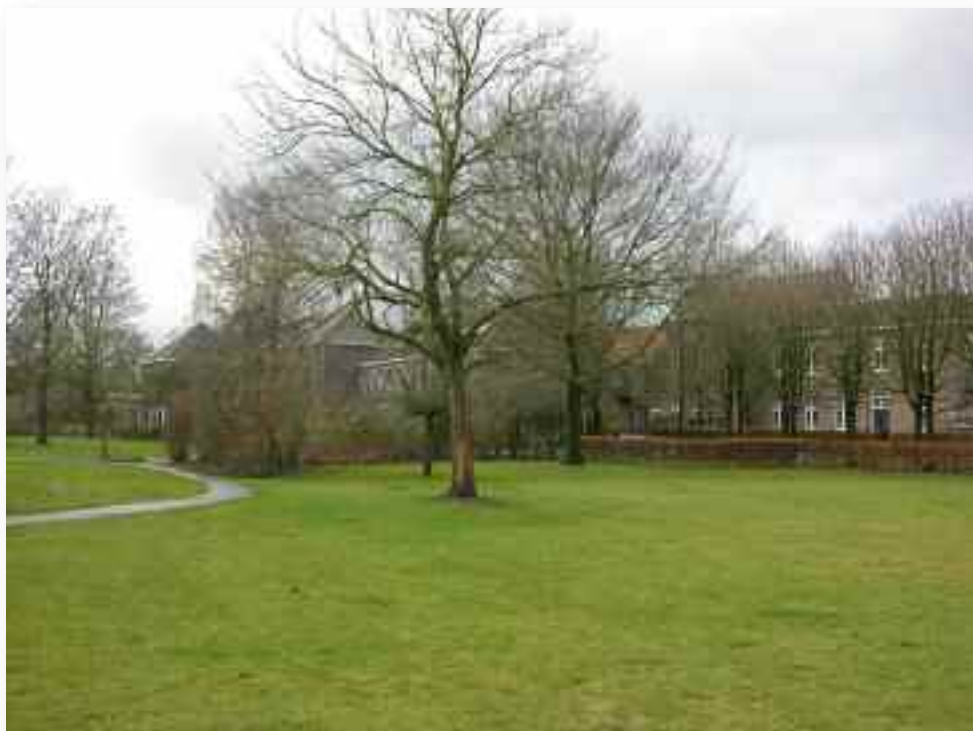
78. Van uit de tuin richting klooster blijkt de maat van de tuin.....