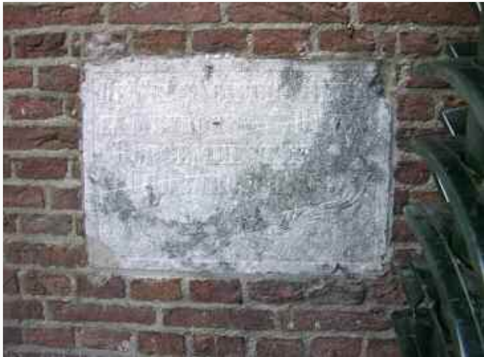
28. Een tweede steen, uit 1864, die verwijst naar een weldoener, zit nu in de kopse gevel van de kapel, maar is herplaatst