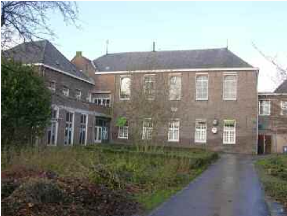
21. De kapel, die op de eerste verdieping ligt, van uit het zuiden gezien