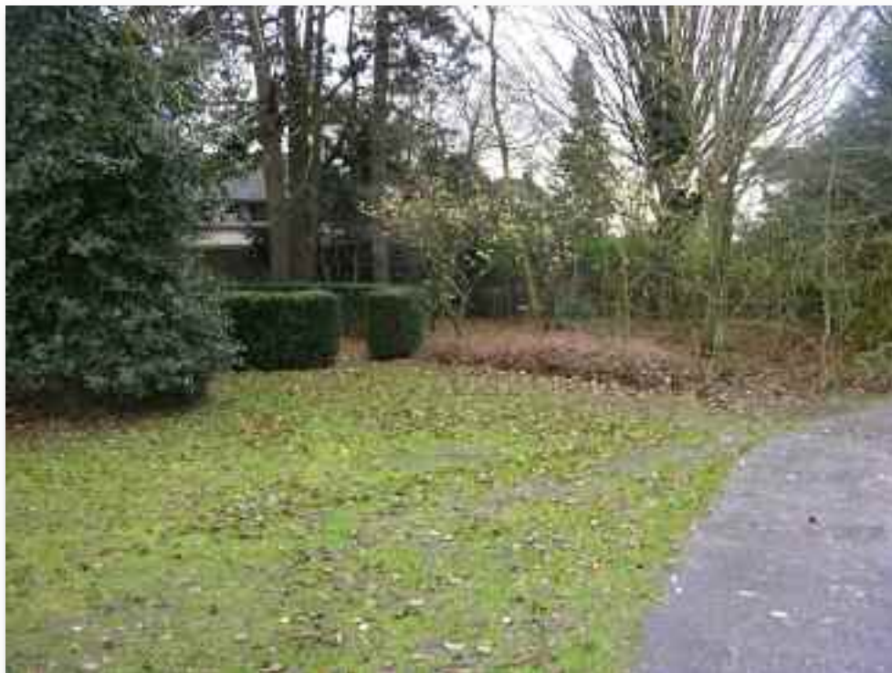
87. Een van de omsloten plekjes langs de muur.....