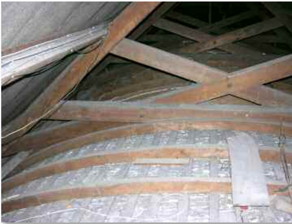
41. De grote kruislings aangebrachte balken zorgen voor de stabiliteit