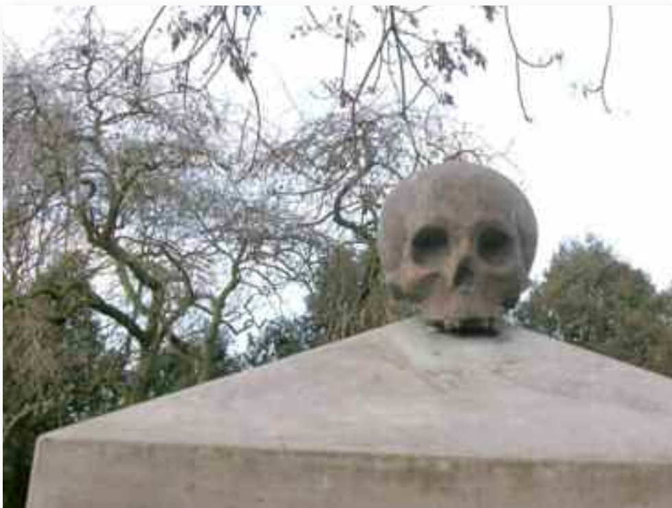
67. De pilasters zijn voorzien van doodsoppen als ultieme memoriestukken