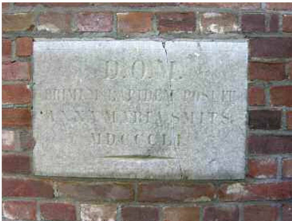
63. In de gevel is een jaartalsteen herplaatst uit 1851 die daarmee veel ouder is dan het gebouw, dat in 1908 gebouwd is. Waar de steen oorspronkelijk zat is niet bekend