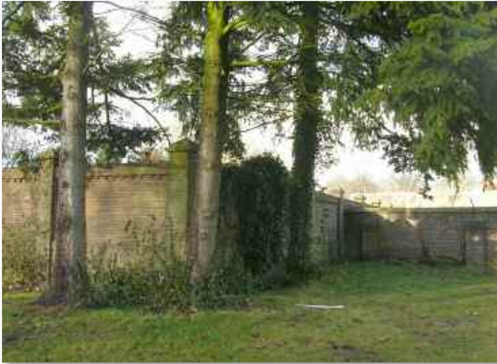
80. De plaatsing van de speeltuinmuur, haaks op de oude ommuring van de kloostertuin, laat goed zien dat deze plek secundair is afgescheiden van een groter geheel. De muur die naar rechts loopt is deels gesloopt