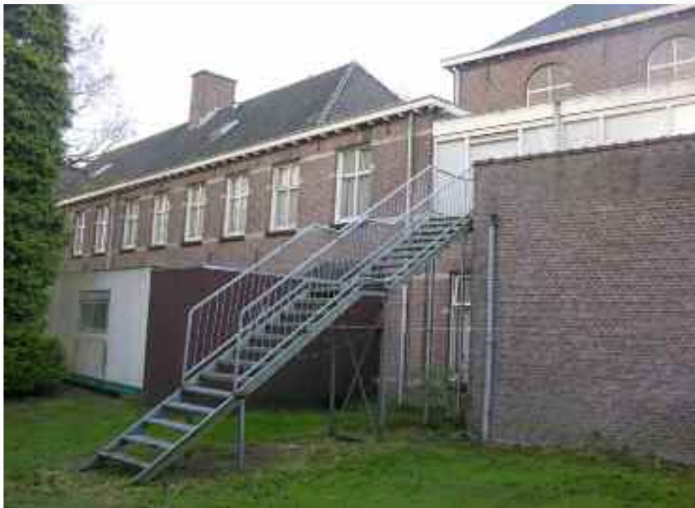
65. ....en van uit de tuin waar de aansluiting op de kapel is te zien, en het beeld verstoord wordt door de plaatsing van noodlokalen