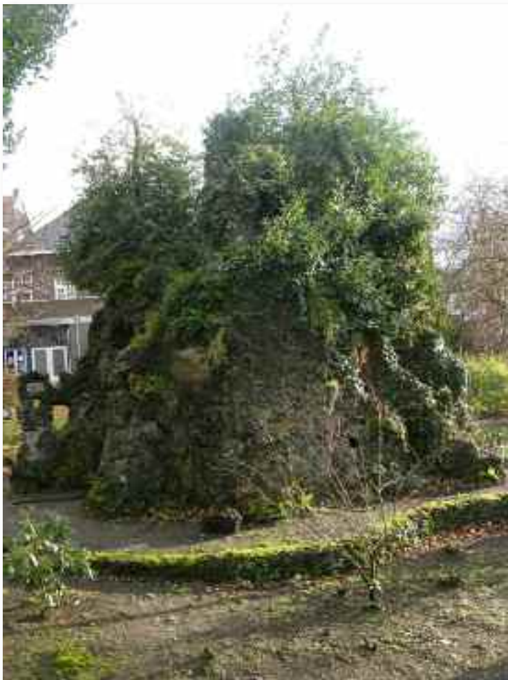
72. De achterzijde met her en der openingen die het binnenste achter de beeldnis van licht voorzien