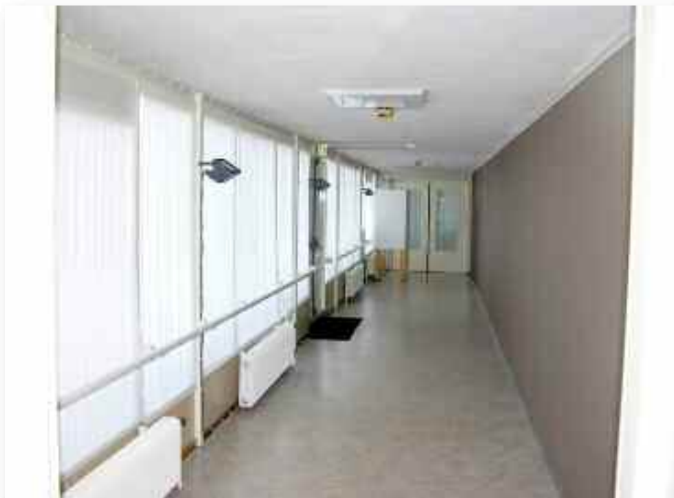
44. De gang aan de noordkant maakt de oorspronkelijke buitenmuur van de kapel onzichtbaar