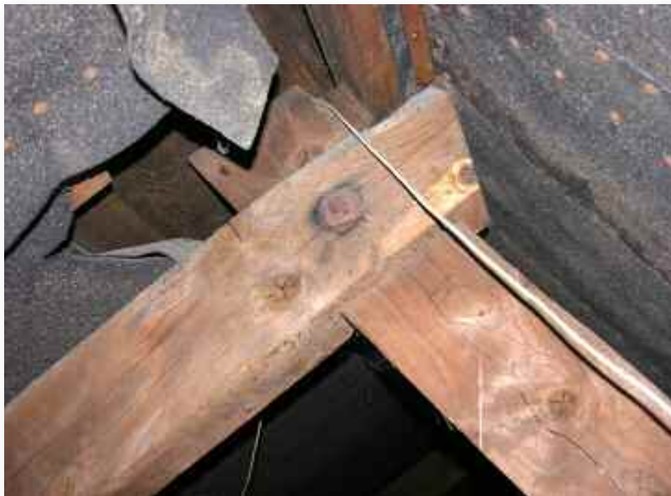
43. Ook daar weer bouten ter bevestiging