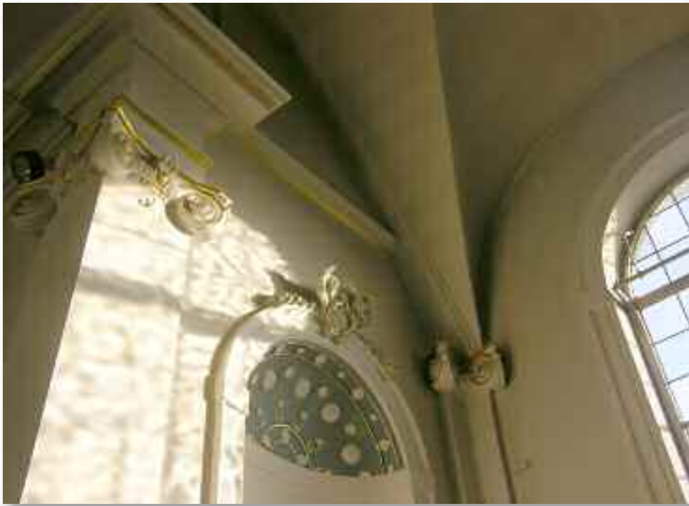
31. Doordat de ramen slechts bestaan uit getint glas, en niet uit gebrandschilderd glas, wordt het licht gefilterd en houdt het gebouw zijn lichte karakter