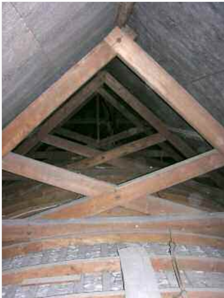
42. De nok wordt gevormd door in schaarspanten verwerkte jukbenen