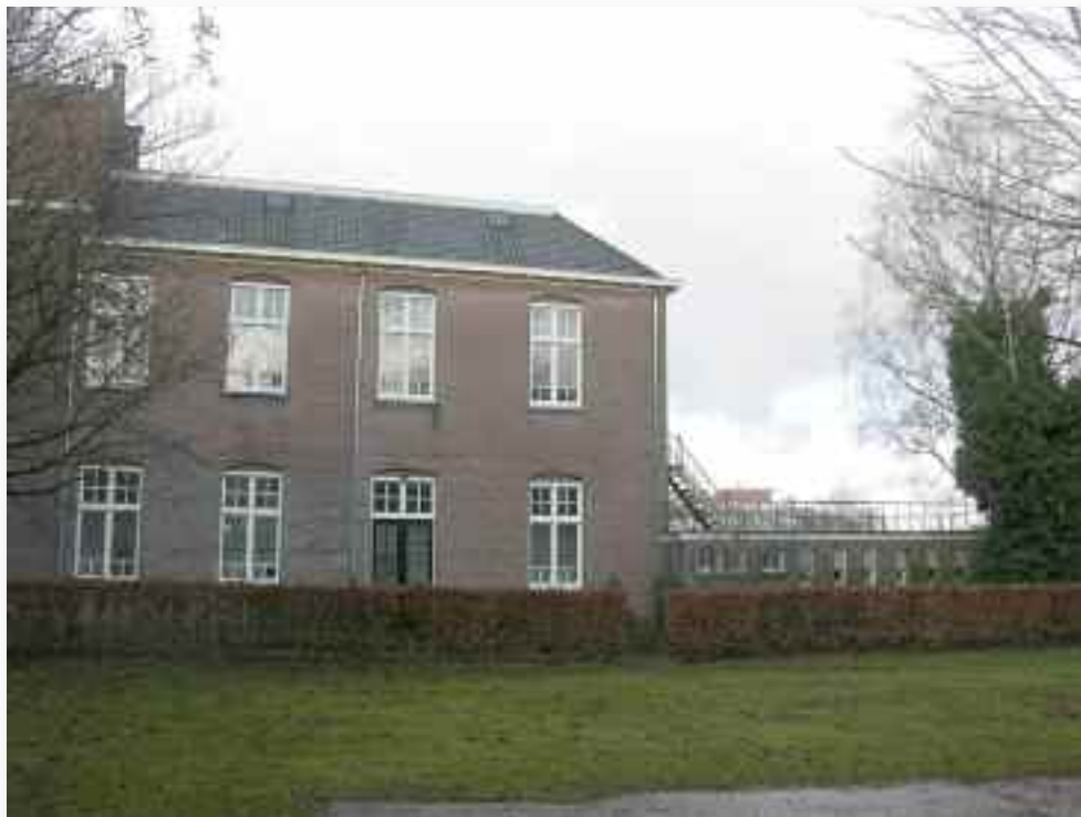
54. De tuinkant van deze vleugel