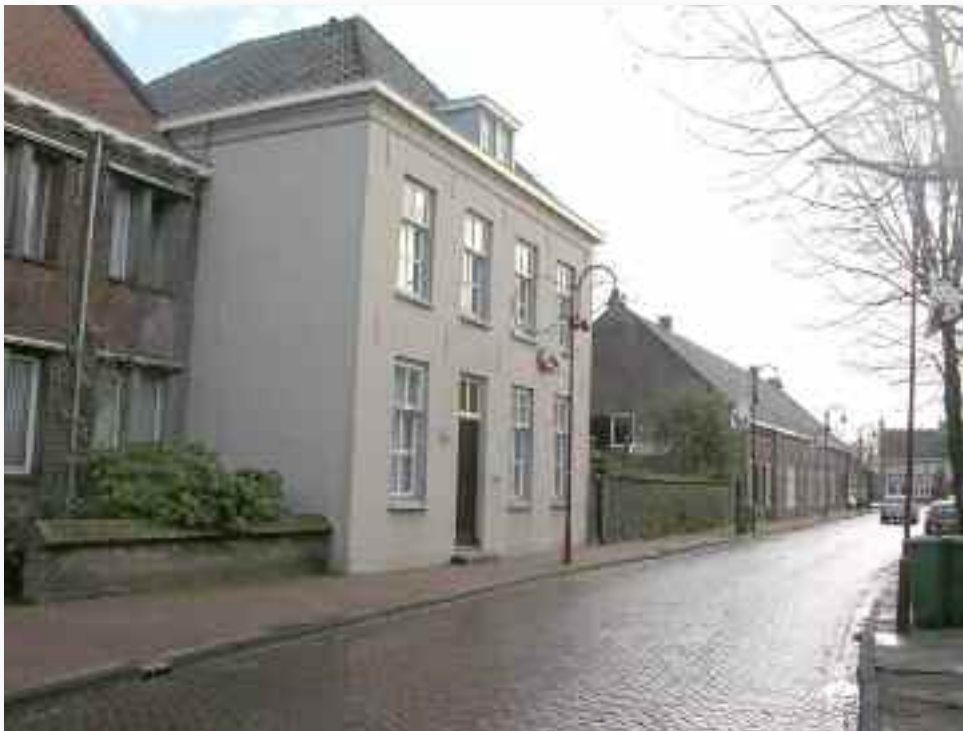
58. De mede door de plaatsing in de straatwand licht archaisch aandoende rectorswoning uit 1881

Een interessant stedenbouwkundig gegeven dat op oude(re) foto's is te zien is de muur die links van de rectorswoning het voorterrein van het klooster afscheidde van de straat. Dat moet in functie van het slotklooster gezien worden. Omdat die muur betrekkelijk laag was stond er tussen de muur en de straat een rij lindes, ook voor de rectorswoning. Daarmee werd extra afzondering bewerkstelligd.