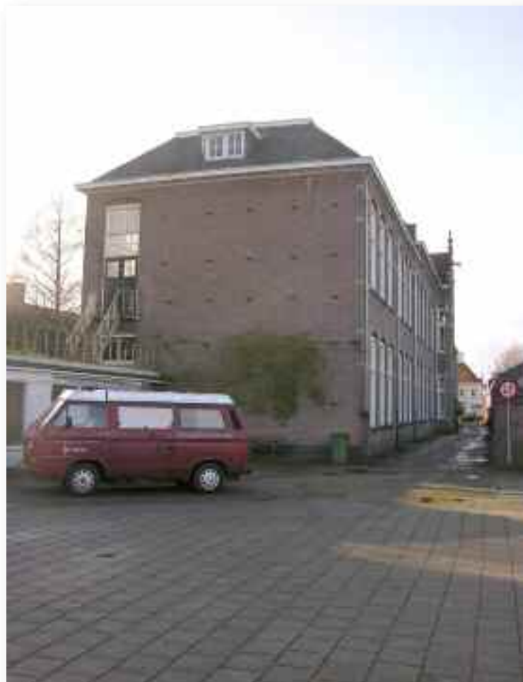
52. De achterzijde.....