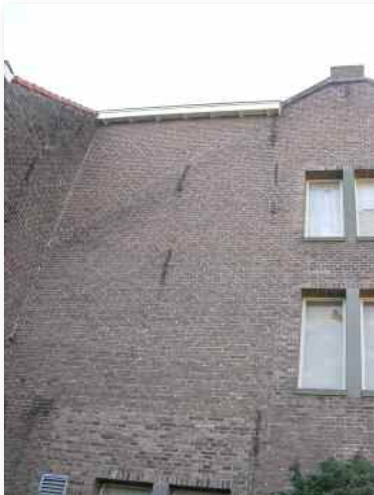
17. De noordgevel laat behalve ettelijke gewijzigde vensters ook de ophoging van de oorspronkelijke gevel zien t.g.v. de bouw van de aanpalende school in 1881