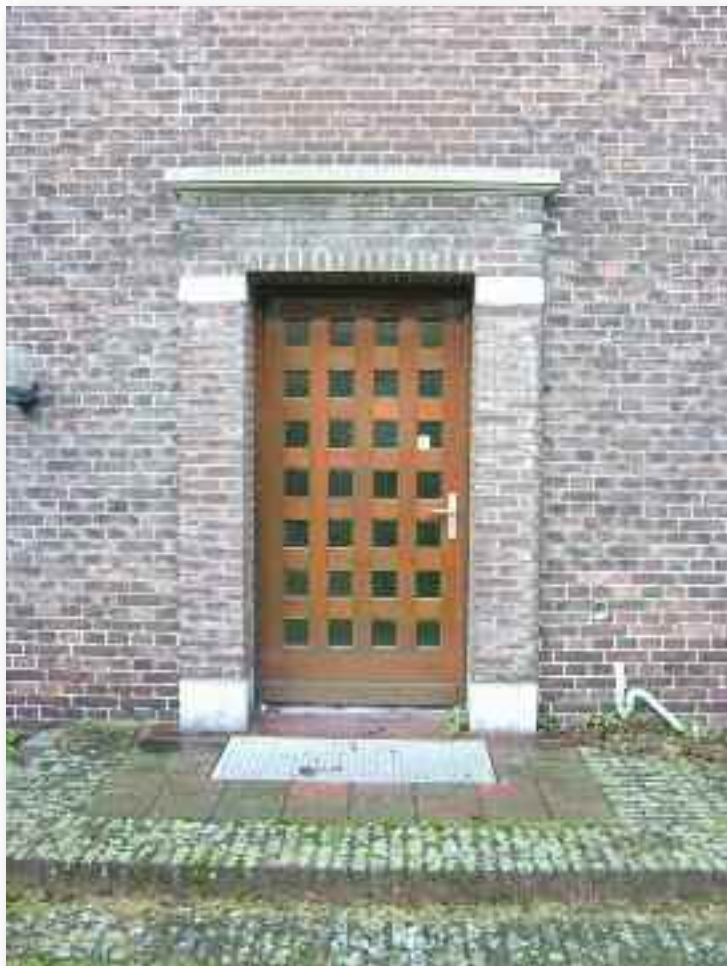
46. De deur naar de speelplaats is secundair, zoals blijkt uit het gewijzigde metselwerk boven de opening, maar ook uit de vormgeving van de omlijsting, die rond 1950 is gerealiseerd. De omlijsting komt exact overeen met de buitendeur in de achtergevel van het Borretgedeelte van het klooster