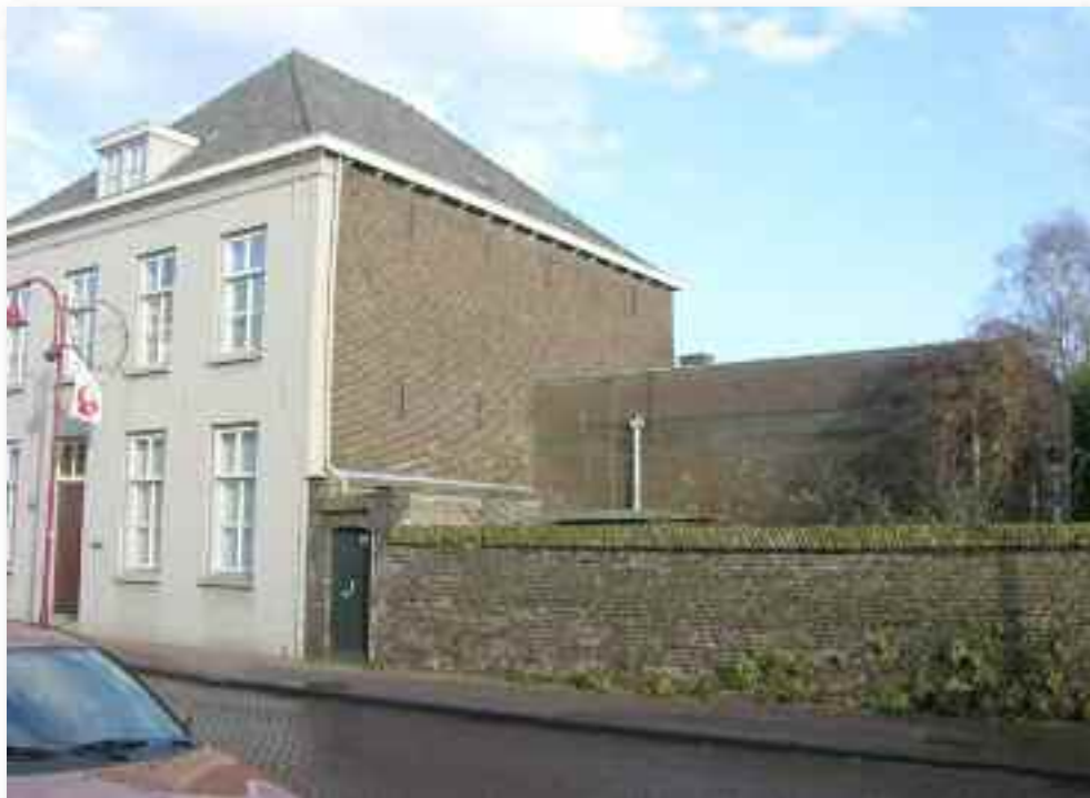
59. Ook de tuinmuur draagt bij aan dat beeld. Erachter is de moderne aanbouw te zien, maar ook de ongepleisterde zijgevel van de woning. Aan de kant van het klooster is die bepleistering er wel, vanwege de status en het aanzien van de gevel, en om aan te sluiten aan de eveneens gepleisterde voorgevel van het Borretgedeelte van het klooster