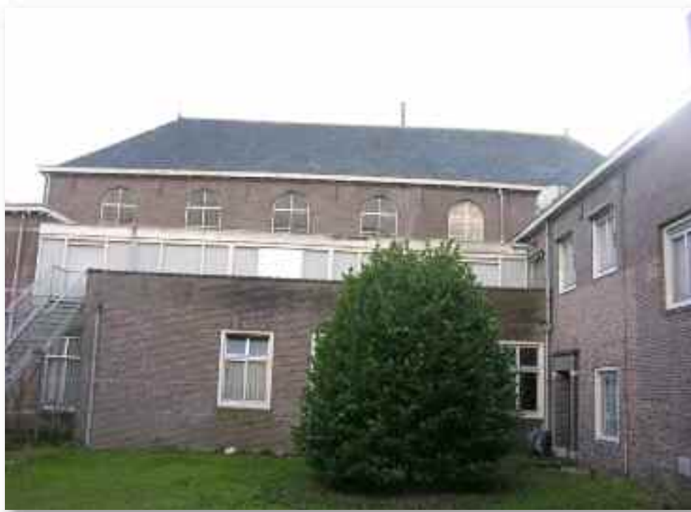
23. De noordgevel van de kapel met daarvoor de gang op de verdieping en een tweede lage aanbouw