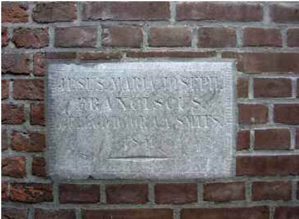
9. De herplaatste jaartalsteen die hoort bij de uitbreiding zit nu in de achtergevel van het oorspronkelijke Borrethuis