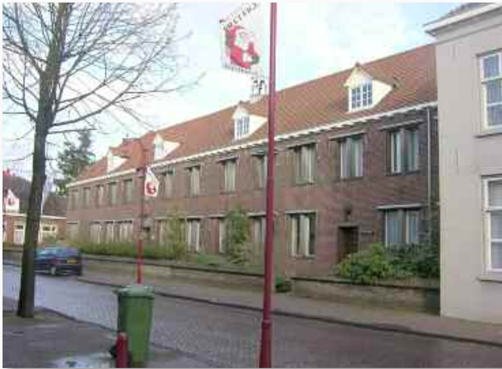
1. Straatbeeld van het klooster