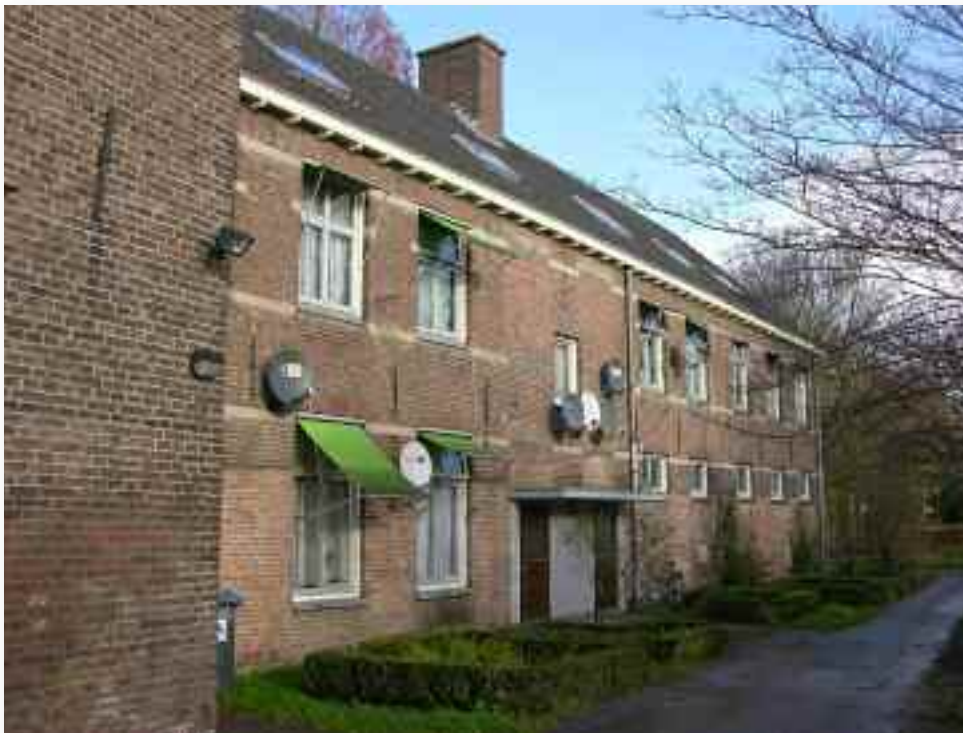
62. Het washuis annex -drogerij en bakkerij heeft tal van verbouwingen ondergaan, tot en met het plaatsen van een schilddak in 1975