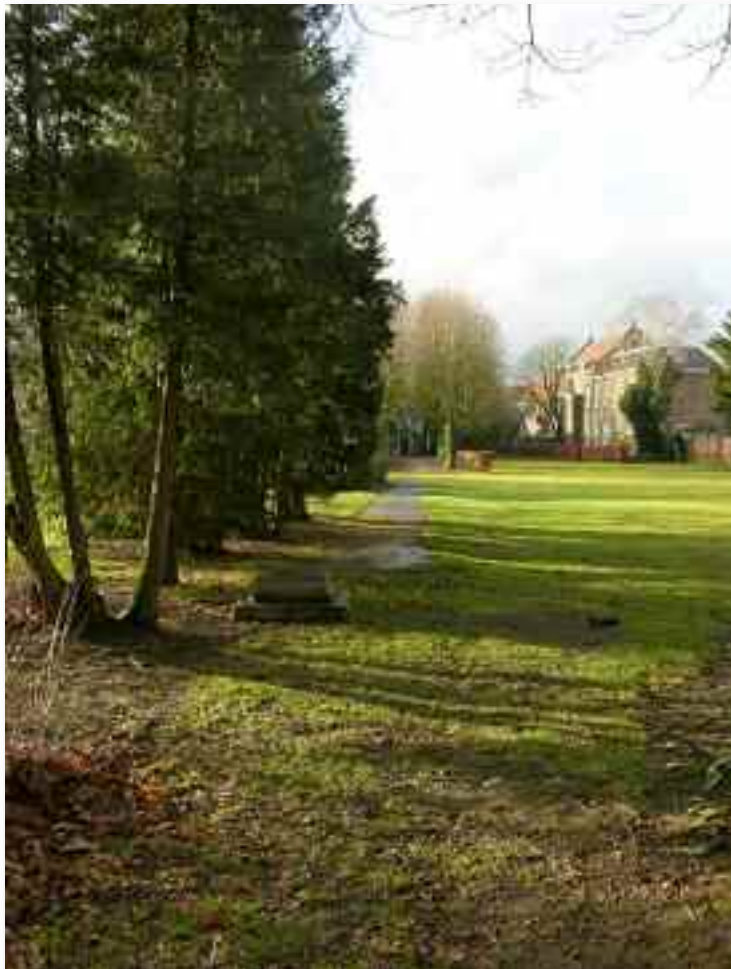
79. ....net als van bij de achtermuur. In het midden is de kastanjelaan te zien die haaks op het klooster loopt en de doorgangsweg markeert naar de vroegere uitgang aan de achterkant, richting huishoudschool