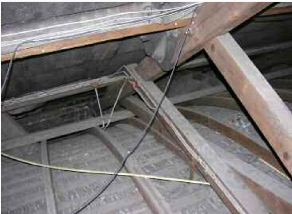
40. De kap is voor een groot deel opgebouwd door tegen elkaar gezette balken die met bouten zijn verbonden