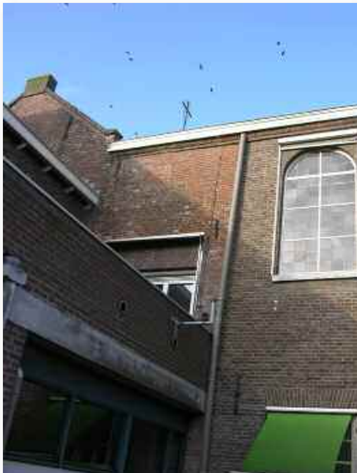
22. Duidelijk is te zien hoe de gevel van de kapel is door gemetseld op de verhoogde gevel van het klooster. Door de verschillende baksteenformaten sluiten de lagen niet goed op elkaar aan