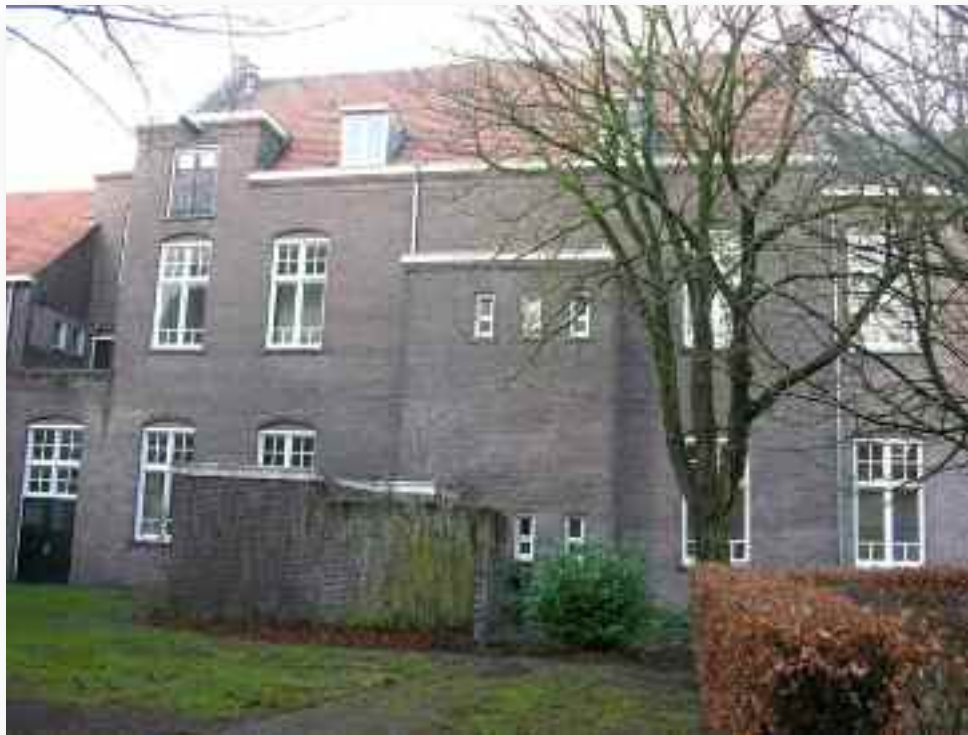
49. De achterzijde van het gebouw uit 1914