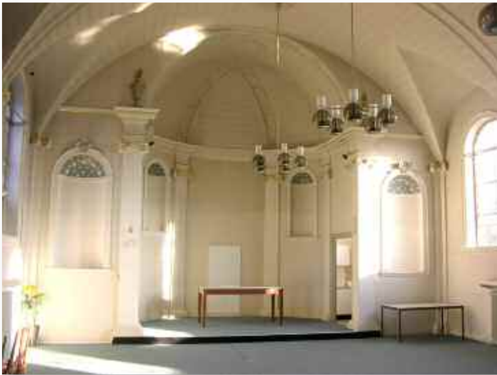
29. Het koor van de kapel met zijn sobere beschildering die sterk afwijkt van de uitbundige uitmonstering die lange tijd het beeld bepaalde. Deze beschildering is wel veel meer in overeenstemming met de bouwtijd en het karakter van de in die tijd gebouwde kerken en kapellen