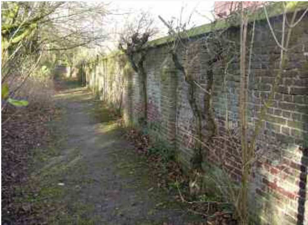
81. De muur die het terrein aan de achterkant afsluit.....