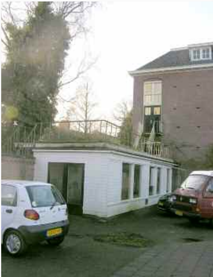
53. ....en de losse aanbouw daar weer tegen aan