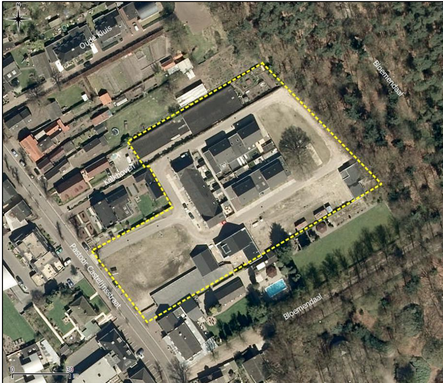
Figuur 2. Luchtfoto van het plangebied en directe omgeving.