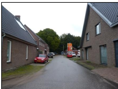
Figuur 6. Nieuwbouw langs Kalkhoven.