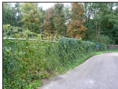
Figuur 4. Hekwerk met klimop langs Kalkhoven.