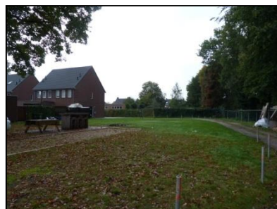
Figuur 7. Oostgrens plangebied.