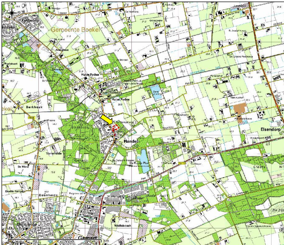
Figuur 1. Topografische ligging van de het plangebied.

Het plangebied ( \pm 1,6 ha) ligt aan de Pastoor Castelijnsstraat, in de kern van Handel, in de gemeente Gemert-Bakel. In figuur 1 is de topografische ligging van het plangebied weergegeven. Volgens de topografische kaart van Nederland, kaartblad 51F (schaal 1:25.000), zijn de coördinaten van het midden van de het plangebied X = 177.648 , Y = 399.162 .