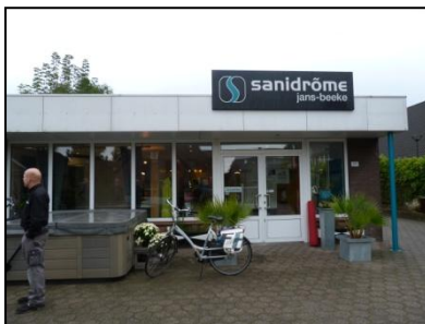
Figuur 3. Voorkant Sanidrome.