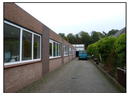
Figuur 8. Opritlaan Sanidrome.