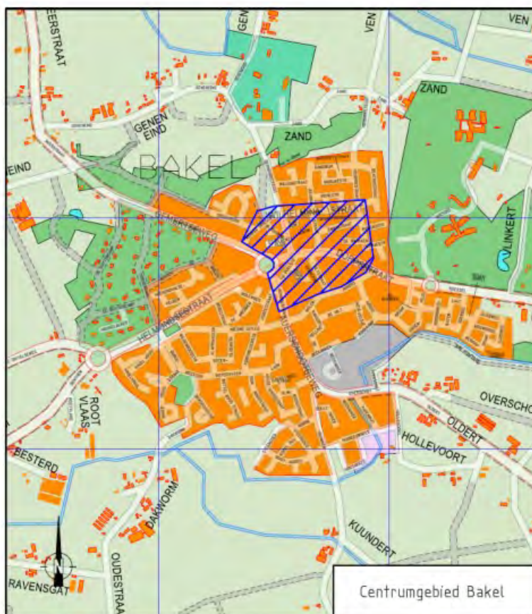
Figuur 2: centrumgebied Bakel