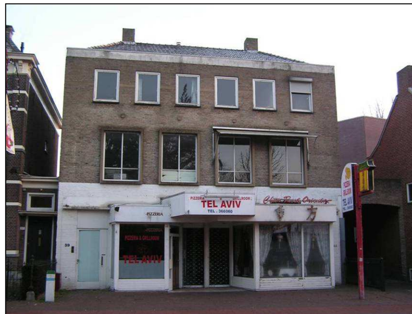
In stijlafwijkende bebouwing op het Ridderplein in Gemert

Misschien nog wel het meest storend is dat de bouwwerken op geen enkele wijze aansluiten op wat in deze regio gebouwd werd. Platte daken treffen we hier van oorsprong nauwelijks aan en het stapelen van woningen, de flat, gebeurde hier al helemaal niet. Nee, wat hier gebouwd werd waren boerderijen, enkele molens, een kasteel, sobere ontginningswoningen en in latere welvarende tijden herenhuizen. Opgebouwd met de materialen die de natuur en ondergrond bood en inspeland op het klimaat, ontstonden eenvoudige bouwsels die we het agrarische huis kunnen noemen.