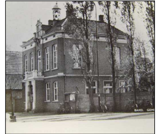
Herenhuis aan het lint. Het oude gemeentehuis uit 1877 in Bakel

oude bebouwing. Maar hoe sluit je aan bij de oude bebouwing? Het eenvoudigste is dat terug te bouwen wat er ooit gestaan heeft of er naar te verwijzen. Een andere mogelijkheid is goed naar de omgeving te kijken en het nieuwe gebouw daarop aan te laten sluiten. Bedoeld wordt de schaal- en maatelementen, alsmede de materiaal- en kleurkarakteristieken van de bestaande bebouwing terug te brengen in de nieuwe gebouwen. De gemeente Gemert-Bakel pleit ervoor om de oude linten in het binnengebied en buitengebied zo goed als mogelijk te herstellen of op z'n minst te versterken. Daarom geldt voor die gebieden dat er historisch geïnspireerd gebouwd moet worden.