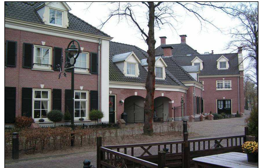
Een voorbeeld van historisch geïnspireerd bouwen staat in Beek en Donk. Het complex heet "De Zeven Zusters" en is van Friso Woudstra architectenbureau. Er is hier gekozen voor een traditionele interpretatie.