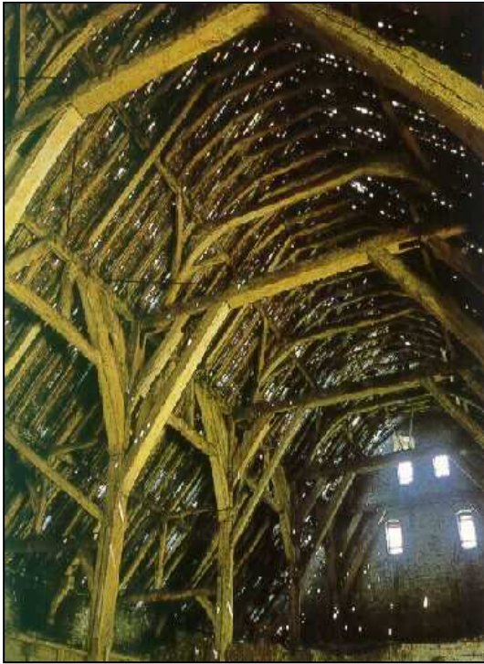
Het principe van de agrarische hut. Het houten gebint schraagt het dak.