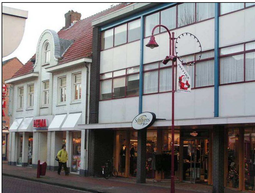
Lelijke gebouwen tussen oude gevels. Nieuwstraat Gemert

Stelt u zich voor. U slentert over het Ridderplein en door de Kerkstraat in Gemert. De winkels staan uitnodigend open en de gevels van de herenhuizen aan het oude lint liggen er fraai bij. Ja, Gemert is mooi. Het is alleen wel jammer dat aan het lint van die grote betonnen gebouwen staan. Wezensvreemd liggen de lelijke kolossen tussen de verfijnde gevels van ver voor de oorlog. Ga maar na, het materiaal is anders, de verhouding wijkt af, de voorgevelrooilijn en het gevelbeeld zijn er niet beter op geworden en het ergste is wel dat de stijl totaal niet passend is. Ja, radicale architectuur was in de jaren vijftig, zestig en zeventig in, maar nu zitten we er toch maar mooi mee.