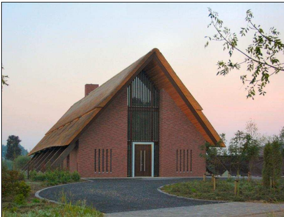
Eigentijdse “boerderij” nabij Veghel/Mariaheide van het architectenbureau Leenders.

Dat vinden mensen immers mooi en het voorkomt de miskleunen die in de afgelopen zestig jaar zijn gebouwd. Belangrijkste is dat mensen weer leren hun eigen woning te bouwen door gereedschap aan te bieden dat vertrouwd en bekend is. Uit het principe van het agrarische huis kan een nieuw huis groeien. Een huis dat zich een houding geeft in zijn omgeving. Een huis met karakter, maar wel een Bakels, een Gemerts of Millus karakter. Sommigen zullen er voor kiezen alles zo historisch mogelijk terug te bouwen, anderen zullen voor een eigentijdse vertaling kiezen. En een enkeling zal wellicht voor grensverleggende architectuur kiezen. Die ruimte moet er altijd blijven, mits gedragen door goede argumenten. Noem het dorpsverfraaiing of decorbouw, punt blijft dat we behoeften hebben aan ankerpunten, vertrouwde plekken waar we kunnen schuilen. Het vertrouwde agrarische of edele huis biedt daarvoor in de huidige snelle tijd de beste garantie.