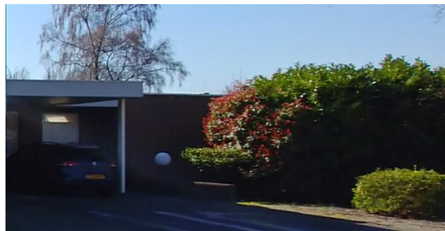
Figuur 8: De woning aan Vicaris van der Asdonckstraat 51