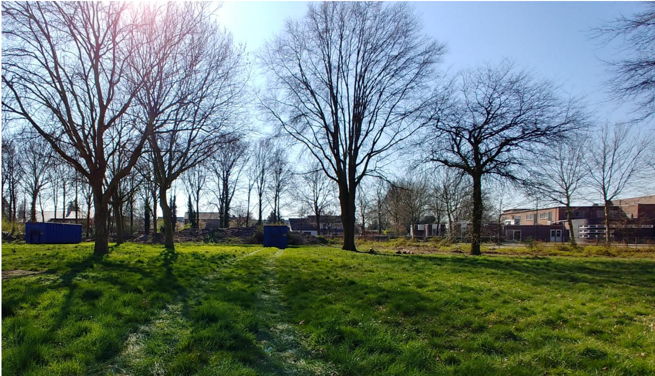
Figuur 4: Overzicht plangebied gezien vanuit het noorden