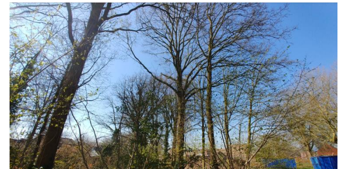
Figuur 6: Groenstructuren zuidzijde plangebied