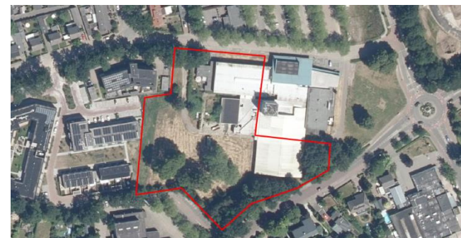
Figuur 2: Luchtfoto plangebied en directe omgeving