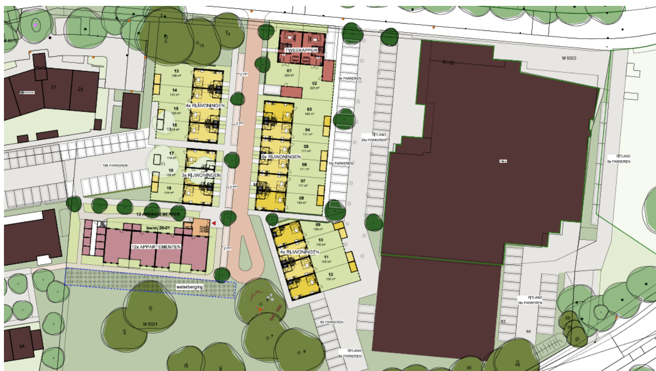
Figuur 3: Toekomstige situatie plangebied