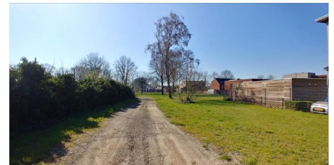
Figuur 9: Noordzijde plangebied