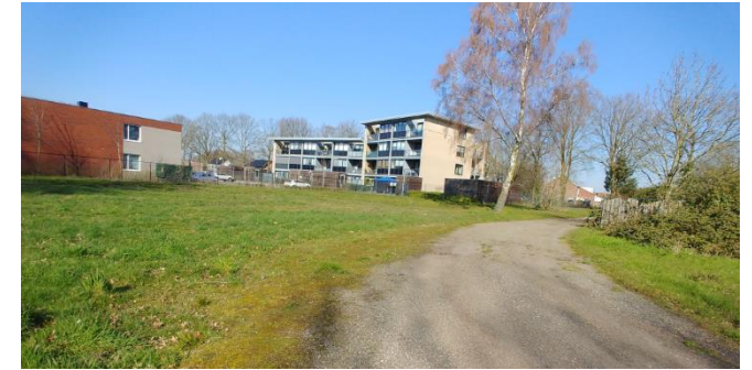
Figuur 5: Noordzijde plangebied