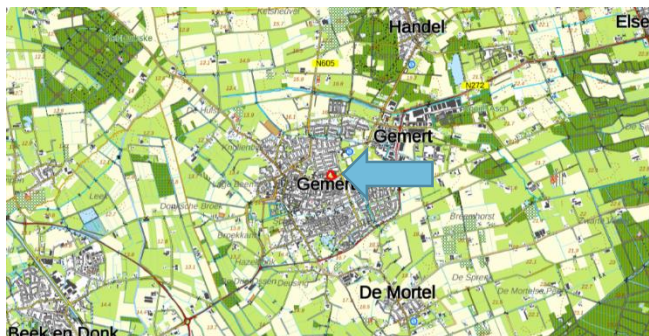
Figuur 1: Topografische kaart ligging plangebied (1:25.000)

De initiatiefnemer is voornemens de woning aan Vicaris van der Asdonckstraat 51 te slopen, en op de braakliggende grond binnen het plangebied 31 wooneenheden, verdeeld over een appartementencomplex, rijwoningen en tweekappers, te realiseren. Hierbij zal de benodigde infrastructuur om de woningen te ondersteunen worden ontwikkeld. Figuur 3 geeft een beeld van de toekomstige situatie.