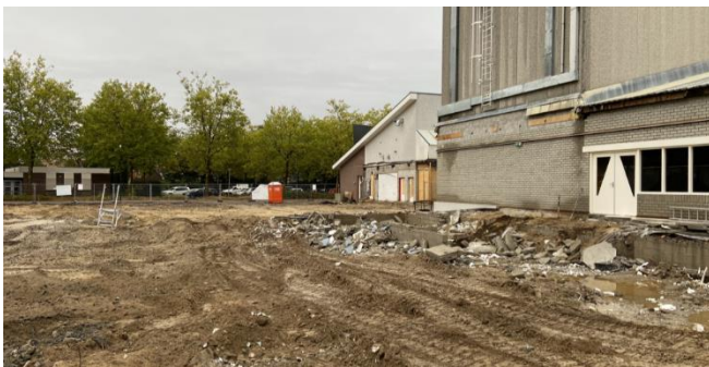
Figuur 7: Gesloopt gedeelte sportcomplex, gezien vanuit het oosten