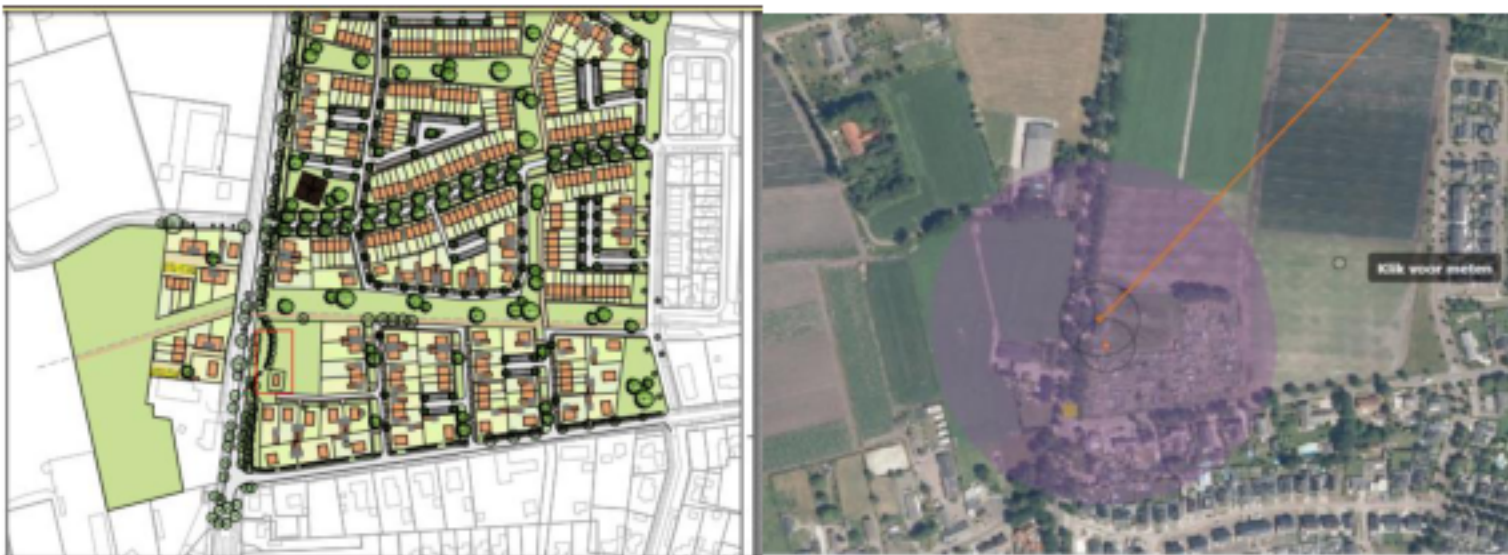
1 Paars: markering invloedsgebied van het vulpunt. Tot en met 380 meter (oranje lijn) kan bij een warme BLEVE kan hittestraling nog 10kW/m 2 bedragen.