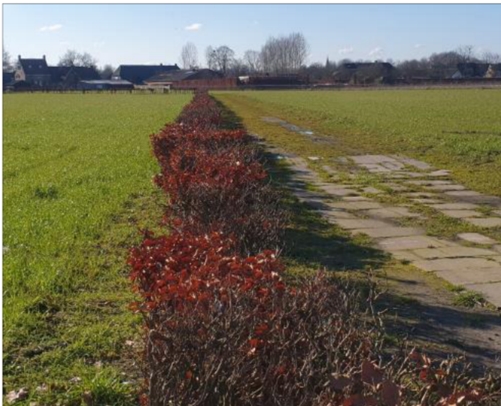
Figuur 3. Foto van de reeds geplante beukenhaag.