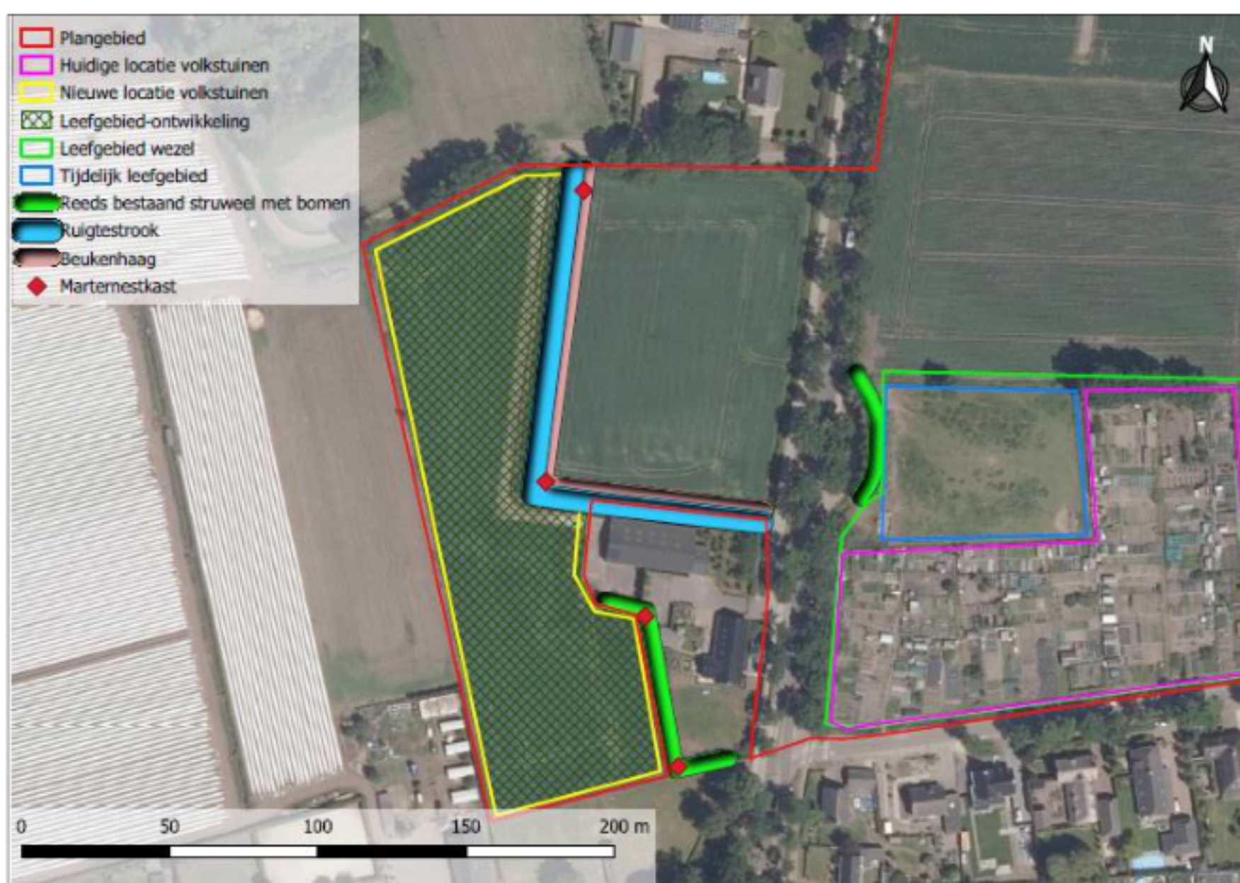
Figuur 2. Toekomstige inrichting van het marterleefgebied.