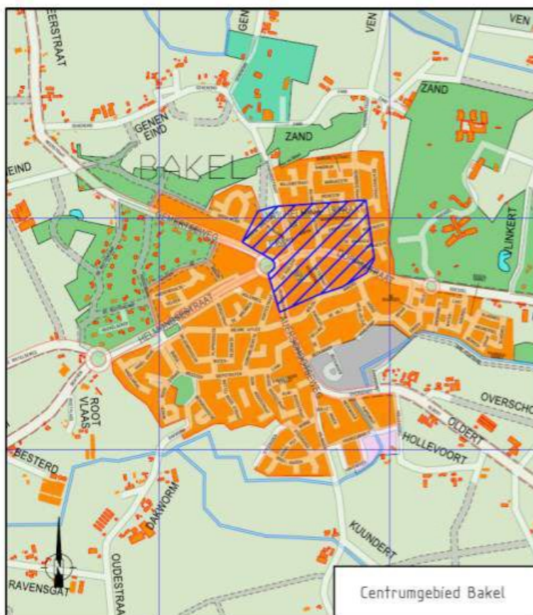
Figuur 2: centrumgebied Bakel