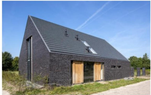
ramen en deuren zijn uitgesneden uit een massa