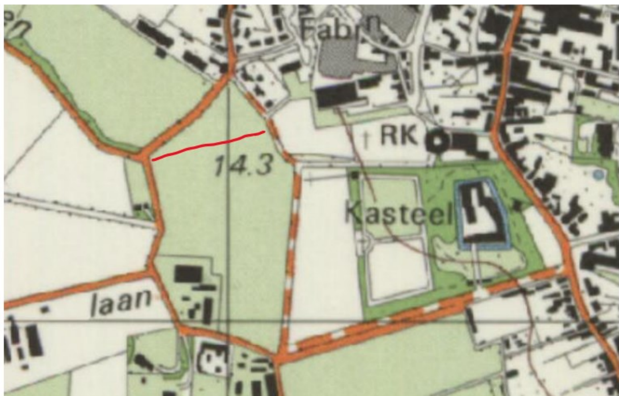
Situatie van voor 2000 met in het rood de huidige vorm van het kavel