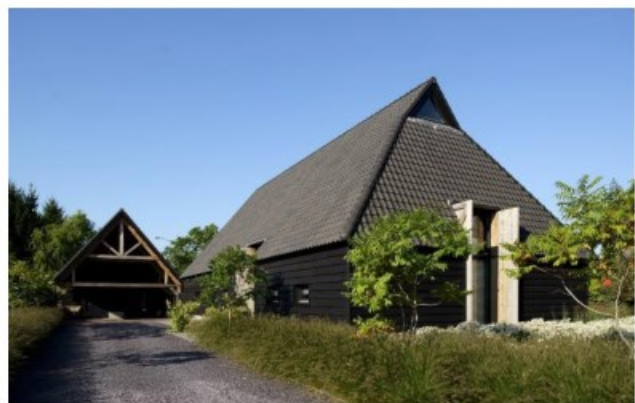
zadeldak met schild en smalle insneden