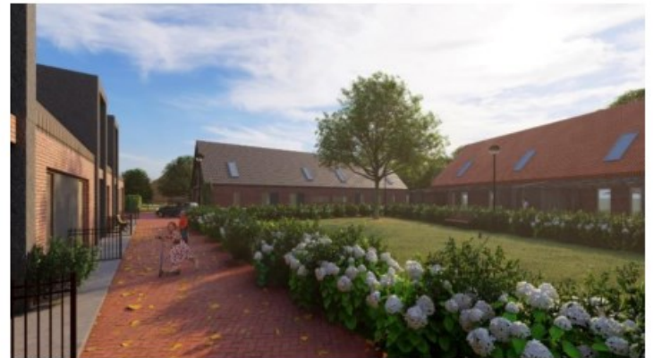
hof met overheersende kapvormen