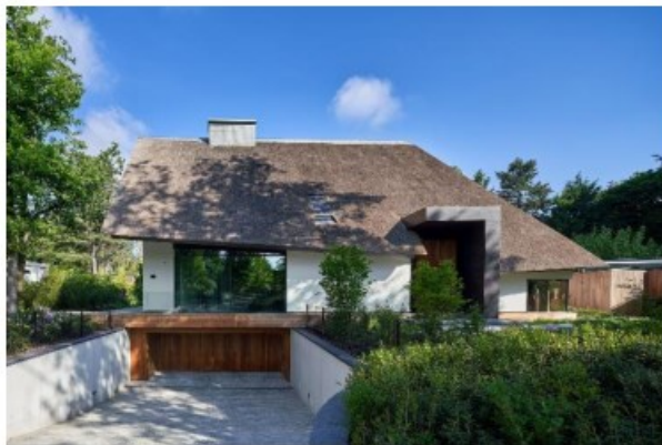
dynamische kapvorm in riet met insneden