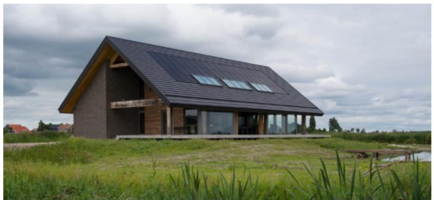
massa, zichtbare constructie en 'losse' kap