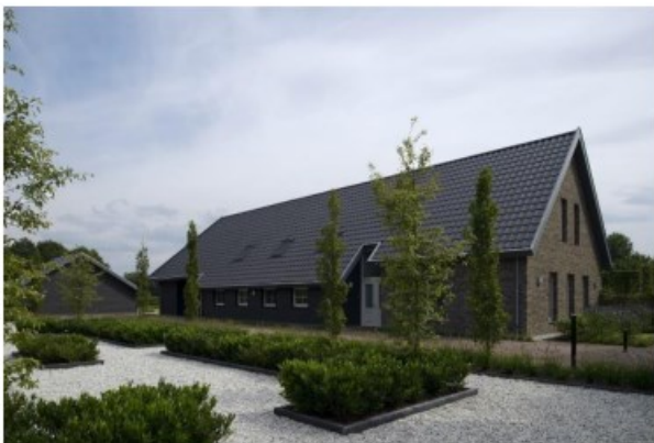
Eenduidige massa met wisselende goot