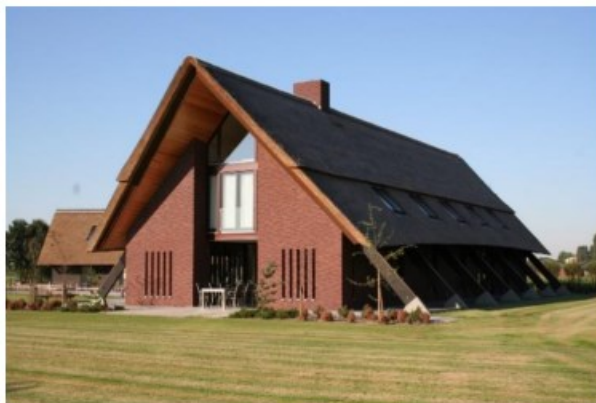
constructie en kap zijn dominant