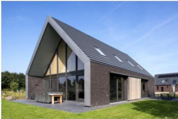
langsgevel en dak vormen een 'deken'