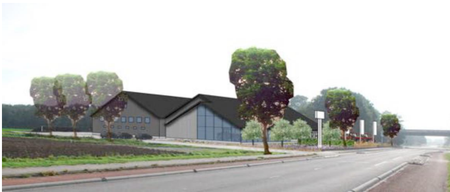
Impressie westzijde bebouwing vanaf Hooilandseweg

Het gebouw bestaat uit twee volumes met de nokrichting parallel aan de Hooilandseweg. In het noordelijke volume bevinden zich de werkplaats en het magazijn. Boven het magazijn is een verdieping met kantoorruimte en magazijn. Het volume heeft een symmetrische kap en de kopgevels hebben een symmetrische indeling. Aan de westzijde, de entreezijde, zijn raamopeningen voor kantoren en magazijn. Aan de oostzijde, de erfzijde, is de gevel grover met een grote opening naar de werkplaats.