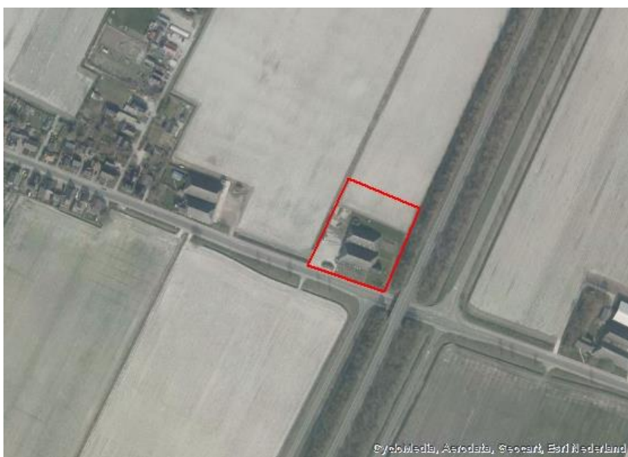
Globale begrenzing projectgebied toekomstige bedrijfslocatie

Het landbouwmechanisatiebedrijf is daarom van plan om een nieuwe bedrijfslocatie te ontwikkelen aan de Hooilandseweg 145 in Roodeschool, in de oksel van de Hooilandseweg en de Eemshavenweg/N46.