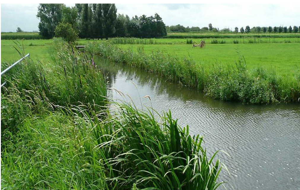
Bestaande knotwilgen bij E: