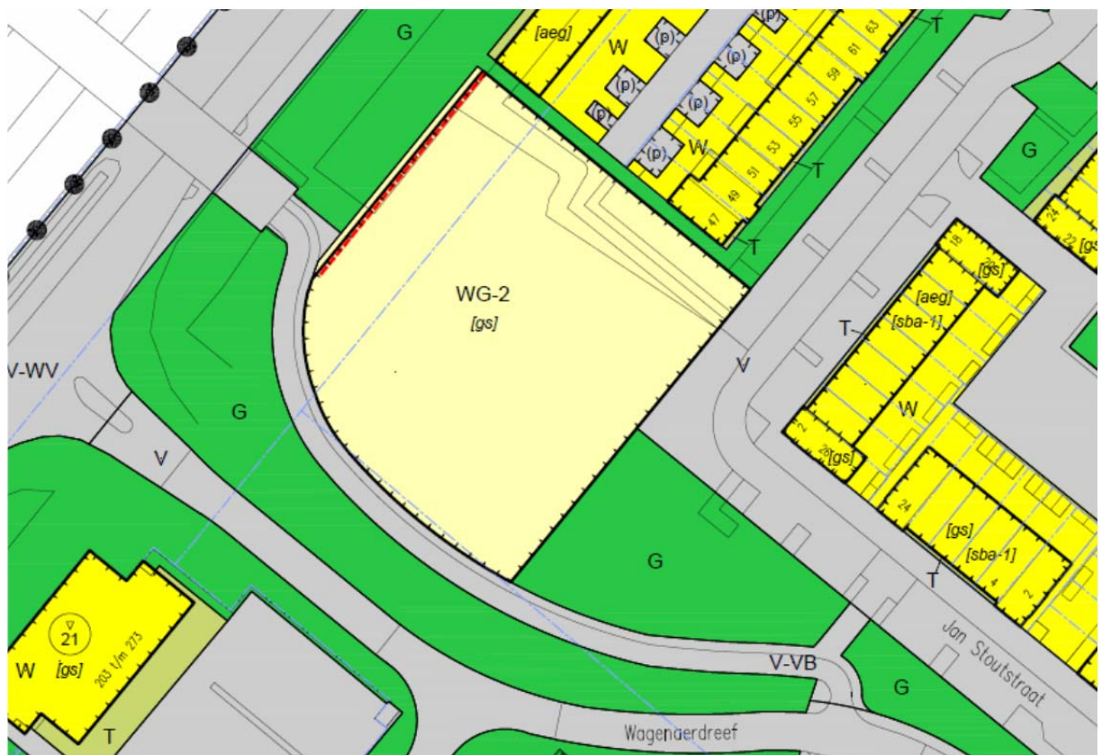
ad 1. situatie ontwerp

Het aantal woningen dat mogelijk is binnen deze bestemming blijft gemaximaliseerd op 30 en wordt mede bepaald door het aantal parkeerplaatsen dat kan worden aangelegd binnen de bestemming.