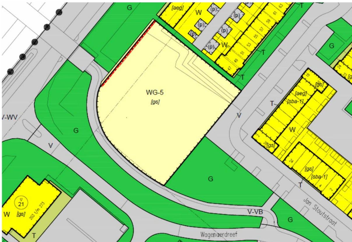
ad 1. situatie vaststelling