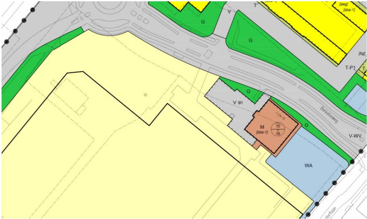
ad 5. situatie vaststelling