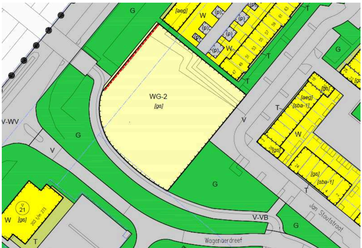
ad 1. situatie ontwerp

Het aantal woningen dat mogelijk is binnen deze bestemming blijft gemaximaliseerd op 30 en wordt mede bepaald door het aantal parkeerplaatsen dat kan worden aangelegd binnen de bestemming.