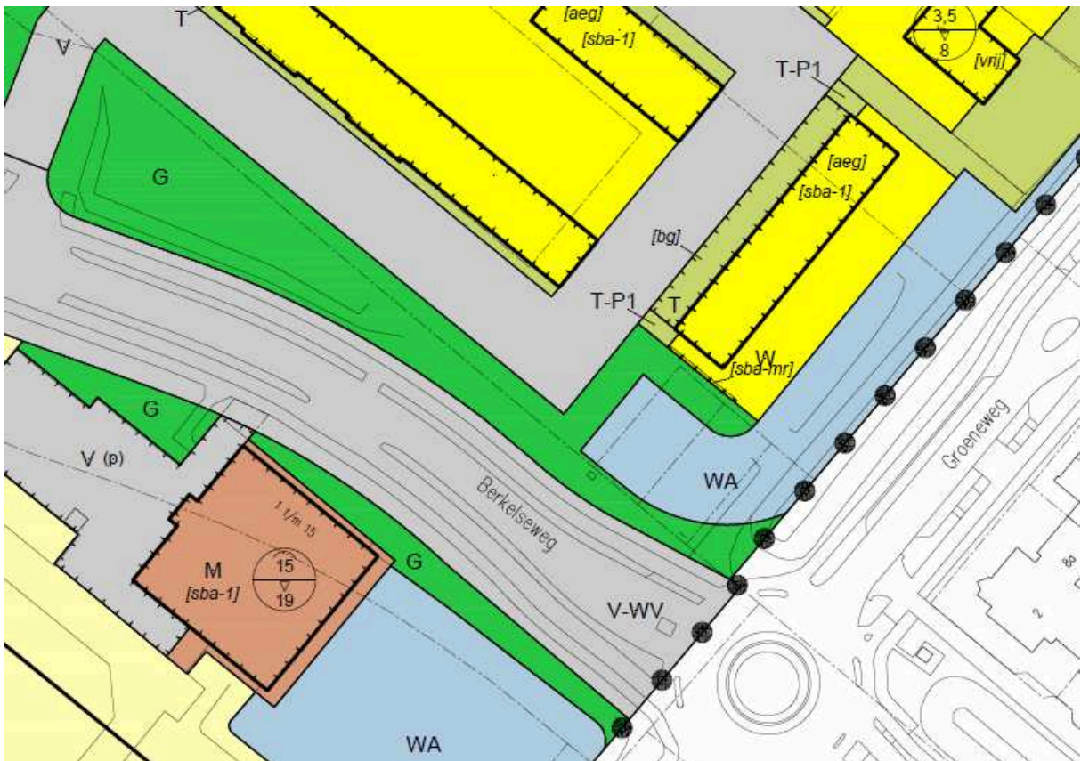
ad 2, 3 en 4. situatie vaststelling