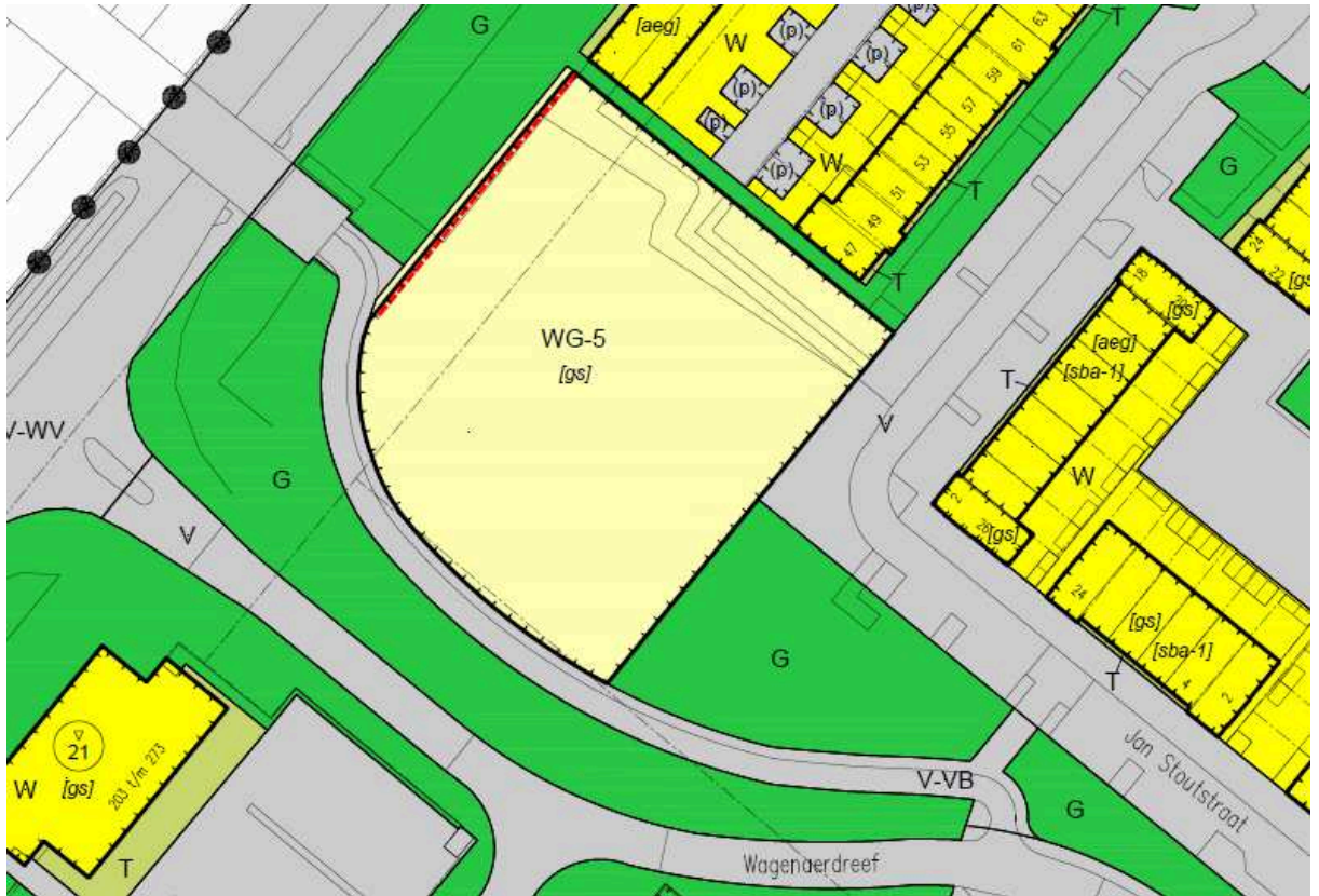
ad 1. situatie vaststelling