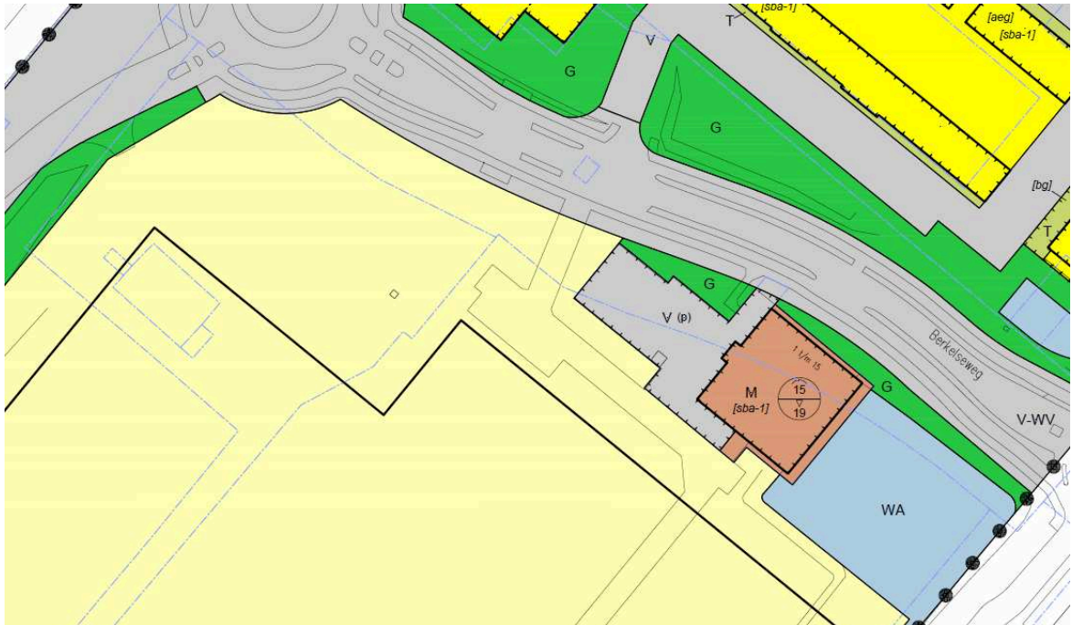
ad 5. situatie ontwerp

In Parkzoom 3, wordt het gedeelte van de bouwrens van de bestemming 'Woongebied - 4' grenzend en parallel aan de Berkelseweg tussen de Randweg-West en de knik in deze bouwrens met 8,2 m evenwijdig en richting Berkelseweg verschoven. Tevens zal de bouwrens op de hoek parallel aan de Randweg-West en parallel aan de Berkelseweg schuin worden afgesneden. Hierdoor wordt het bouwvlak binnen de bestemming 'Woongebied - 4' iets vergroot.