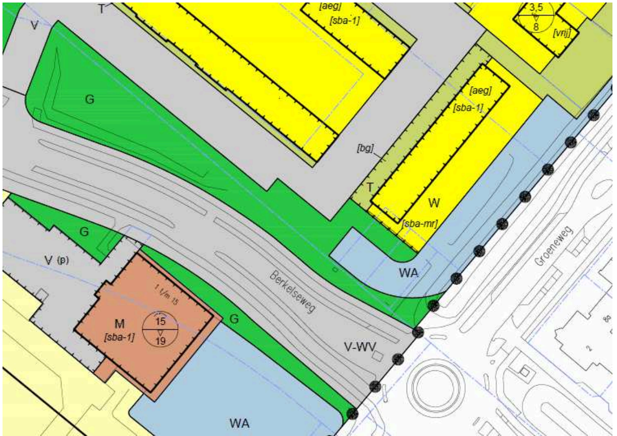
ad 2, 3 en 4. situatie ontwerp