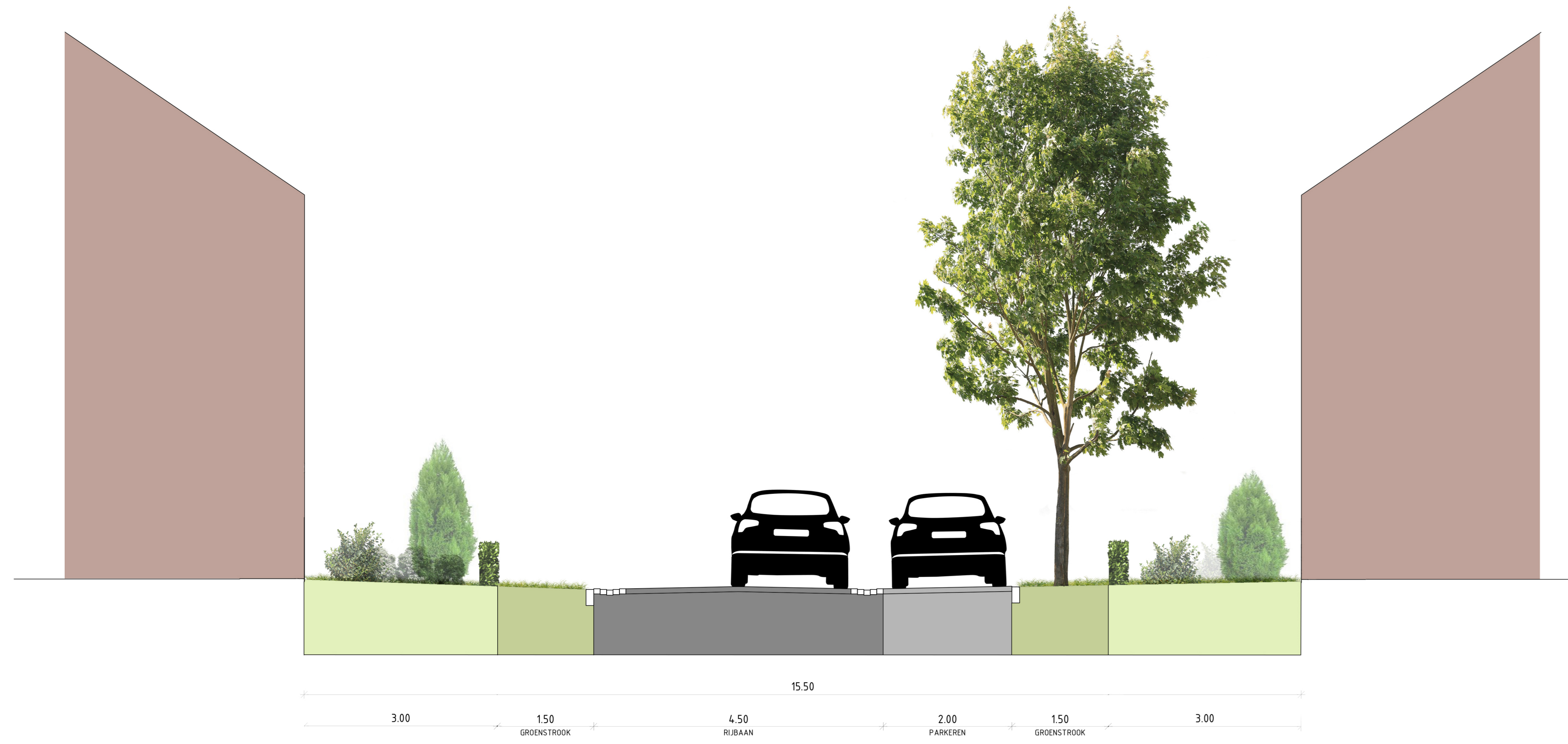
DWARSPROFIEL 2 Woonstraat, langs parkeren zonder watergang