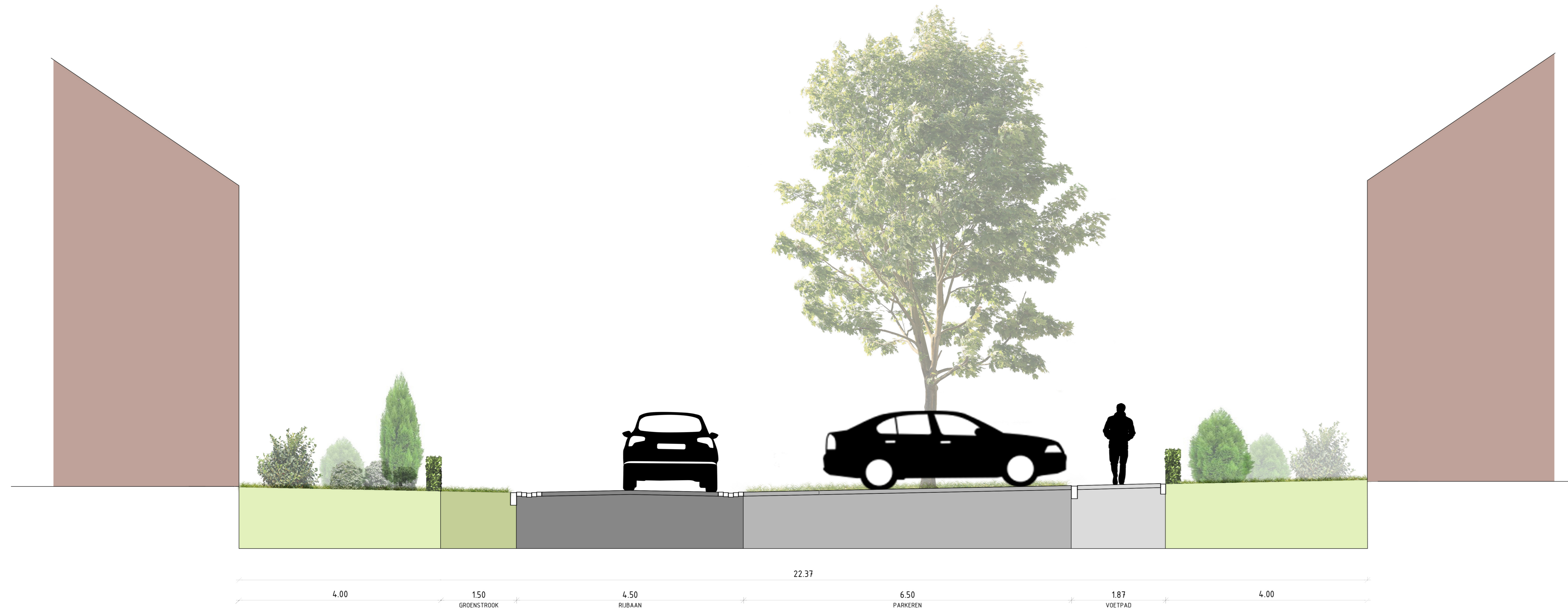
DWARSPROFIEL 4 Dwarstraat met haaks parkeren