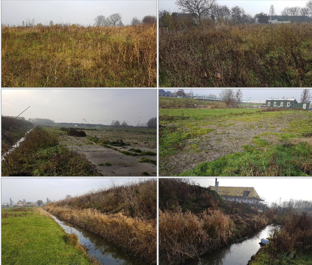
Figuur 2. Impressie van het projectgebied.

Langs en door projectgebied lopen watergangen, deze zijn bestaand en/of nieuw gegraven. Zie figuur 2 voor een impressie van het projectgebied.