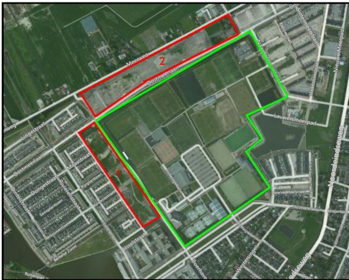
Figuur 1: Ligging sportpark (groen omljnd), project 49 (nummer 1) en plangebied ten noorden (nummer 2)

Het plangebied ligt aan de rand van Berkel en Rodenrijs. Aan de westzijde van sportpark Het Hoge Land is een concreet woningbouwplan geprojecteerd. Aan de noordzijde wordt ook woningbouw geprojecteerd, dit gebied is echter nog niet concreet ingevuld. In figuur 1 is de ligging van het sportpark aangegeven.