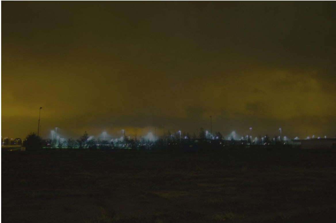
Figuur 4: Foto van het sportpark met verlichting aan