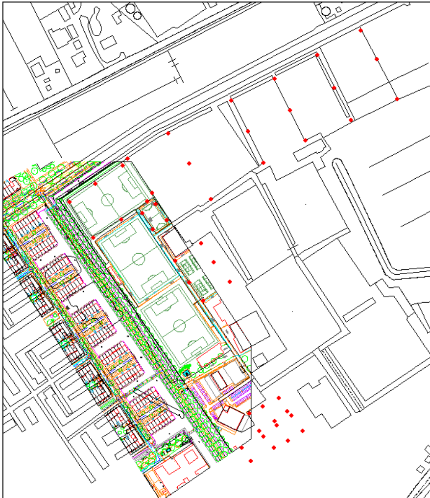
Figuur 3: Locatie lichtmasten (rode punten)

In figuur 3 is de positie van de lichtmasten weergegeven. In figuur 4 is een overzichtsfoto van het sportpark met de verlichting weergegeven.