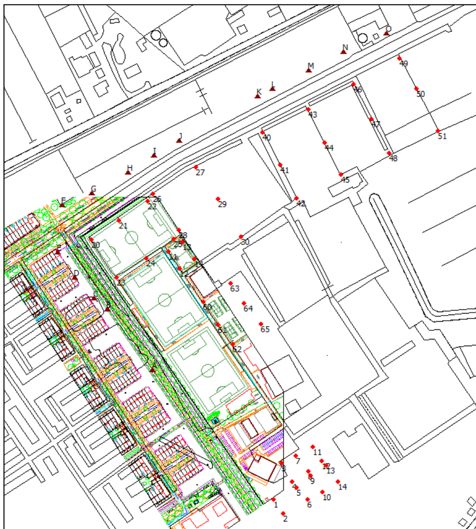
Figuur 5: Posities meetlocaties (paarse driehoeken) en lichtmasten (rode punten)

In figuur 5 zijn de lichtmasten van het sportpark nogmaals weergegeven. In de figuur zijn de masten genummerd. Daarnaast zijn in de figuur de verschillende meetlocaties weergegeven.