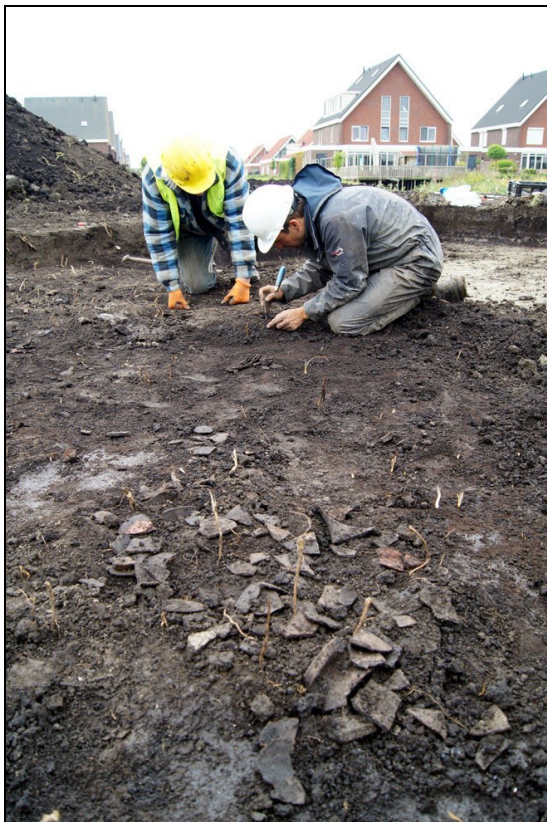
Afbeelding 3. In 2012 is een deel van een 13 de eeuwse woonkern in de zuidwest-hoek van het plangebied reeds onderzocht.