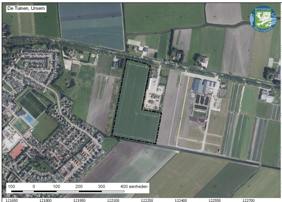
Afbeelding 1. De locatie van het plangebied De Tuinen, fase 1 (zwarte stippellijn) op een luchtfoto

Archeologisch onderzoek van het resterende deel aan deze oostkant levert vermoedelijk weinig tot geen nieuwe informatie op.