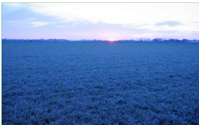
Het te onderzoeken graslandperceel.

Ten slotte bevat hoofdstuk 6 de conclusies. Indien van toepassing worden aanbevelingen gedaan. Hoofdstuk 7 geeft een overzicht van de gebruikte literatuur. In de bijlage is aanvullende informatie opgenomen over de geldende wetgeving en de gebruikelijke procedures bij een vergunnings- en/of ontheffingsaanvraag.