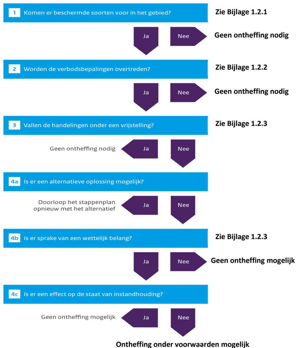
Figuur 3. Stappenplan procedure ecologisch onderzoek en ontheffing