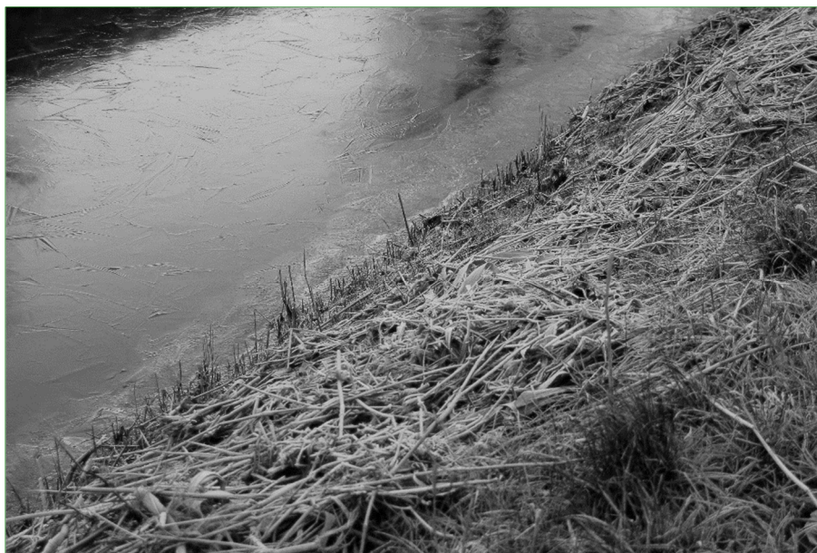
Op de oevers in het plangebied kunnen Meerkoet en/of Wilde eend gaan broeden.