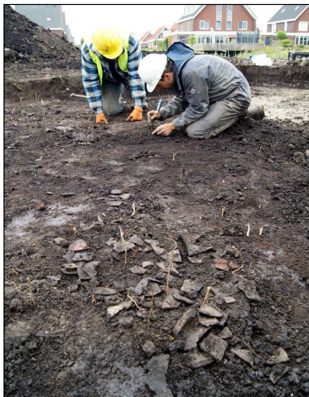
Afbeelding 3. Tijdens het onderzoek in 2012 is onder andere een vondstrijck spoor met keramiekfragmenten uit de 13 de eeuw aangetroffen (naar: Gerritsen 2013, 32).