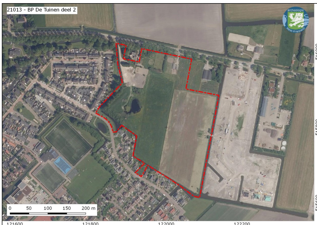
Afbeelding 1. De ligging van het plangebied (rode stippellijn) op een luchtfoto