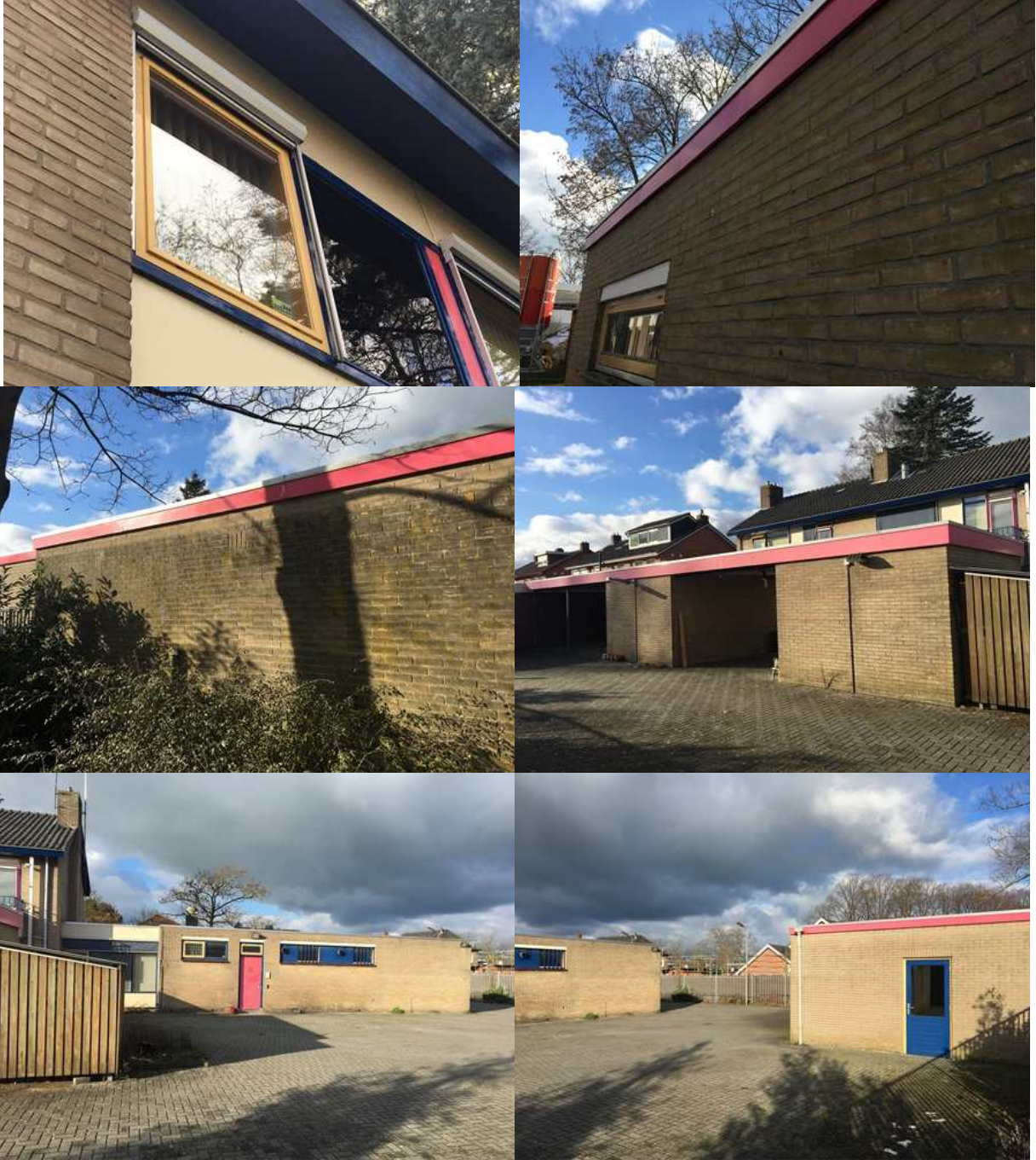
Bijlage 3. Fotobijlage. Impressie van het plangebied en de directe omgeving.