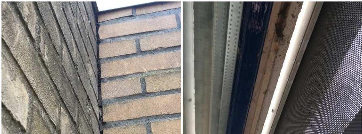
Foto links: detailopname van de aanhechting van de uitbreiding op de oorspronkelijke woning; vleermuizen kunnen via de kier de spouw niet betreden. Foto rechts: detailopname van de zonwering aan de buitengevel. Deze is op enige afstand van de gevel geplaatst waardoor vleermuizen er geen verblijfplaats achter kunnen bezetten.

Er zijn tijdens het veldbezoek geen vleermuizen waargenomen en er zijn geen aanwijzingen, zoals uitwerpselen, gevonden die op de aanwezigheid van een verblijfplaats van vleermuizen duiden. De te slopen bebouwing wordt als een ongeschikte verblijfplaats voor vleermuizen beschouwd. Het gebouw beschikt over een (geïsoleerde) spouw, maar er zijn geen potentiële invliegopeningen, zoals open stootvoegen of ventilatieopeningen, in de buitengevel waargenomen die vleermuizen de kans bieden een verblijfplaats te bezetten in de spouw. Ook ontbreken potentiële verblijfplaatsen van vleermuizen aan de buitenzijde van het gebouw, zoals een holle ruimte achter een windveer, vensterluik, gevelbetimmering, boeiboord of zonwering. Ook ontbreken open dilatatievoegen.