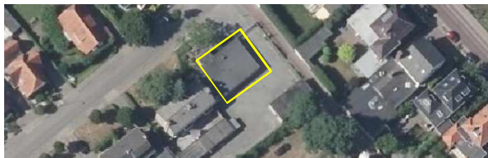
Aanduiding van de te slopen aanbouw in het plangebied.

Het concrete voornemen bestaat om de aanbouw de noordoostzijde van het woonblok te slopen. De beide woningen welke aan de aanbouw grenzen worden intern verbouwd. De ondergrond van de aanbouw en wordt nadien in gericht als tuin/erfverharding. Op onderstaande afbeelding wordt de te slopen aanbouw aangeduid.