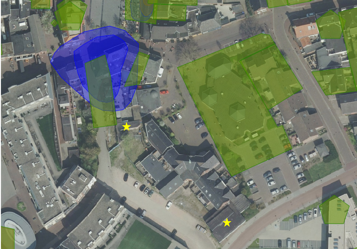
Afb 2: Weergave bodematlas met de VOCl verontreiniging (blauwe contour). De gele sterren geven aan waar aanvullend onderzoek moet plaatsvinden na sloop van de panden