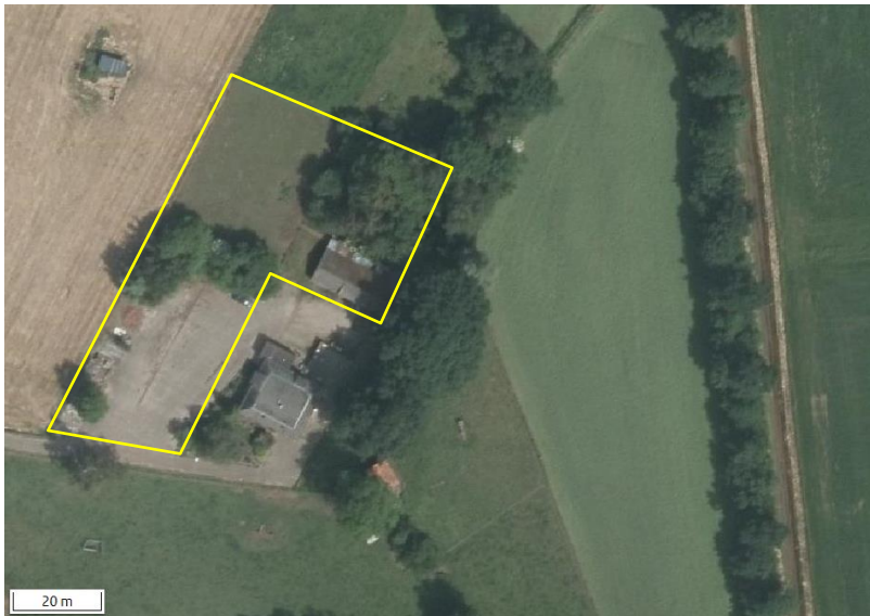
Detailopnames van deelgebied Pastoor Zanderinkstraat. De begrenzing van het plangebied wordt met de gele lijn aangeduid.