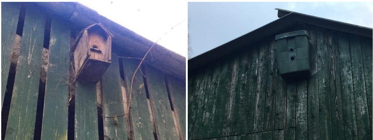
Nestkastjes bieden vogels de kans om in het plangebied te nestelen.

Het plangebied behoort tot functioneel leefgebied van verschillende vogelsoorten. Vogels benutten het plangebied als foerageergebied en vermoedelijk nestelen er jaarlijks vogels in de toegankelijke gebouwen, nestkastjes, bomen en struiken. Vogelsoorten die mogelijk in het plangebied nestelen zijn houtduif, holenduif, merel, koolmees, pimpelmees en witte kwikstaart. De bebouwing wordt als een ongeschikte nestplaats voor huismussen beschouwd en er zijn geen aanwijzingen gevonden dat steen- of kerkuil een verblijfplaats bezetten in het plangebied.