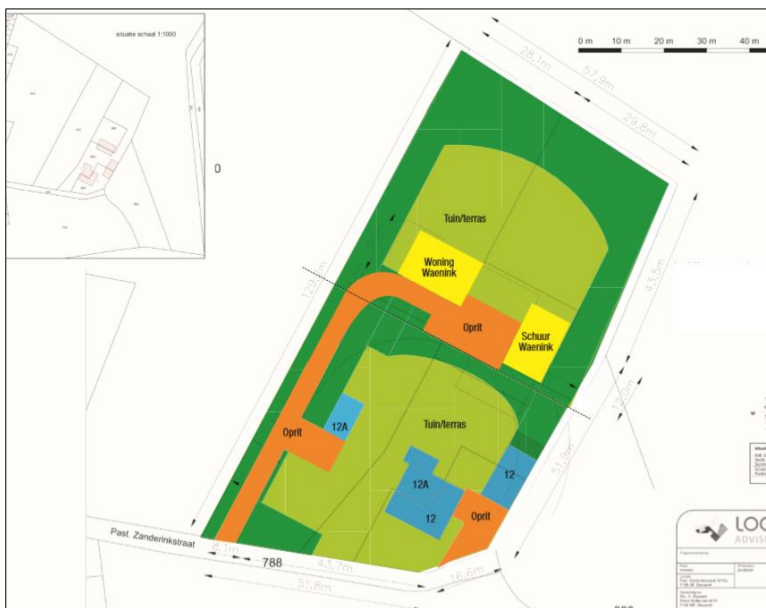
Verbeelding van het wenselijke eindbeeld in deelgebied Pastoor Zanderinkstraat.

Het voornemen bestaat om een woning en bijgebouw te bouwen in deelgebied Pastoor Zanderinkstraat. Om de bouw van de woning mogelijk te maken moet het perceel bouwrijp gemaakt worden. Onderdeel van het bouwrijp maken is het slopen van de aanwezige opstallen en enkele bomen. Het erf wordt nadien landschappelijk ingepast. De erfverharding in het Zuidwestelijke deel van het plangebied wordt her-ingericht en deels verwijderd. Ter compensatie voor de bouw van de woning, worden de beide varkensstallen in deelgebied Hellerweg gesloopt. De ondergrond van de stallen wordt nadien ingericht als tuin. Op onderstaande afbeelding wordt een indicatief ontwerp van het deelgebied Pastoor Zanderinkstraat weergegeven.