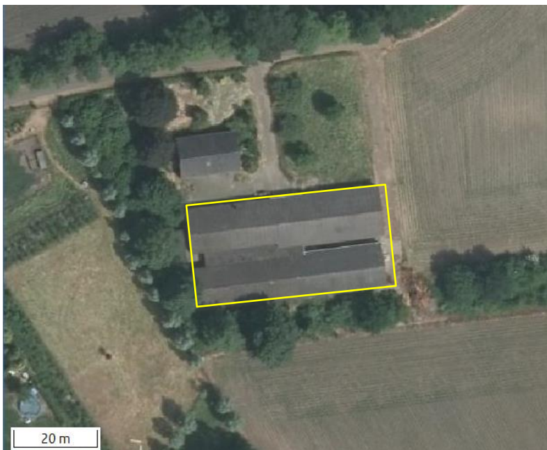
Detailopnames van deelgebied Hellerweg. De begrenzing van het plangebied wordt met de gele lijn aangeduid.

Dit deelgebied vormt een deel van een (voormalig) agrarisch erf en bestaat volledig uit bebouwing. In het plangebied staan twee varkensstallen. Deze zijn traditionele varkensstallen, gebouwd van bakstenen en gedekt met golfplaten. De schuren beschikken over een (holle) spouw en dakisolatie in de vorm van isolatieschuimplaten welke aan de onderzijde van de gording is bevestigd. De stallen verkeren in een goede staat van onderhoud; ze zijn wind- en waterdicht. Op onderstaande afbeelding wordt een luchtfoto van het plangebied weergegeven, evenals de begrenzing van het onderzoeksgebied. Voor een impressie van het plangebied wordt verwezen naar de fotobijlage.