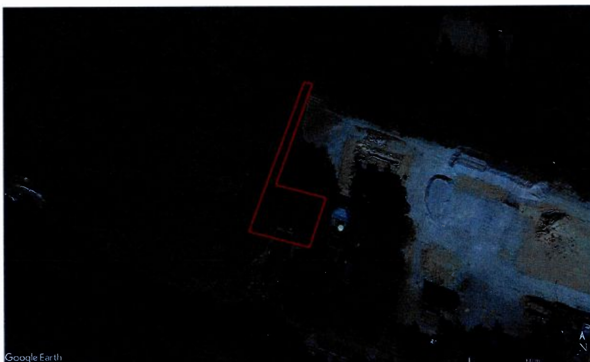
Figuur 2 Leersumsestraatweg 5 te Doorn