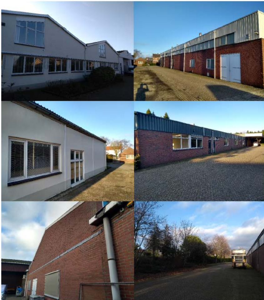
Figuur B1.1 Impressie huidige situatie plangebied

In het plangebied bevinden zich in de huidige situatie bedrijfsgebouwen die vroeger onderdeel waren van een buizenfabriek. De fabriek is gebouwd in 1962 en is in verschillende fases uitgegroeid tot het huidige complex. Doordat het terrein uit verschillende percelen bestaat die oorspronkelijk van verschillende eigenaren waren, is het complex een aaneenschakeling van verschillende fabriekshallen. Het terrein lag in eerste instantie aan de rand van het centrum van Silvolde maar is door de jaren heen steeds meer omringd door woningbouw. Momenteel is de buizenfabriek niet meer in productie. De gebouwen worden in meer of mindere mate gebruikt door bedrijven voor werkzaamheden of als opslagplaats. Het oostelijke gebouw betreft een kantoorpand dat leeg staat. De volgende afbeeldingen geven een impressie van de huidige situatie in het plangebied.