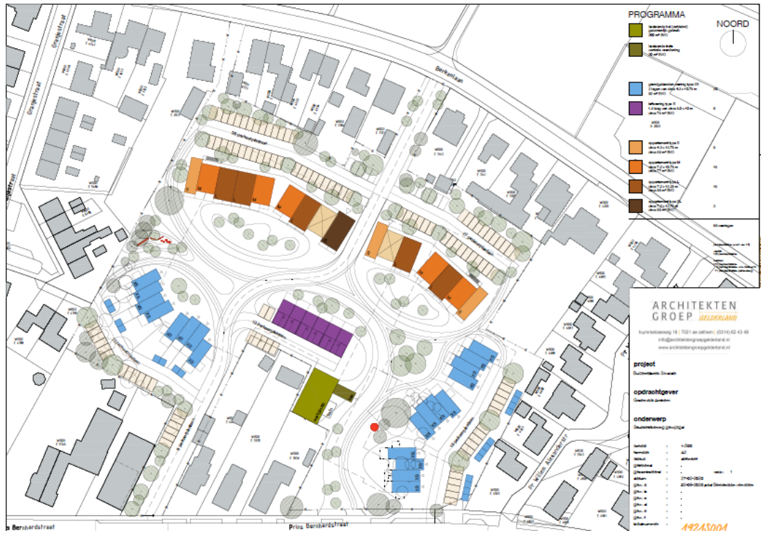
Figuur B1.2 Indicatieve stedenbouwkundige opzet