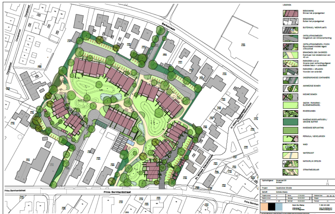
Figuur B1.3 Indicatieve impressie toekomstige situatie plangebied