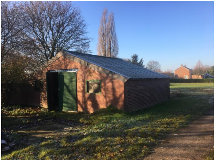
Kleine loods wordt compleet afgebroken