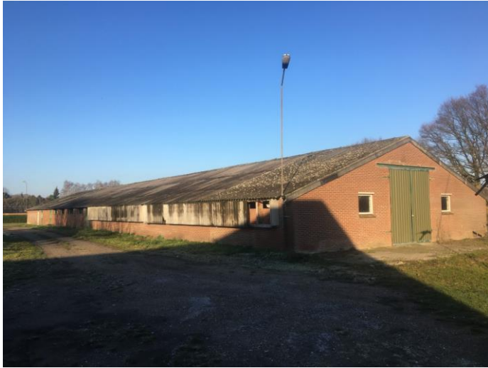
Loods wordt grotendeels afgebroken, 170m 2 blijft staan.