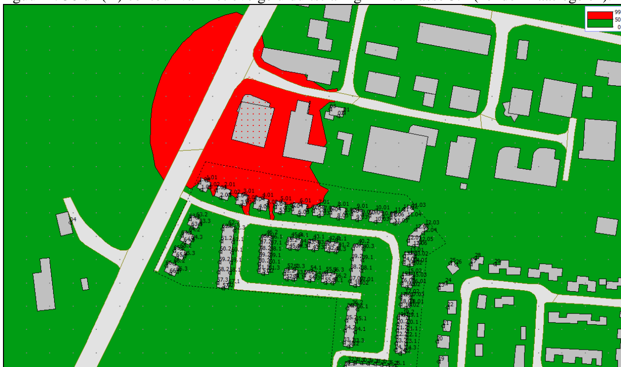
figuur 1: 50 dB(A) contour van fictieve geluiduitstraling milieuklasse 3.2 (zonder maatregelen).

Uit figuur 1 volgt dat, bij invulling van de maximaal toelaatbare geluidruimte (mk 3.2), bij 6 woningen de richtwaarde van 50 dB(A) etmaalwaarde wordt overschreden. De hoogste gevelbelasting bedraagt 54 dB(A) etmaalwaarde. Om een goede ruimtelijke ordening alsnog te waarborgen kunnen aanvullende maatregelen overwogen worden. Om te kunnen voldoen aan de richtwaarde van 50 dB(A) kan bijvoorbeeld de grondwal over een lengte van ten minste 70 m worden opgehoogd tot een hoogte van minimaal 6 m.