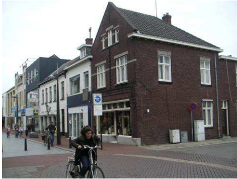
Stationsstraat hoek Boermansstraat