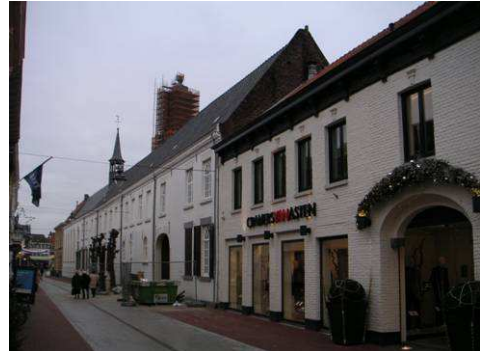
Noordzijde Maasstraat ter hoogte van klooster