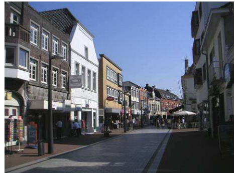
Oostzijde Langstraat tegenover Van Berlostraat