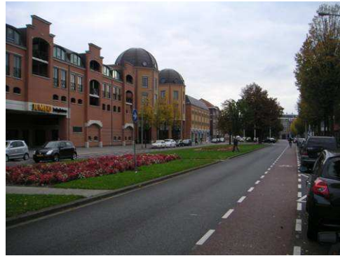
Ursulinencomplex aan de Wilhelminasingel