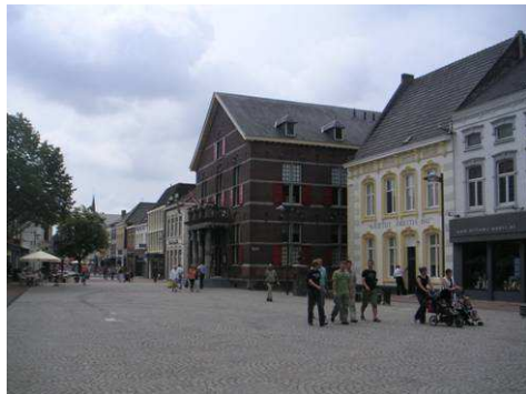
Markt met het Jacob van Hornemuseum