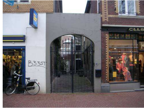
Steeg tussen Langstraat 4 en 6 (vakwerkgevel)