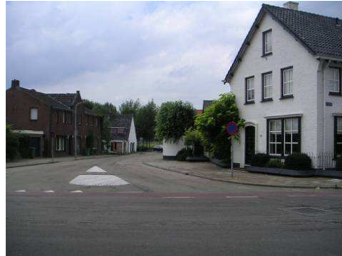
Beekpoort met aanzet richting Hushoverweg