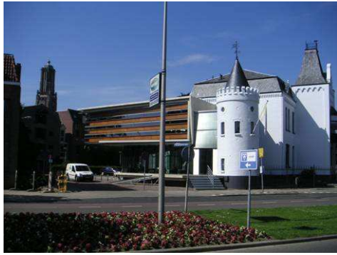
'Kasteel' Walburg met nieuwe vleugel