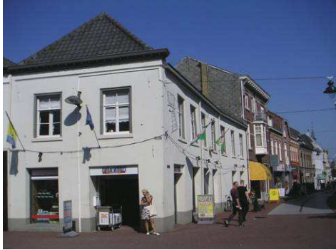
Hoek Markt – Maasstraat