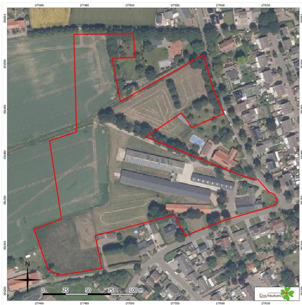
Bijlage 3. Weert – Stramproy Veldstraat 73. Luchtfoto plangebied (Figuur 10 rapport)

ArchAeO Archeologische Advisering en Ondersteuning