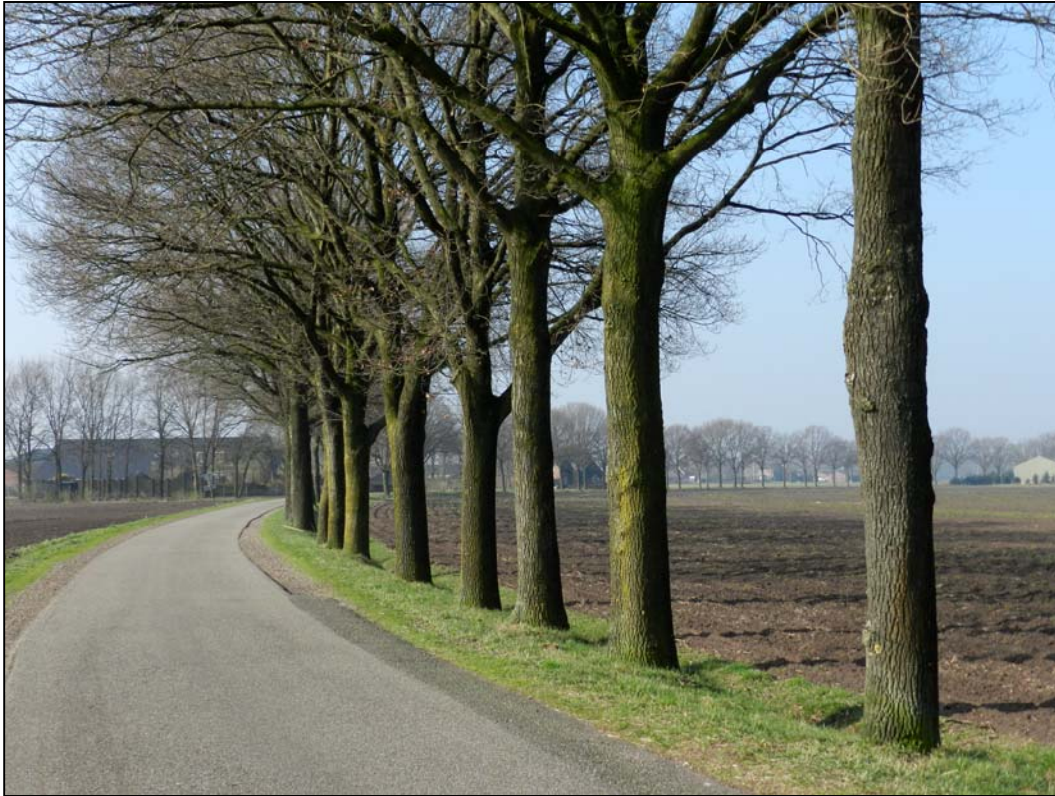
Eiken langs de Ringweg