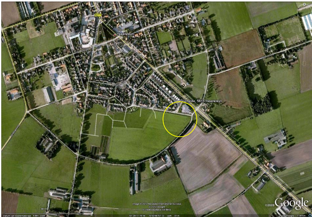
Luchtfoto