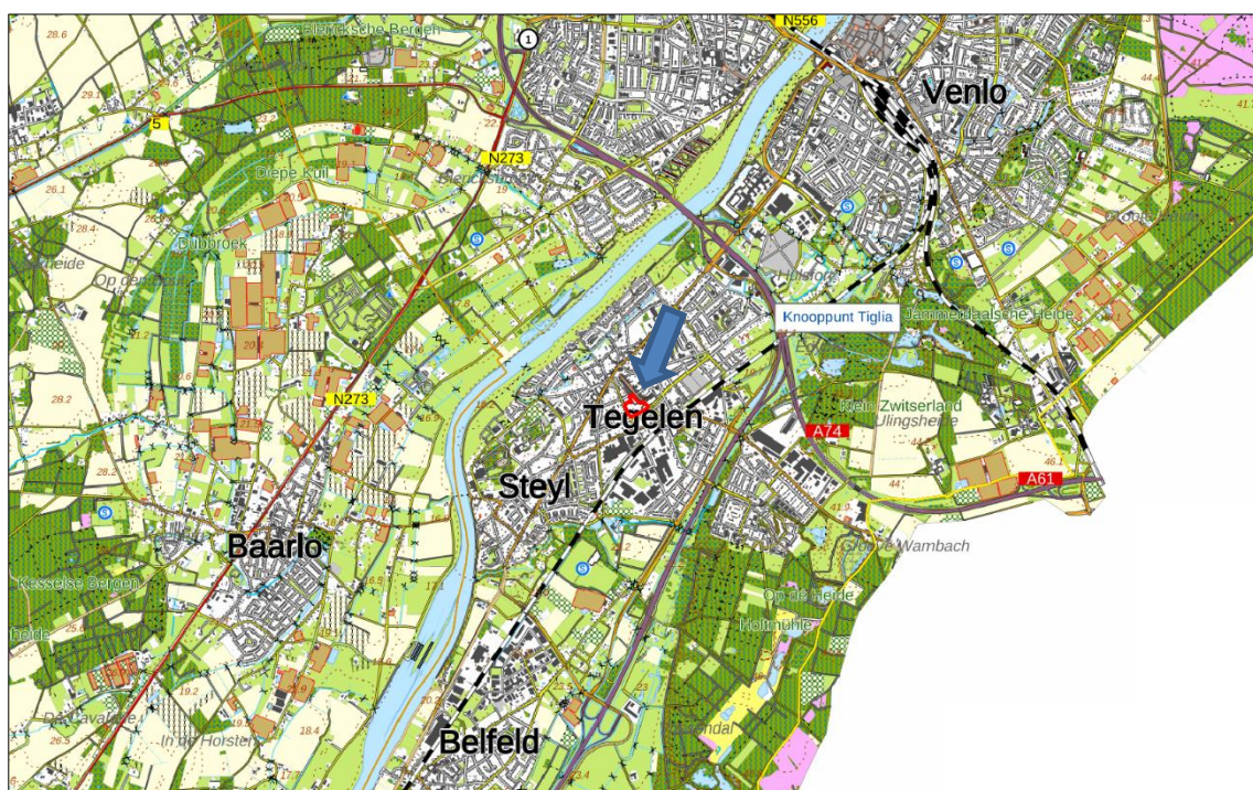
Figuur 1. Topografische kaart ligging van het plangebied (1:25.000)

Het plangebied is gelegen in de kern van Tegelen, ten noordwesten van het station. In figuur 1 is de topografische ligging van het plangebied weergegeven.