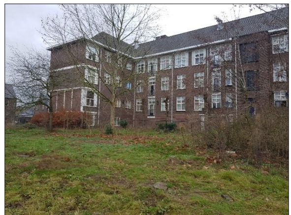
Figuur 9. Bestaande gebouw noordwesten plangebied