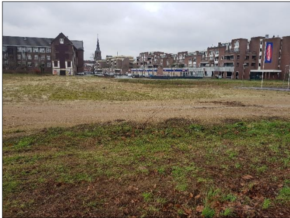
Figuur 4. Overzicht plangebied gezien vanaf Raadhuislaan