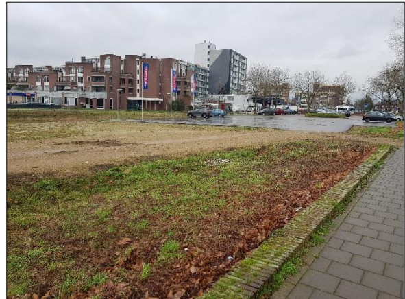
Figuur 5. Overzicht plangebied met parkeerplaats gezien vanaf Raadhuislaan