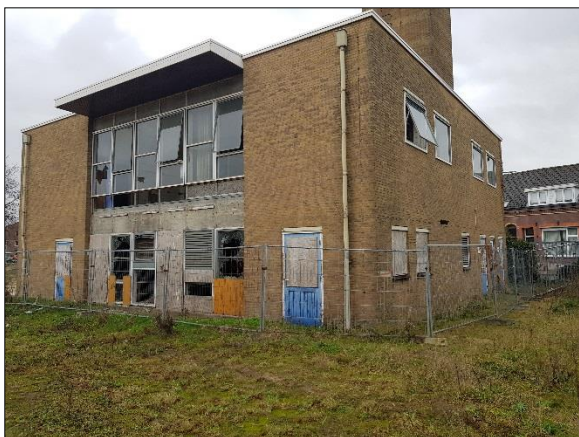
Figuur 8. Bestaande gebouw zuidwesten plangebied