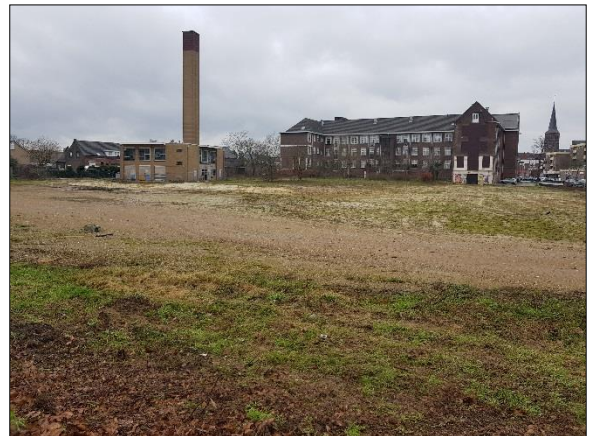
Figuur 7. Overzicht braakliggend gedeelte met bestaande bebouwing gezien vanaf Raadhuislaan