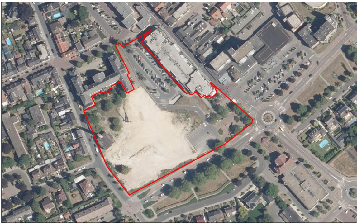
Figuur 2. Luchtfoto van het plangebied en de directe omgeving