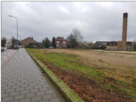
Figuur 6. Rand plangebied met Raadhuislaan