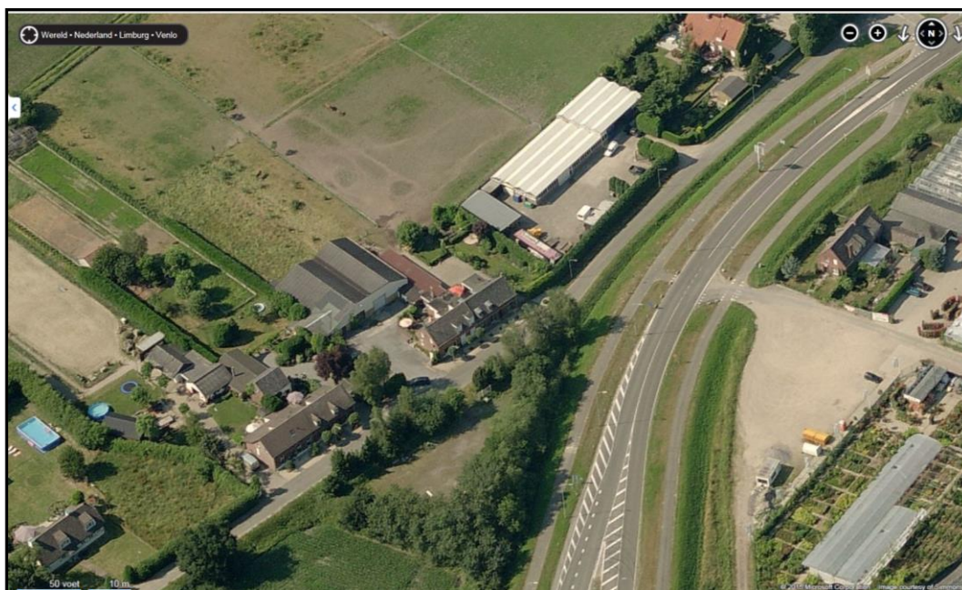
Luchtfoto met ligging plangebied.

Het plangebied is gelegen aan de Weselseweg 21 in Venlo ('t Ven). In de omgeving zijn met name woningen en kleine bedrijven gelegen. Het plangebied zelf is bebouwd met een opslagloods en (bedrijfs)woning en bestaat voor het overige uit erf en tuin. Het perceel wordt ontsloten door de (parallelweg langs de) Weselseweg. Ten zuiden van het plangebied ligt de A67.