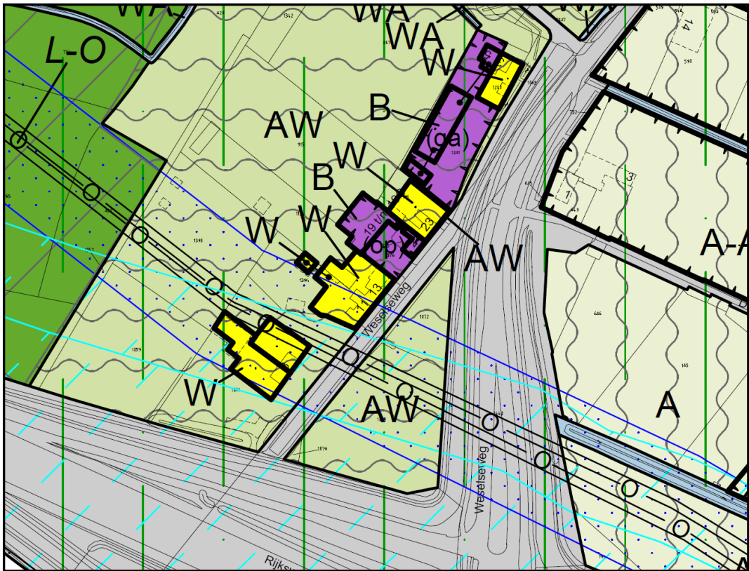
Uitsnede verbeelding bestemmingsplan 'Buitengebied Venlo'.