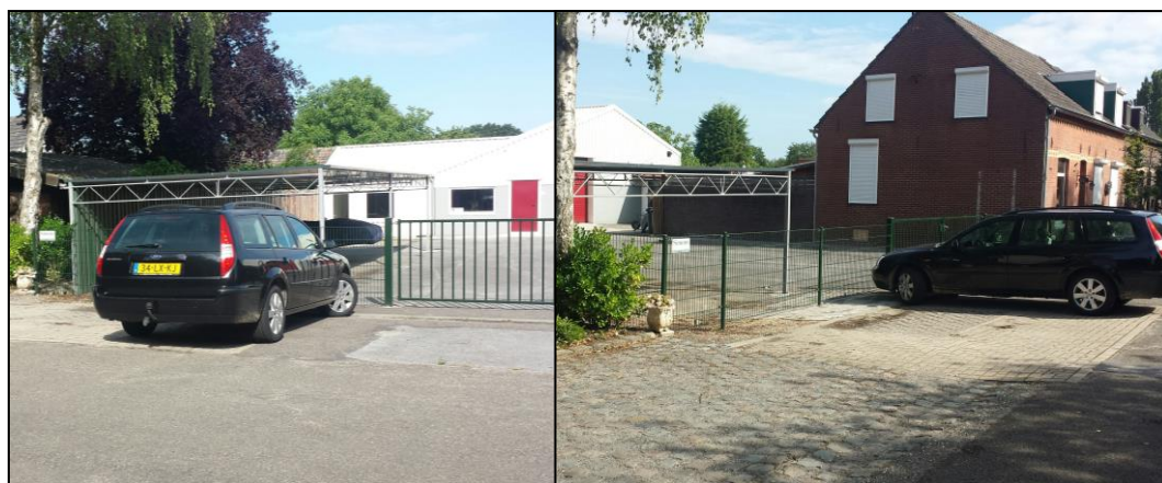
Ligging bestaande parkeerplaatsen t.b.v. de woning

Voor de beoogde woonfunctie dient uitgegaan te worden van een minimale parkeernorm van 1,9 parkeerplaats per woning. Dit betekent dat in principe op eigen terrein voorzien dient te worden in minimaal 2 parkeerplaatsen voor de woonfunctie. Overeenkomstig de bestaande situatie, waarin het parkeren voor de bestaande woning reeds aan de voorzijde plaatsvindt, zijn er 2 parkeerplaatsen voor de woning aanwezig. Deze zijn gelegen aan de zuidwestelijke zijde van de woning (zie ook onderstaande foto's). De openbare ruimte zal door de functiewijziging dan ook geen extra parkeerdruk ondervinden.