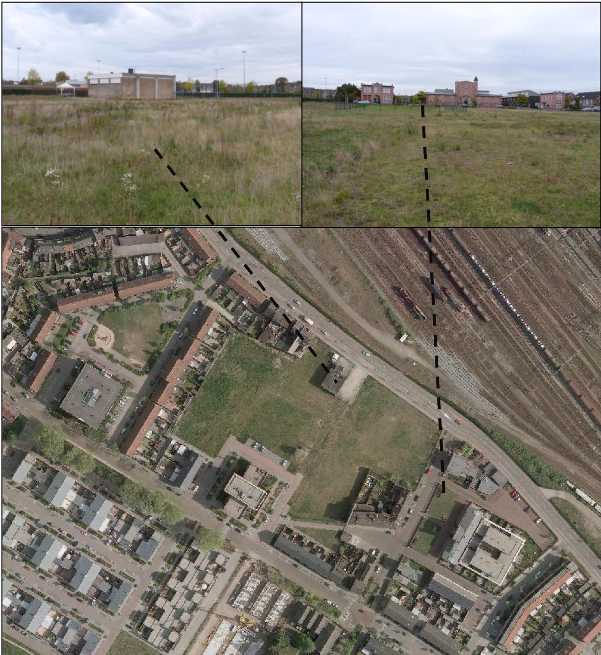
Figuur 2. Luchtfoto en detail foto's van de onderzoekslocatie, linksboven is de bedrijfsloods weergegeven die nog gesloopt zal worden.