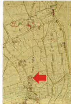
Uitsnede uit de kadastrale minuutkaart 1811-1832, die overeen komt met de luchtfoto