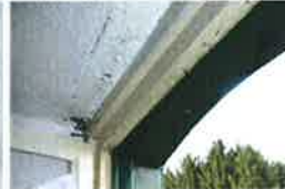
In de gestoogde bovendorpel zijn nog sporen van traliewerk aanwezig