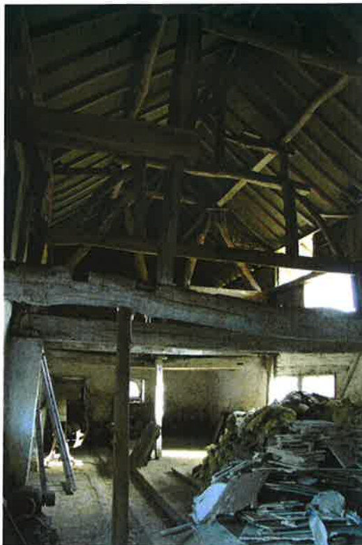
De schuur waarvan de oorspronkelijke vakwerkconstructie nagenoeg geheel bewaard is gebleven