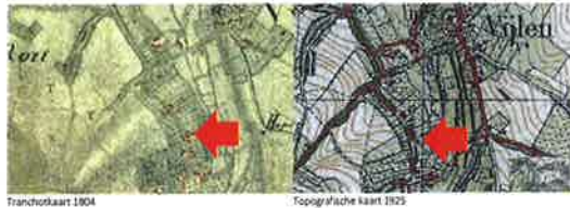
Kadastrale minuutkaart 1804

Naast de kadastrale minuutkaart zijn nog enkele topografische kaarten geraadpleegd uit 1804 en 1925. De topografische kaart (Tranchot) uit 1804 is onduidelijk. Dat geldt in iets mindere mate voor de topografische kaart uit 1925. Daarop lijkt het bouwvolume ten noorden van het woonhuis (3) te zijn verdwenen, het woonhuis met achterliggende schuur (1) in oostelijke richting verlengd en lijkt het voorheen vrijstaande vierkante bouwvolume (2) te zijn gekoppeld aan de schuur. De wijzigingen moeten ergens tussen 1830 en 1925 hebben plaatsgevonden. Nader kadastraal onderzoek zou het precieze jaar in beeld kunnen brengen. Een dergelijk onderzoek gaat echter te ver in het kader van dit deze quickscan. Op basis van het metselwerk kan worden aangenomen dat de schuur in de tweede helft van de 19 e eeuw is verlengd.