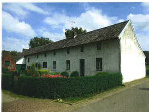
De noordgevel gezien van af de weg. Karakteristiek is eveneens de haag achter de voor het woonhuis gelegen bloemen- en moestuin