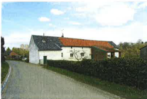
De zu deijke langgevel van het pand