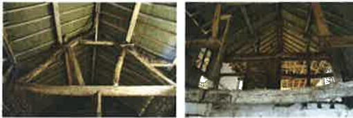
In het achterste spant is voor een deel nog de vakwerkruifing te zien, daterende uit de periode dat dit de achterzijde achtergevel van de schuur was (± 1850). De wand tussen schuur en woonhuis. Het bovenste deel van de spankconstructie is in de negentiende eeuw vervangen door een A-spant.