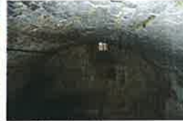
De grote leider aan de westzijde is, over de gehele breedte van het woonhuis (waars op het woonhuis geplaatst)