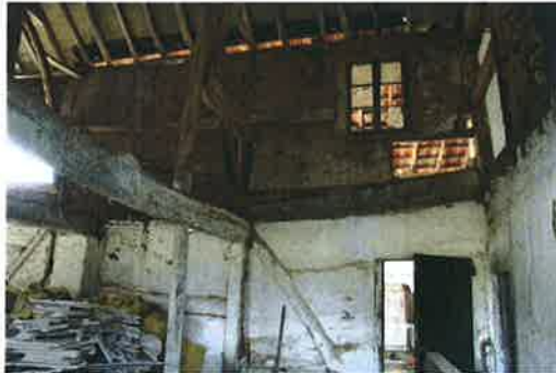
De zuidgevel van de schuur bestaat voor het grootste deel nog uit vakwerk met vlechtwerk en leempleister

Van de oorspronkelijke schuur is de vakwerkconstructie nog nagenoeg geheel bewaard gebleven. De zuidelijke langgevel van de vakwerkschuur is bijna nog volledig voorzien van vlechtwerk met leempleister. De noordelijke gevel is grotendeels versteend en voor een groot deel uitgevoerd in machinale baksteen. Het voorheen vrijstaande vierkante gebouwje (2) bevat inwendig nog oorspronkelijke spanten en in de achtergevel resten van vakwerk. Dit bouwvolume, dat eveneens is aangegeven op de kadastrale minuutkaart dateert in oorsprong van voor 1800. Het achterste deel van de schuur, het tussenlid tussen de schuur en het voorheen vrijstaande vierkante bouwvolume (2) dateren uit de tweede helft van de 19 e eeuw, evenals de aanbouw tegen de zuidgevel van het woonhuis in de nabijheid van de straat. De overkapping (schjopp) tegen de zuidgevel van de schuur is van latere datum.