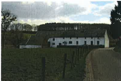
De hoordelijke langgevel van het pand