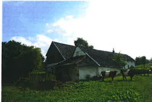
De achtergevel vanuit het noord-oosten gefotografeerd

De kern van het woonhuis en achterliggende schuur dateren echter met zekerheid van voor 1800. Op basis van de gekoppelde vensteromlijsting in de gevel (die van Agt in de 17 e eeuw dateert), de twee mergelstenen kelders, restanten van mergelmuren, schouwpartijen en vakwerkconstructies is het echter aannemelijk dat het pand veel ouder is, hoogst waarschijnlijk uit de 17 e eeuw.