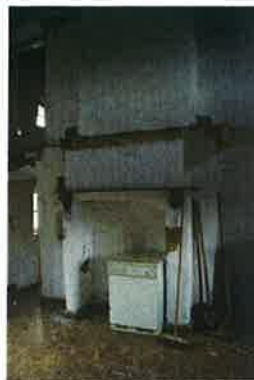
De meest oostelijke oude stookplaats; van deze stookplaats is geen schoorsteen meer zichtbaar op het dak