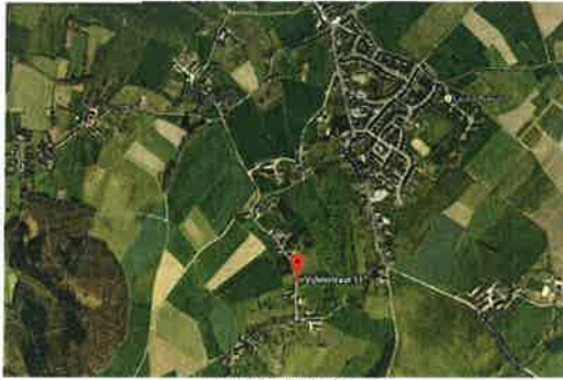
Situering van Vijenstraat 11 ten opzichte van de kern van Vijen

De Vijenstraat slingert vanaf de Panisberg bij de kerk van Vijen naar beneden, gaat vervolgens in oostelijke richting langs achter het zogenaamde Panhuis (nu Vijenstraat 57) en de Munnikshof (nu Vijenstraat nr 51). Vervolgens loopt de Vijenstraat in zuidelijke richting, tot aan de Groenstraat. Zowel in het zuidelijke deel van de Vijenstraat als in de Groenstraat zijn verspreid en geclusterd boerderijen aanwezig. Ten oosten van het pand ligt het Vijenerbos. De boerderij betreft een vrij gelegen object met een langgerekte bouwmassa, haaks op de weg. Het pand is vanwege zijn vrijstaande ligging en situering aan de voet van de berg vanuit het landschap goed zichtbaar.