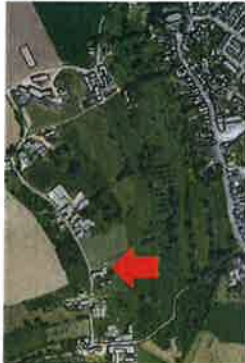
Luchtfoto waarop het gebouw (gebouwen) zijn geprojecteerd.