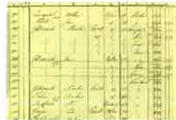
Uitsnede uit de OAT (bron: watwaswaar.nl)

← Uitsnede uit de kadastrale minuutkaart (1811-1832): het huidige woonhuis is aangegeven met een rode pijl. Het vierkante bouwvolume net hierboven is thans opgenomen in het bouwvolume van het woonhuis. Het grote bouwvolume ten noorden van het huidige woonhuis is inmiddels verdwenen. (bron: watwaswaar.nl)