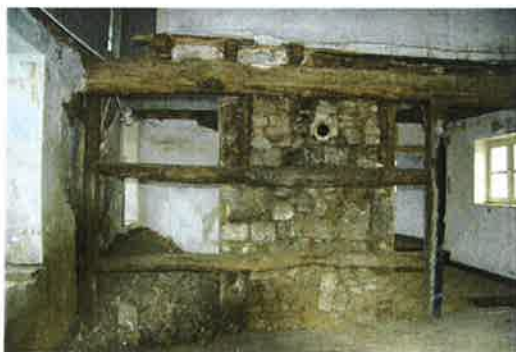
De meest westelijke oude stookplaats, gezien vanaf de (geenrijple) achterzijde. Aan de achterzijde is eventueel een vakwerk wand aanwezig