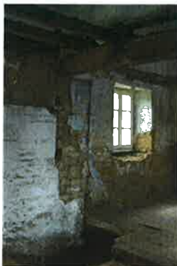
De zuidelijke buitenwand van het woonhuis bestaat nog voor een groot deel uit mergel