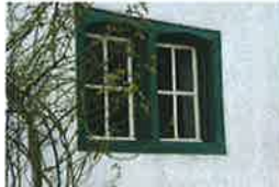
Het houten tweelichtsvenster met segmentbogen in de noordgevel