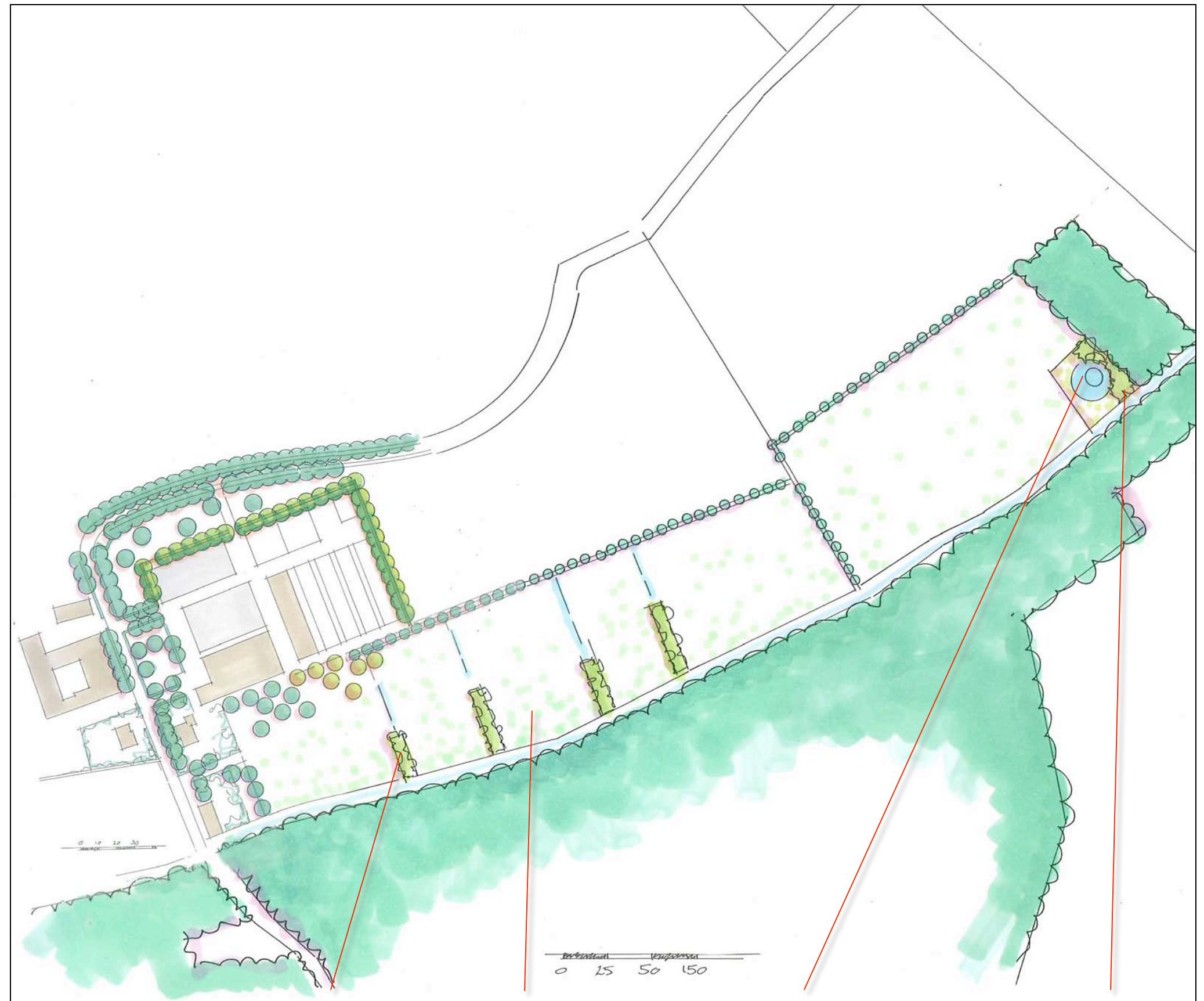
S1 wilgenstruweel bonte hooiweide Poel S2 Bloem en besrijk struweel

De omvang van de bouwkavel is in essentie ongewijzigd. De in 2008 vastgelegde tegenprestaties zijn fors van omvang en als zodanig te handhaven; zie de montage van de gewijzigde opzet van het erf in de tekening rechts.