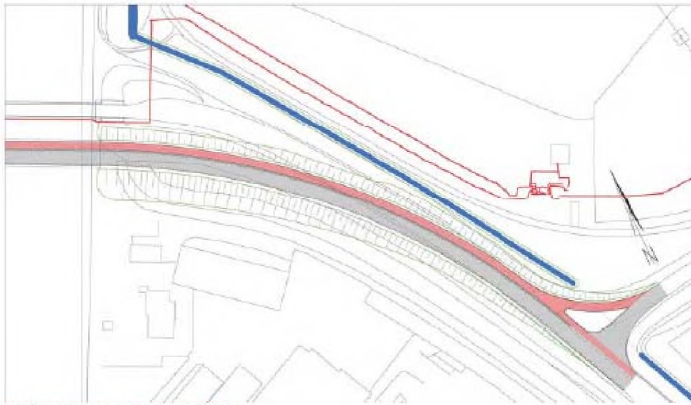
Figuur 4.5 Aanduiding Beek in nieuwe situatie

Onderstaand een intekening van de nieuwe positionering, afkomstig uit de variantenstudie.