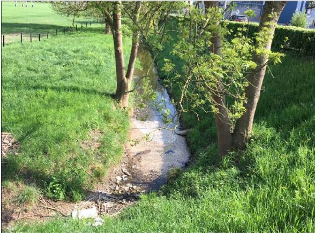
Foto bestaande Gelei, stroomopwaarts, zuidoost gericht; beek is circa 2 m breed.