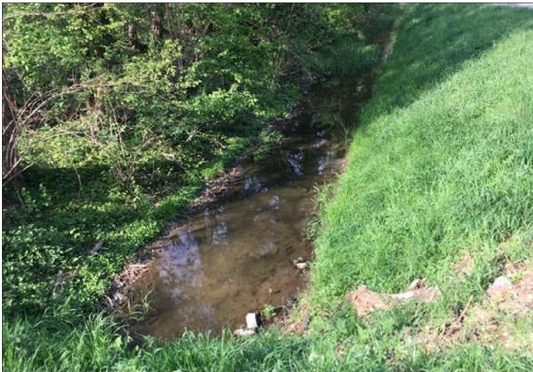
Foto bestaande Gelei, stroomafwaarts, noordoost gericht; beek is circa 3 m breed.