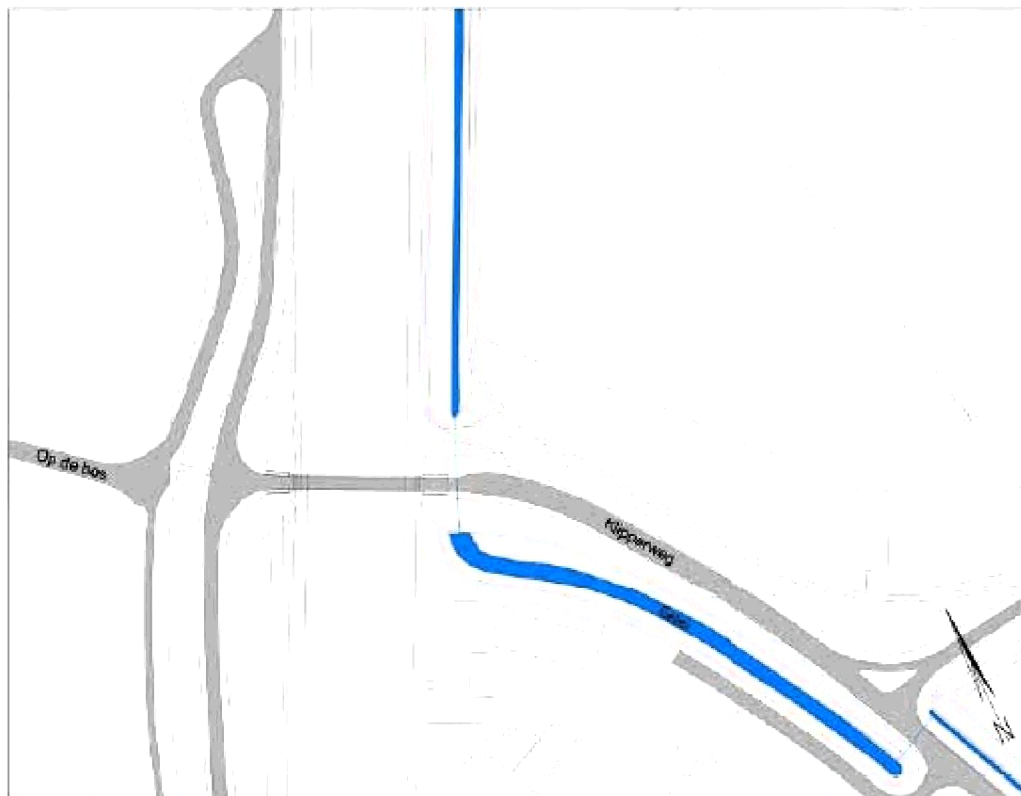
Figuur 3.2 – Aanduiding beekloop

Op de volgende tekening is de bestaande ligging van de Gelei ten oosten van brug Itteren weergegeven.