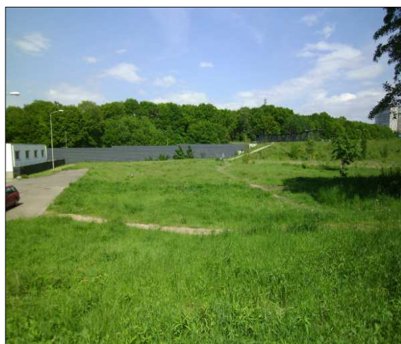
Onderzoeksgebied vanuit het zuidwesten .