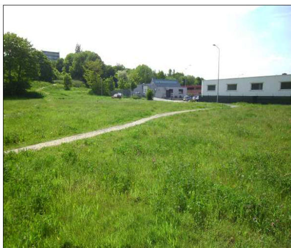
Onderzoeksgebied vanuit het noordoosten.

Het voornemen is om op het terrein de ontwikkeling van bedrijfskavels mogelijk te maken. Deze zullen worden ontsloten op de Kissel.