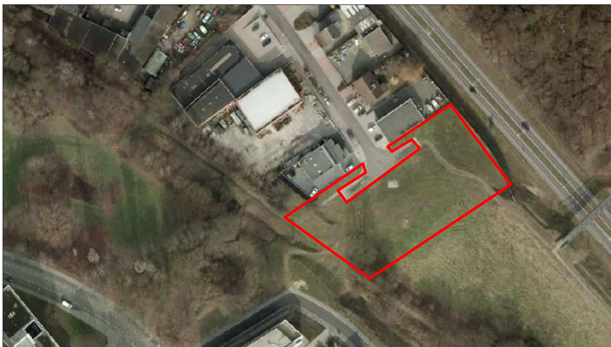
Globale ligging van het onderzoeksgebied.

De ontwikkellocatie maakt deel uit van het plangebied Kissel-Voskuilenweg. De locatie ligt direct ten zuidoosten van het bedrijventerrein de Kissel, aan de gelijknamige straat. De ontwikkellocatie ligt ingeklemd tussen bedrijfskavels aan de Kissel, de Euregioweg, een recentelijk beplant groen terrein en een dijk met wandelpad. De Amersfoortcoördinaten van het midden van de locatie zijn 198,4-322,2 2 .