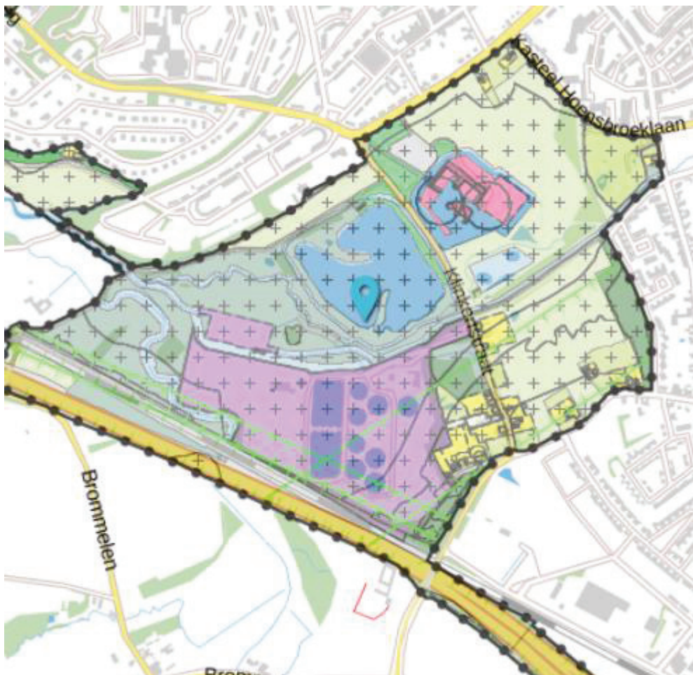
Figuur 4-1 Ligging van de RWZI in het voorontwerp bestemmingsplan 'Buitengebied'

In figuur 4-1 wordt het voorontwerp van het bestemmingsplan 'Buitengebied' getoond. De RWZI is gelegen in dit bestemmingsplan.