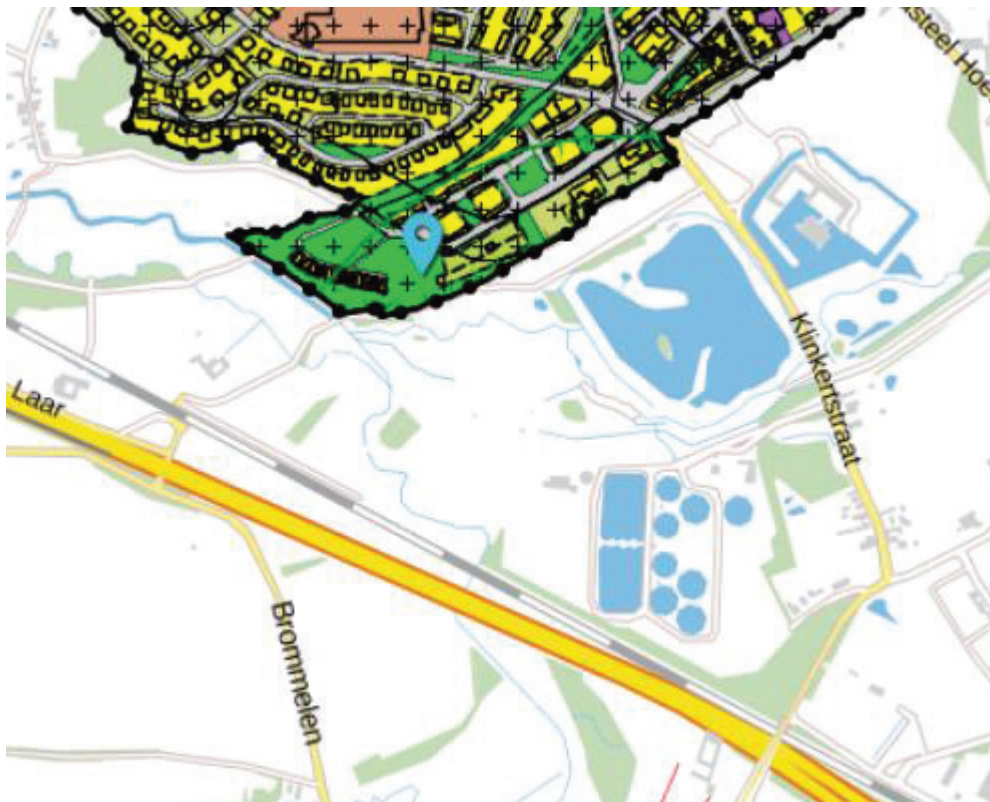
Figuur 3-1 Ligging van de RWZI ten opzichte van het ontwerp bestemmingsplan 'Hoensbroek Noord 2016'

In figuur 3-1 is de ligging van de RWZI ten opzichte van het ontwerp bestemmingsplan 'Hoensbroek Noord 2016' weergegeven.