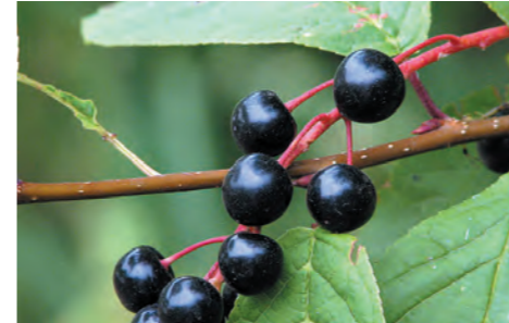
Speelbos: Prunus padus