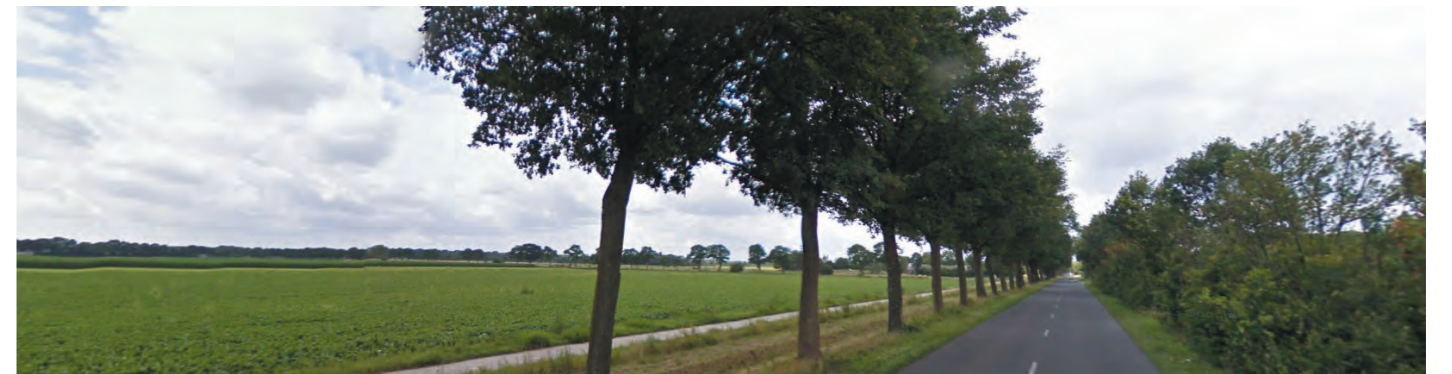
Afbeelding: Omgeving plangebied. [Google streetview]