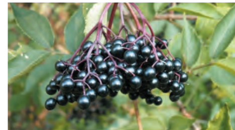
Speelbos: Sambucus nigra