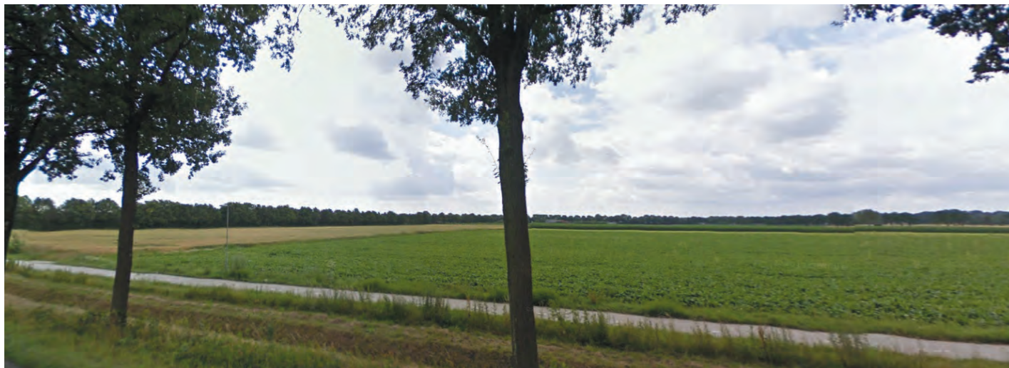
Afbeelding: Huidige bedrijfssituatie gezien vanaf de Nieuweweg.