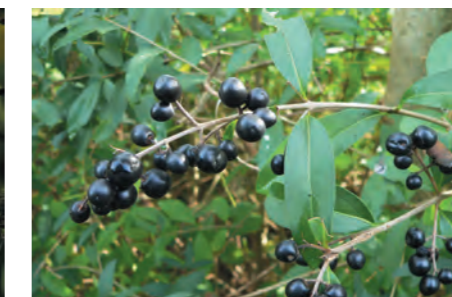
Houtwal: Ligustrum vulgare