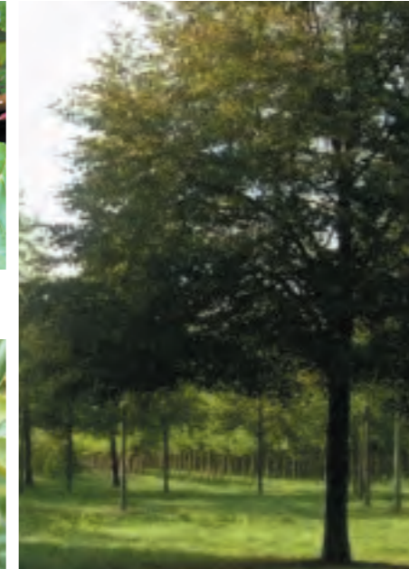
Speelbos: Tilia Cordata