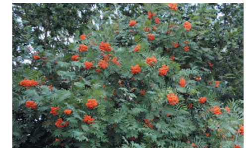
Houtwal: Sorbus aucuparia