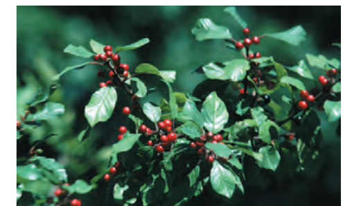
Houtwal: Rhamnus frangula