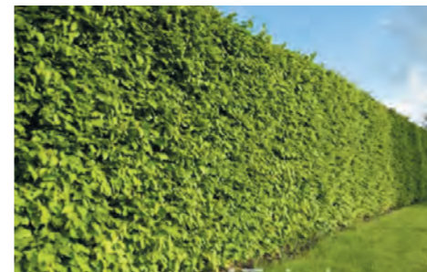
Kniphaag: Fagus sylvatica