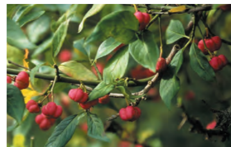
Houtwal: Euonymus europaeus