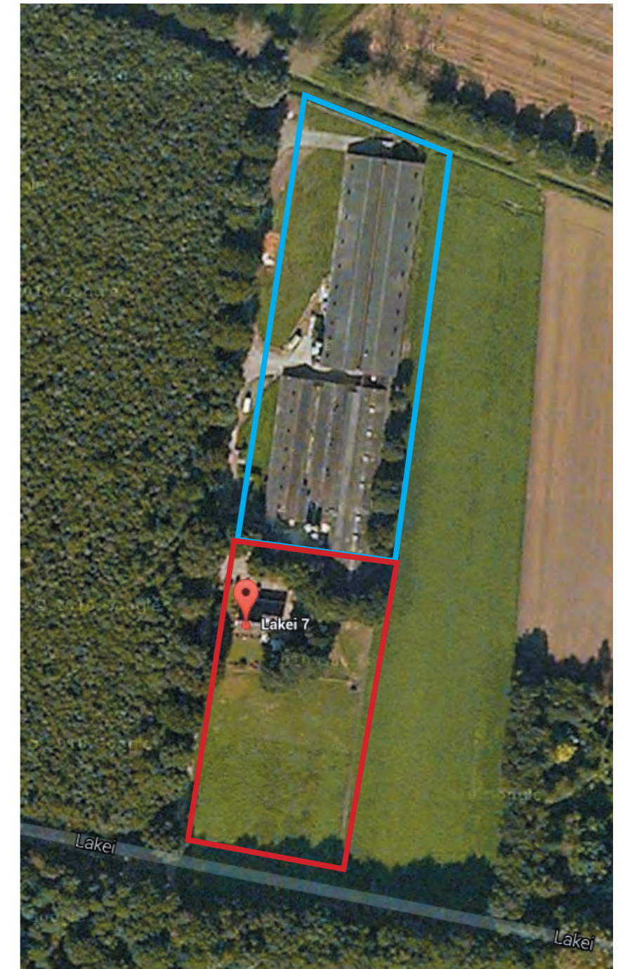
Afbeelding: Bovenaanzicht locatie Lakei 7, Afferden.