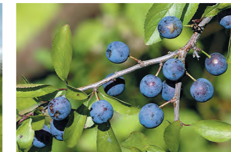
Houtwal: Prunus spinosa