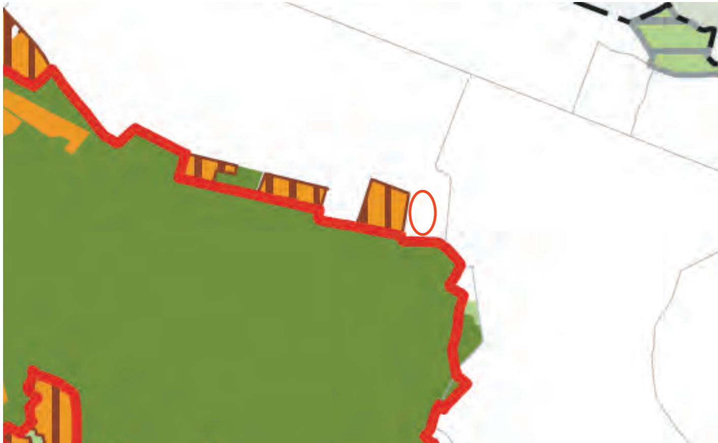
Uitsnede kaart: Groene waarden kaart Limburg [22 september 2006].