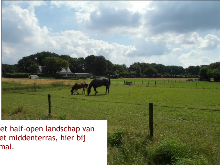
Het half-open landschap van het midenterras, hier bij Smal.

Overgangslandschap tussen de Maas en de Maasduinen. Vanouds vestigingsplaats, dus dorpen en boerderijen, de weg N271 en veel relatief kleinschalige en soms grotere akkercomplexen omzoomd met [voormalig] eikenhakhout.