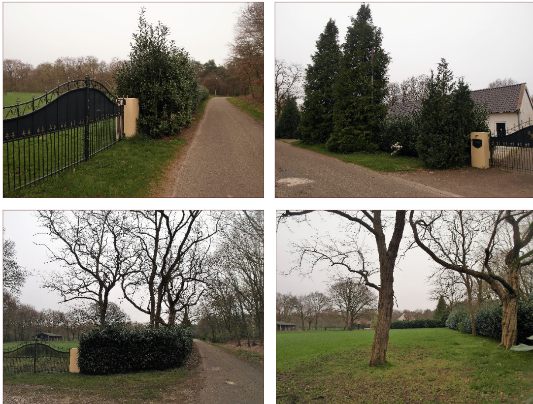
Figuur 2. Van linksboven met de klok mee: het noordelijke deel van de laurierkershaag, de naaldbomen voor de voorgevel, overzicht van het perceel vanaf de zuidzijde, de te snoeien acacia's.

Het zuidelijk gedeelte bestaat uit een grasland, met aan de zuidzijde enkele verspreide acacia's. Deze bomen zijn matig vitaal en met name aan de wegzijde bevatten de kronen veel dood hout. Snoei op korte termijn is hier, ook met het oog op de verkeersveiligheid, noodzakelijk. Langs zuid- en oostrand staat een dito haag van laurierkers.