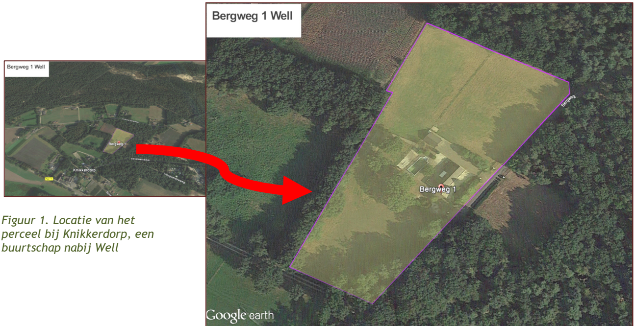
Figuur 1. Locatie van het perceel bij Knikkerdorp, een buurtschap nabij Well

memo inrichting bergweg 1 well 2017 versie 3 definitief