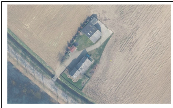
Figuur 1. Luchtfoto plangebied

In voorliggende ruimtelijke onderbouwing staat het perceel Ceresweg 1 in Bergen centraal. Het planvoornemen is om de ter plaatse aanwezige agrarische bedrijfswoning om te zetten naar een plattelandswoning. De schuur achter de woning wordt nog voor agrarische bedrijfsdoeleinden gebruikt. Op basis van het vigerende bestemmingsplan is dit planvoornemen niet mogelijk. Derhalve zal deze ontwikkeling worden meegenomen in het nieuwe bestemmingsplan voor het buitengebied van de gemeente Bergen. In het kader hiervan dient aangetoond te worden dat het planvoornemen passend is binnen de relevante beleidskaders en inpasbaar is als het gaat om de diverse omgevings-/milieuaspecten.