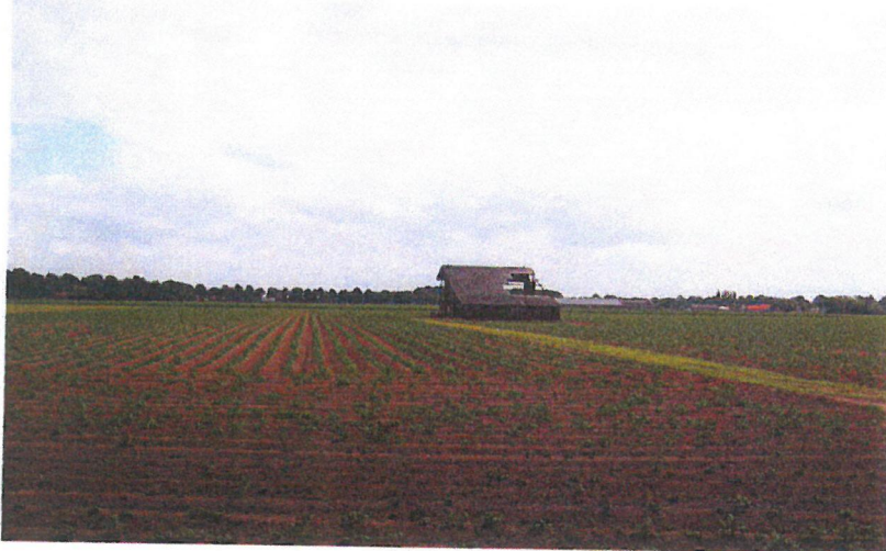
foto: af te breken loods

Voor wat betreft de tegenprestatie wordt een oudere loods van ca. 200 m 2 afgebroken. Indien de stallen niet gebouwd zouden worden, zou deze zijn blijven staan. Gezien de staat van de loods (zie foto) is dit een flinke kwaliteitsverbetering. Tevens kan de strook beplanting aan de noordzijde grotendeels als tegenprestatie worden gezien.