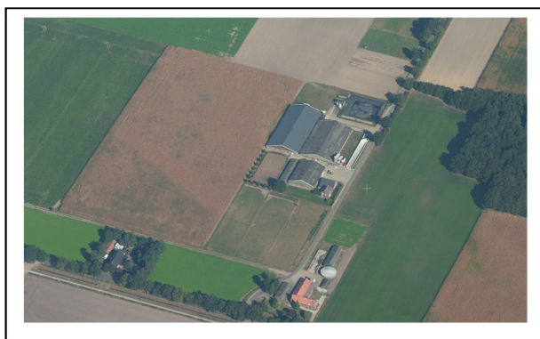
Figuur 1. Luchtfoto bestaande situatie

In voorliggende ruimtelijke onderbouwing staat het perceel Beltweg 10 in Siebengewald centraal. 25 september 2013 is voor deze locatie een omgevingsvergunning verleend voor de realisatie van een varkensstal. De eigenaar van het perceel wil graag de mogelijkheid hebben om de varkensstal, in verband met nieuwe dierenwelzijnseisen, wat ruimer op te zetten. Om deze ontwikkeling mogelijk te maken moet het bouwvlak verruimd worden. Deze verruiming wordt meegenomen in het nieuwe bestemmingsplan voor het buitengebied van de gemeente Bergen. In het kader hiervan dient aangetoond te worden dat het planvoornemen passend is binnen de relevante beleidskaders en inpasbaar is als het gaat om de diverse omgevings-/milieuaspecten.